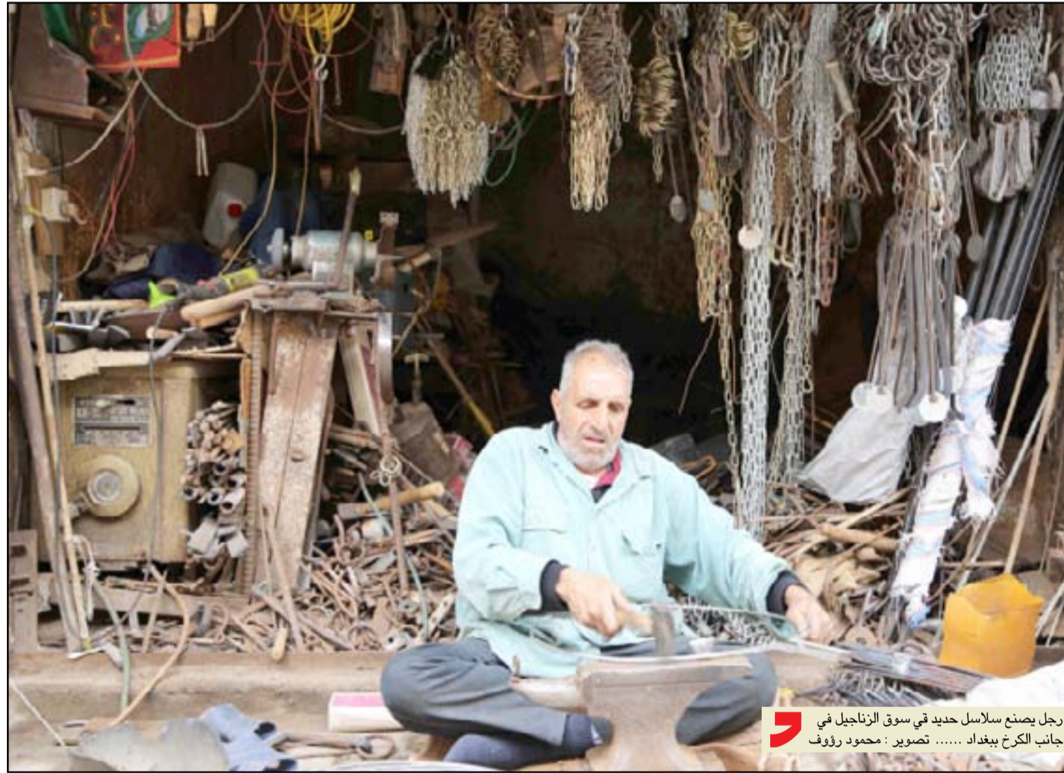
رجل يصنع سلاسل حديد في سوق الزنجابيل في جانب الكرخ ببغداد..... تصوير: محمود رؤوف