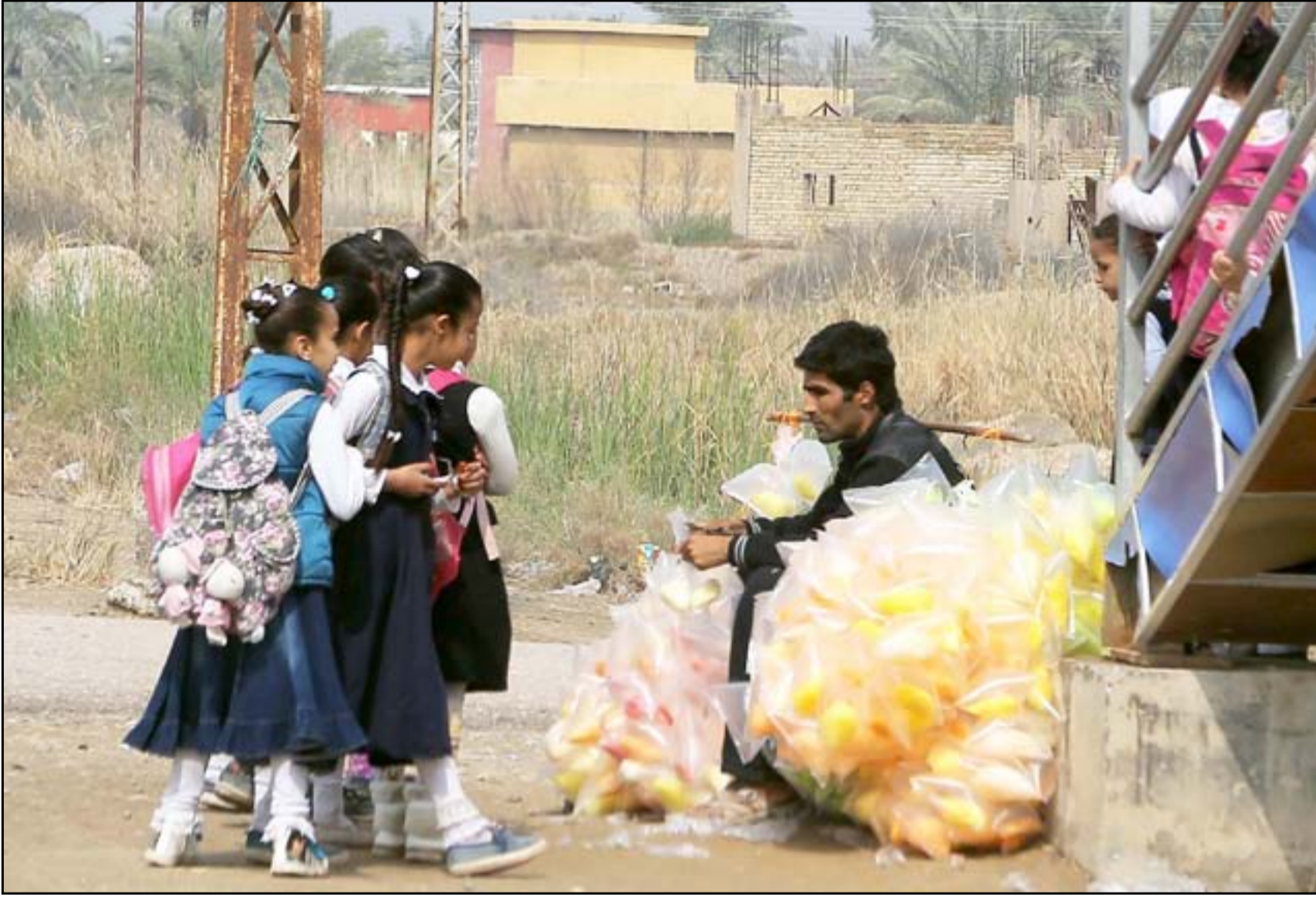
طالبات يشترين الحلوى من بائع جوال قرب إحدى المدارس جنوب بغداد