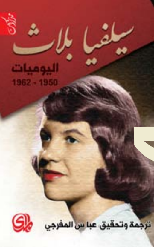
ترجمة وتحقيق عباس المرفجي

وحازت مذكراتها حضوراً واهتماماً منذ شهر تموز ولغايته أيضاً عام 1903، ثلاث سنوات كاملة. وبعض منها التقاطات متحكم بها من رسائل مرسله لأصدقاء. وتميزت فترة دراستها بعناية خاصة من قبلها على الرغم من تسيب بعض الاشكالات الشخصية التي طرأت على شخصيتها واعني بها الاضطراب النفسي. الكثير في مذكراتها، ووضوح الصراحة والدقة والذهاب بشكل قوي نحو ما تريد التأكيد عليه وعلى سبيل المثال: سجلت في يومياتها الأولى تموز 1900. ربما لن أكون سعيدة أبدا، لكني الليلة راضية. لا شيء سوى منزل فارغ. ارهاق غامض من يوم مفضي في زرع سيقان براعم الفراولة في الشمس، قدح من لبن حلو بارد وضحن مسطح من ثمرات العنبيبة المغفورة بالقسطة. أدرك الان كيف