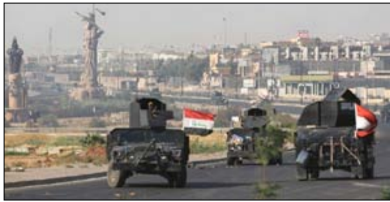
أليات عسكرية منتشرة في كركوك خلال عملية إعادة الانتشار.. أرشيف