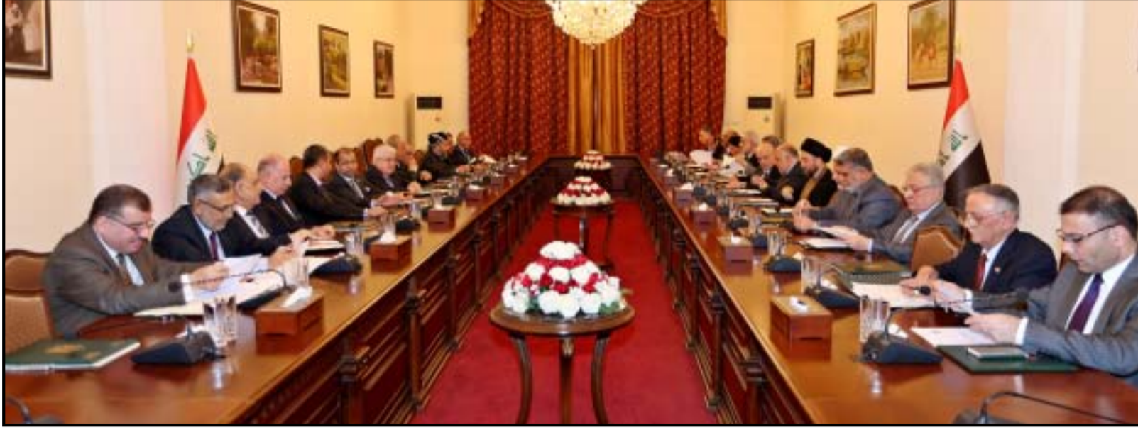
اجتماع سابق لرئاسات الثلاث بحضور رؤساء الكتل السياسية.

■ الكتل السنيّة تتلقّى رسائل اطمئنان بتخصيص تريليون دينار لإعمار المدن وإعادة النازحين