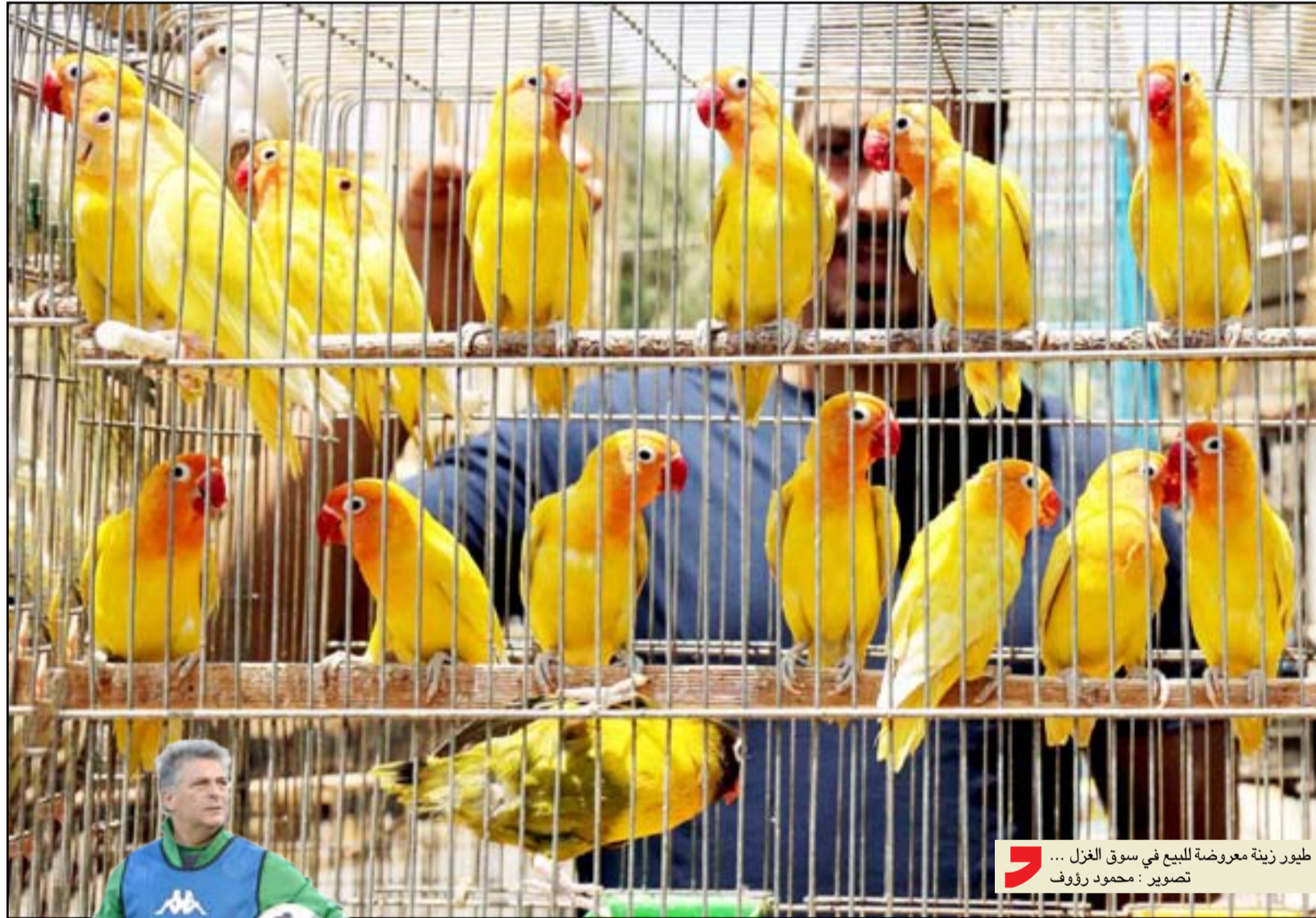
طيور زينة معروضة للبيع في سوق الغزل ...

الشرطة يطعم بملاحقة المتصدّر عبر بوابة الجوية