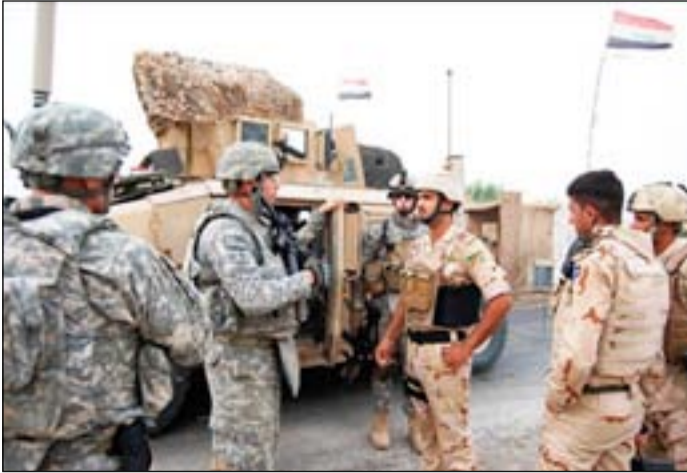
مستشار في التحالف الدولي بجانب جنود عراقيين.. ارشيف

وكانت الحكومة العراقية قد نكرت أيضاً إنها تريد من التحالف الدولي الذي