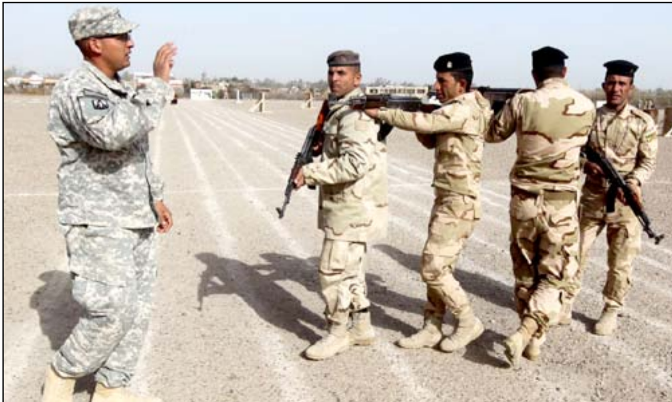
مستشار في التحالف الدولي يدرّب جنوداً عراقيين.. (أرشيف)

مجالاً واسترسل بقوله "يقوم حلف الناتو الآن بتوسيع حجم تدريباته التي تشتمل على سبيل المثال مكافحة العصابات النافسة وتدريبات في مجال الطبابة العسكرية وإدامة وصيانة المعدات وفي مجالات كثيرة أخرى.. نخطط أيضاً لمساعدة العراقيين في تأسيس مدارس وأكاديميات عسكرية تقوم بتدريب مدربيها وتعليمهم من أجل تحسين طاقاتها لتهيئة مدربين بنفسها". وأضاف إن حلف الناتو سيعمل مع العراق أيضاً لإجراء إصلاح مؤسستي "يتضمن مكافحة الفساد.