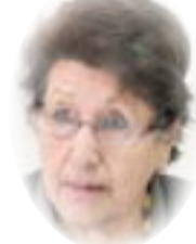
□ هريدة النقاش

فلم يتعود قراء الصحف الأميركية على أن يقرأوا تحقيقات أو آراء تنتقد سلوكيات أصحاب الصحف، وتدخلهم المباشر أو غير المباشر في التحرير، ولقيامها بهذا الدور حصلت الدونوات الأميركية على صديقة واسعة لدى الملايين. قدم لنا أن العلم والتقدم التكنولوجي والثورة التقنية أفقا جديدا، وأنوات أتاحتها للمناضلين من أجل حرية، لايلبثوا بها وإنما كأداة بدورها لتغيير العالم إلى الأفضل، ووضع أهداف ثورتنا، التي يريد البعض دفنها في النسيان. موضع التنفيذ، ويعرف المكافون من أجل الحرية كل دروبها الجديدة الآن.