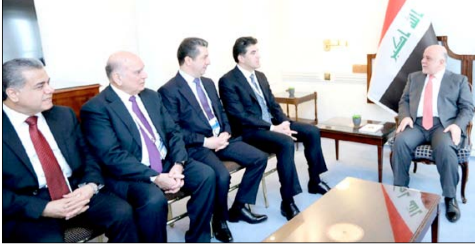
بارزاني يترأس وفدا كرديا خلال لقائه العبادي.. (أرشيف)

تدرس القوى الكردستانية خيارات عدة للرد على تمرير قانون الموازنة الاتحادية لعام 2018 بمبدأ الأغلبية، مهددة بمقاطعة الانتخابات البرلمانية المقبلة أو الانسحاب من العملية السياسية. ويخوض الأميركان والأمم المتحدة وبعض القادة السياسيين العراقيين حراكا لتقريب وجهات النظر بين الحكومة الاتحادية وإقليم كردستان بشأن تخفيض حصة الإقليم من الموازنة الاتحادية.