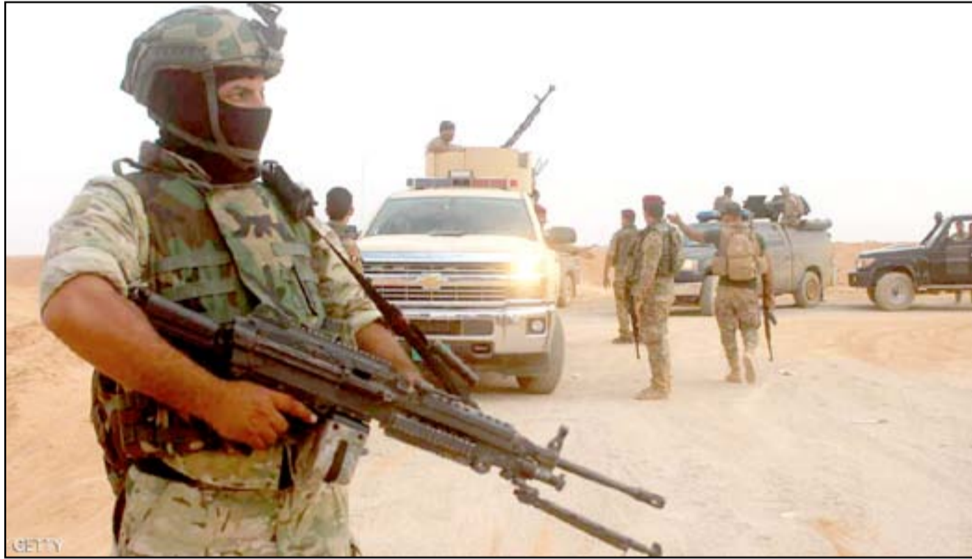
قوة عسكرية غرب الأنبار..

وأضاف معروف قائلاً "أغلب الأسر تعاود النزوح بسبب مشاكل مالية والافتقار إلى الخدمات ومشاكل أمنية... كثير من العوائل يعبرون عن خشيتهم على حياتهم، أما بالنسبة لأطفال مسلحي داعش فإن الإشكال بشأنهم مستساغ، فكلهم يرجعون لأباء أموات