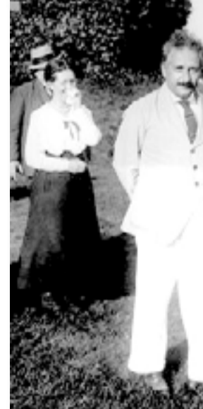
أينشتاين مع وليام فوكنر

أما الفرض الثاني لأينشتاين، فهو إن سرعة الضوء مستقلة عن حركة مصدره، فسرعة الضوء البالغة ١٨٦٠٠٠ ميل/ في الثانية ثابتة دائماً في أي مكان على سطح الأرض ولا تتأثر بالمكان أو الزمن أو الاتجاه، فعلاً، في قطار متحرك، يسير الضوء بالسرعة نفسها تماماً التي يسير بها خارج القطر. وما من قوة تؤثر عليه فتجعله أسرع أو أبطأ، وزيادة على ذلك، ما من شيء يسير بسرعة أكبر من سرعة الضوء برغم أن الإلكترونات تقترب كثيراً من هذه السرعة، والواقع إن الضوء لتقديهما إلى المختصين، ووجد في هذا العمل متعة مكنته من التعرف على أفكار المخترعين الصغار. ونجده ذات يوم يسأل صديقه