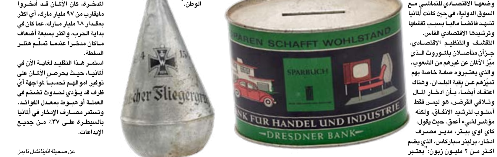
عن صحيفة فاينانشل تايمز

إيضاً هو أن معدل إدخارهم مستقرة على مدار الزمن، ولا تتأثر بأي أزمة اقتصادية أو أي تغييرات تحصل في معدل الفائدة. استناداً إلى المؤرخ الاقتصادي البروفيسور، هارولد جيمس، فإن التزام الألمان بموروث الإدخار، يعكس أبعاداً ديموغرافية وتاريخية وحتى نفسية، مؤكداً بقوله: "على سبيل المثال، الألمان هم أكثر قلقاً واهتماماً من الأميركيين، أنهم يعتقدون بأنه يتوجب عليهم الاستعداد لأي شيء طارئ أو أي مساوئ قد تحل بهم، وأنه يتوجب عليهم أن يكونوا مستعدين لمواجهة تلك الأزمة. وهناك تقليد ييني بروتستانتي يدعو لهذا السلوك أيضاً، باتباع الإدخار والتكشف، ويشير هذا التقليد إلى أن الفضيلة تعني التحلي عن الاكتفاء الحالي". ويضيف البروفيسور إلى أن الإدخار في ألمانيا، يتجاوز حدود الفائدة الشخصية الضيقة، فهو تقليد ينظر إليه على أنه نشاط ونظام يوفران خدمة على مستوى النطاق الجماعي والوطني أيضاً، مشيراً إلى أن الحصة هي رمز إلى مصير وقوة بلدنا ألمانيا، قوتنا