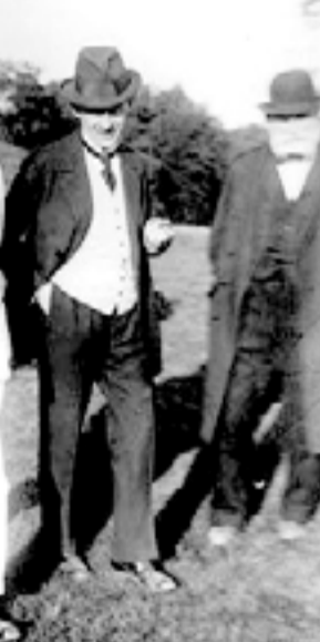
أينشتاين مع وليام فوكنر

جاء أول حافز حقيقي في حياته من طالب فقير اعتاد تناول الطعام مع أينشتاين، فقد أحضر له هذا الطالب ذات يوم سلسلة كتب علمية مصورة، يقول أينشتاين: "قرأت تلك السلسلة باهتمام بالغ". وقد ساعد هذا الطالب أينشتاين على اكتشاف عجائب الرياضيات، وفي ذلك الوقت اكتشف الفلسفة وهو في عمر الرابعة عشرة حين أهداه عمه كتاب إيمانويل كانط