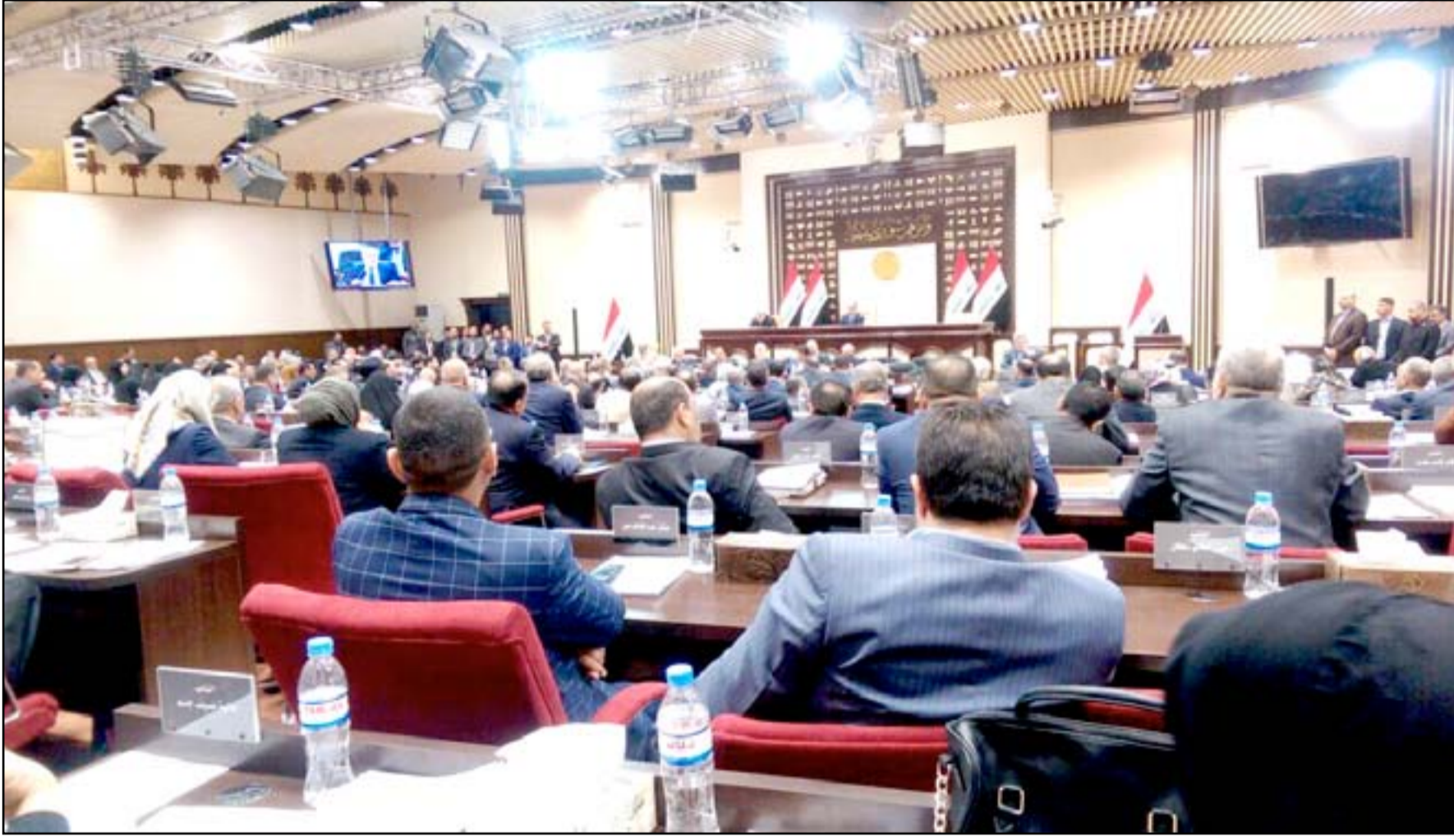
جلسة سابقة لمجلس النواب..

نص على تعيين الملف الأمني ومنع الاعتقالات لأغراض سياسية