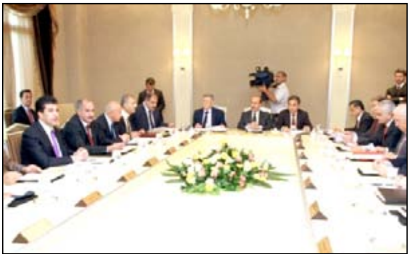
اجتماع سابق لمجلس وزراء إقليم كردستان

3- ستعرض حكومة إقليم كردستان، خلال الأيام المقبلة، جميع إيراداتها الداخلية والعائدات النفطية، والمبلغ المرسل من قبل بغداد، إضافة إلى المساعدات الأمريكية المخصصة للبيشمركة وآلية إنفاقها.