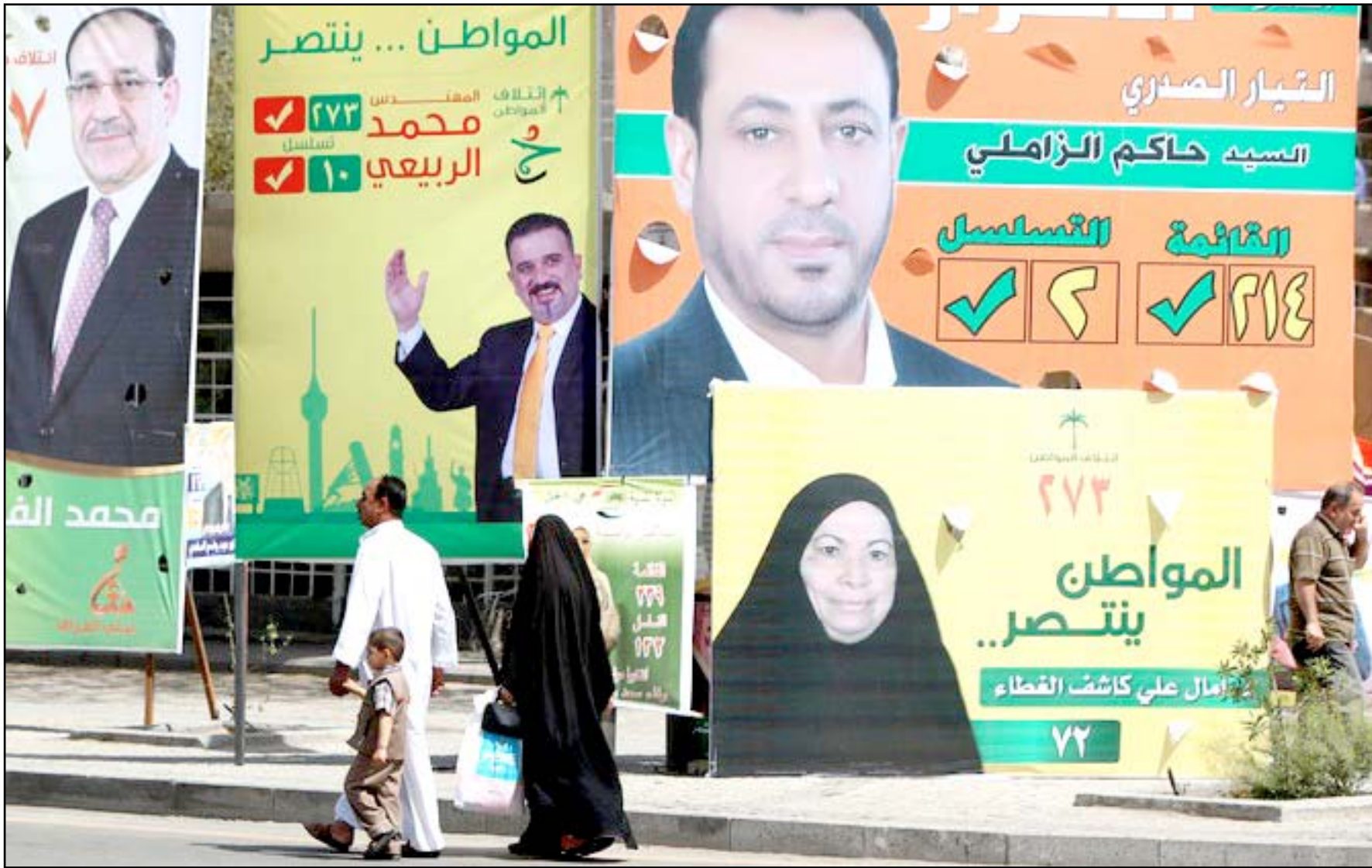
لافتات انتخابية في بغداد.. (أرشيف)

ويستكمل البكوع حديثه بالقول إن هيئة المساءلة والعدالة أرسلت قوائم المرشحين إلى مفوضية الانتخابات على شكل ثلاث وجبات، حيث ضمت الأولى المرشحين غير المشمولين بإجراءاتها، والثانية المستبعدين، والثالثة المرشحين الذين سيتم استدعائهم من قبلها.