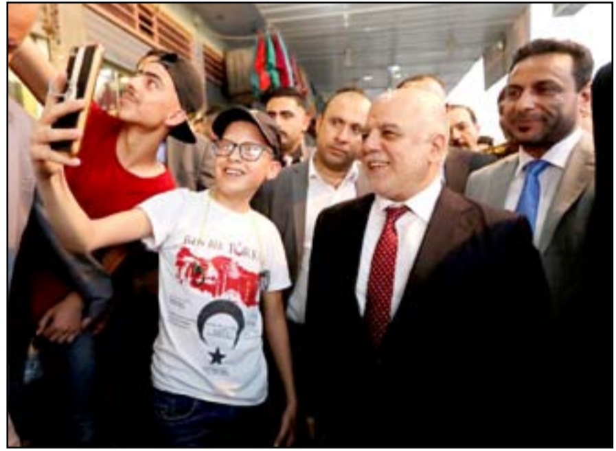
العبادي يتجول في سامراء أمس

الدين واستقرارها". وأشار رئيس الوزراء إلى أنّ الإرهاب الذي أراد أن يفرقنا فشل وشعبنا انتصر وها هي جامعاتنا تتحول مرة أخرى إلى رموز للعلم والتعاضد، وأعرب عن سعاده بـ "عودة جامعة تكريت لممارسة دورها بعد أن كانت أحد مقرات تنظيم داعش خلال سيطرته على المدينة". وأضاف العبدي، أنّ الهدف الأساس من العمليات العسكرية هو تحرير الإنسان، ولا بد من استكمال الجهود لإعادة جميع النازحين إلى ديارهم والإسراع بتوفير الخدمات الأساسية.