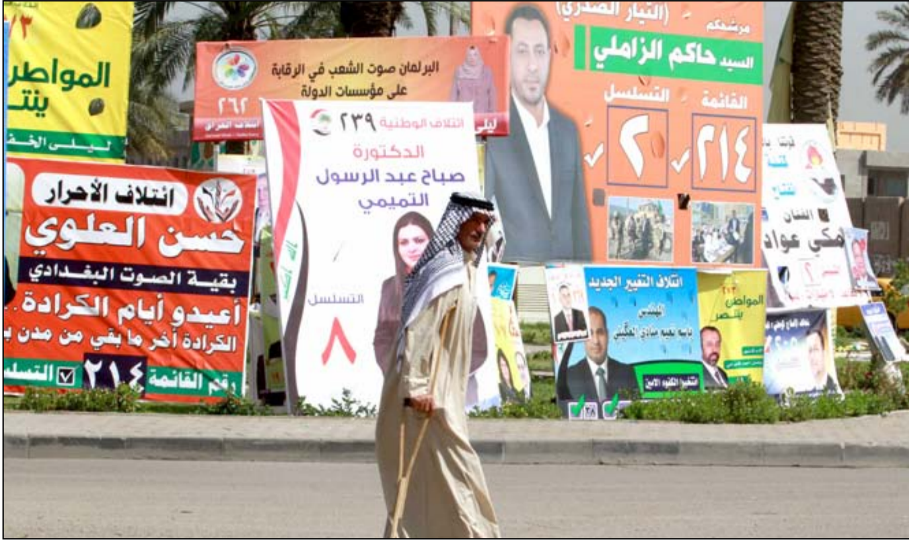
لائحة انتخابات في شوارع بغداد خلال انتخابات 2018

ويلزم قانون هيئة المساءلة والعدالة بإنهاء عملية التدقيق والفحص لأسماء المرشحين خلال فترة زمنية لا تزيد على أسبوعين، كما منح الحق لكل مرشح يتم استبعاده الطعن أمام الهيئة التمييزية القضائية المختصة خلال فترة لا تتجاوز الـ 30 يوماً. وتبين المصادر التي رفضت الكشف عن هويتها أنّ عدد المرشحين الذين تم استبعادهم من قبل هيئة المساءلة والعدالة بسبب تشابه الأسماء أو نقص في وثائقهم بلغ نحو (382) مرشحاً، لافتة إلى أنّ عدد المرشحين