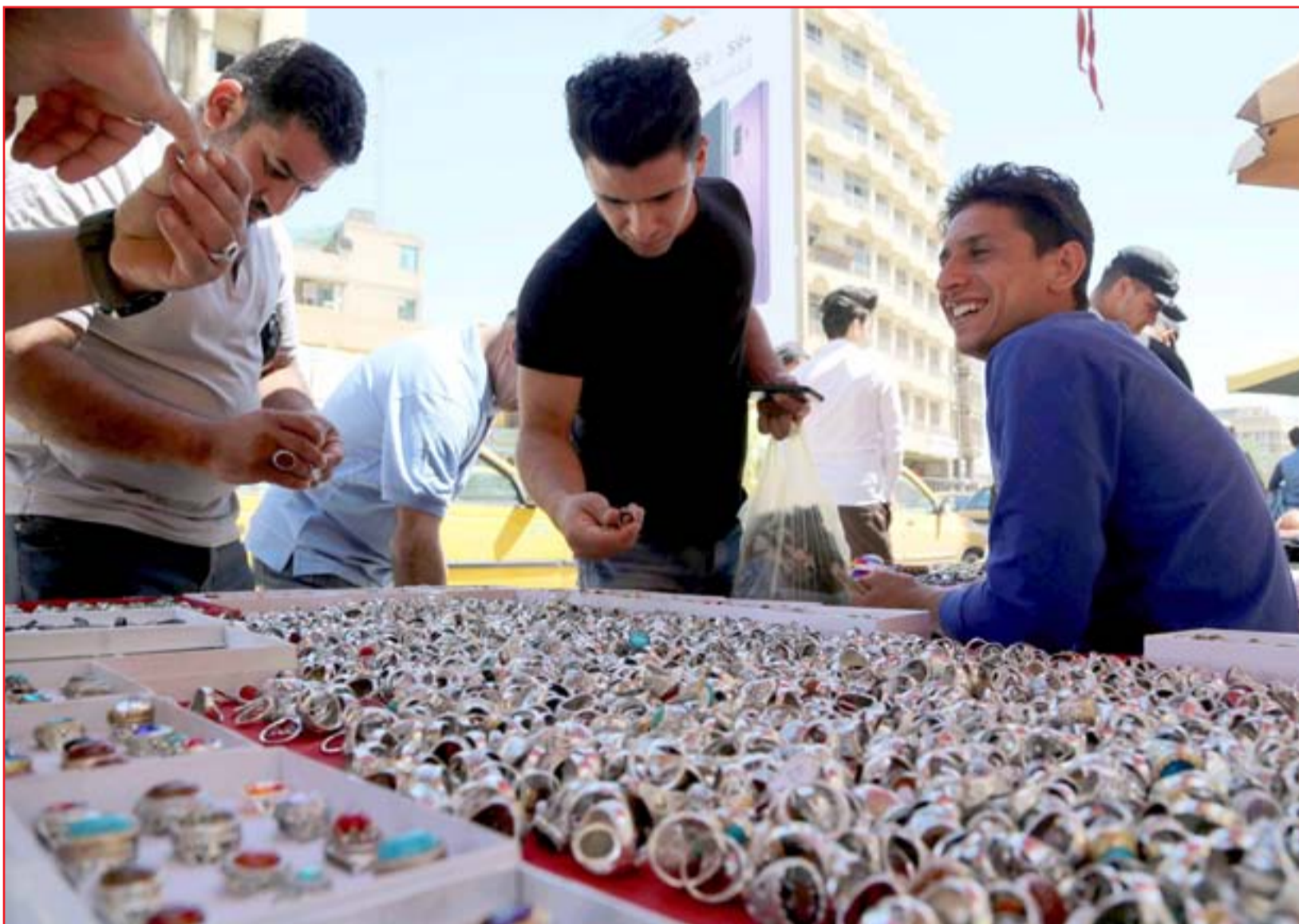
بسطة لبيع الحابس في سوق الشورجة ..... تصوير: محمود رؤوف