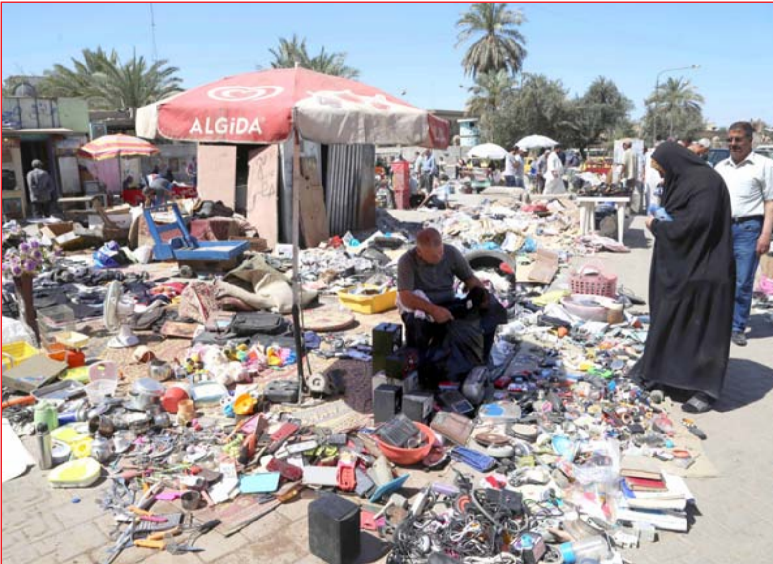
ازدهار أسواق بيع المواد المستعملة في بغداد ..... تصوير: محمود رؤوف

معصوم وعلاوي يُبرقان إلى السيسي بمناسبة إعادة انتخابه