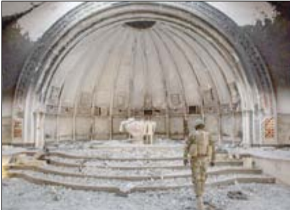
جندي في احدي كنائس الموصل

الكنايس في العراق معرضة للخطر. ويقول بطريك السريان الأرثوذكس اغناطيوس أفريم الثاني، إن هناك خطراً حقيقياً في ان المسيحية قد تتحول إلى متحف أو شيء أثيري في الشرق الاوسط، مشيراً إلى أن العراق قد 80 إلى 90% من تعداد سكانه المسيحيين. وشهدت قرى مسيحية قليلة بدء عملية اعاده اعمار بطيئة ومضنية بتقنيات تبرعت بها منظمات أجنبية مثل منظمة، فايفتس اوف كولومبوس الأمريكية ومنظمة جيجان ان نبيد الخيرية. وكان نائب الرئيس الاميركي مايك بينس، قد تعهد مؤخرًا بمساعدة المسيحيين، ولكن هذه المساعدات لا تكفي للتقليل من معاناتهم. ومن بين الدول الاوربية تعهدت المجر بإنقاذ مسيحيي العراق حيث افتتحت الحكومة العراقية مؤخرًا مدرسة للنازحين المسيحيين في اربيل وحضر وزير الموارد البشرية المجري زولتان بالوغ مراسم الافتتاح. عن: معهد جيستون الاميركي