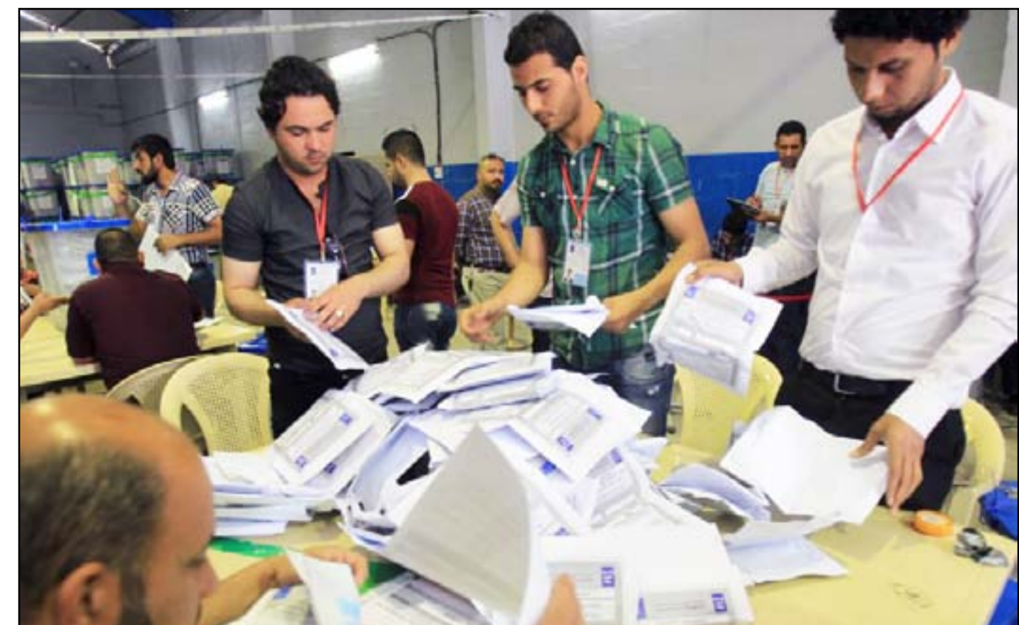
موظفون يجرون عملية العد والفرز...

طبعت 14 مليون بطاقة ووزعت نصفها على الناخبين