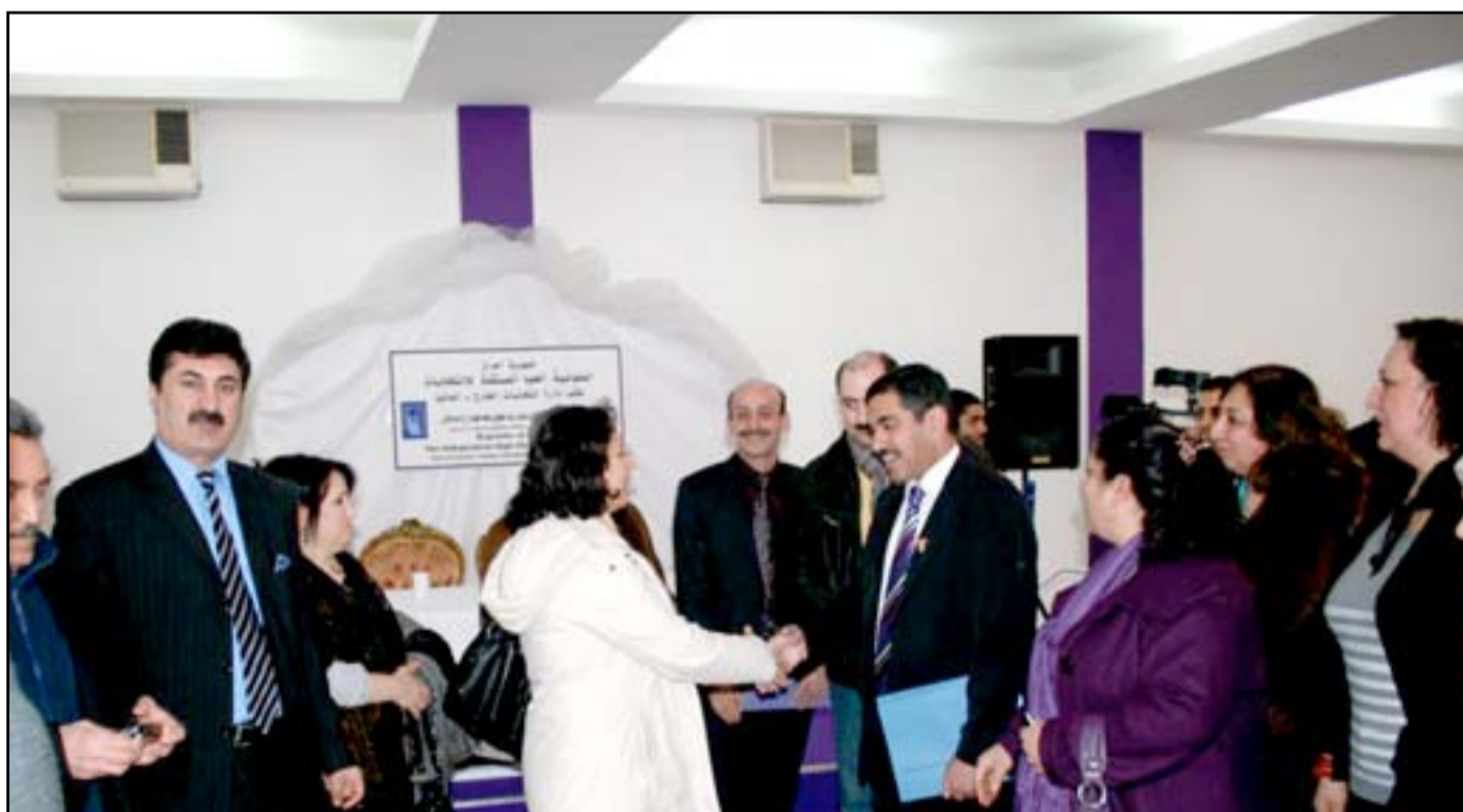
مكتب تابع لمفوضية الانتخابات في ألمانيا... (أرشيف)