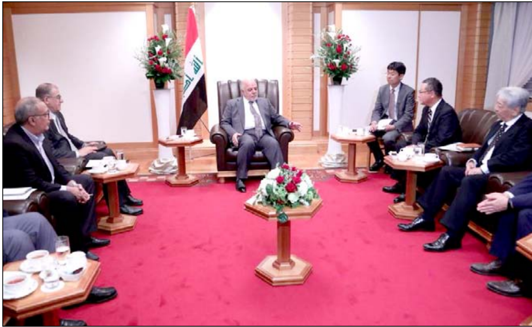
العبادي خلال لقائه وفدا من مدراء الشركات اليابانية أمس

وأكد الشمري أن "الزيارة تستغرق بضعة أيام سيبحث فيها العبادي الملف الاقتصادي وخصوصاً في مجال بناء المدن الصناعية، وملف الاستثمار، وتشجيع الشركات اليابانية الكبرى للدخول كمساهم أساس في مجال الاستثمار، إضافة إلى مجال الطاقة". إلى ذلك دعا جواد البولاني، عضو اللجنة الاقتصادية في مجلس النواب، العراق إلى توسيع مجال التعاون مع اليابان في عدة مجالات. وقال البولاني لـ(المدى) أمس: "علينا الاستفادة من التجربة الصناعية والثروة الزراعية في اليابان. يجب أن ندخل الآن عالم الصناعة ونقل الاعتماد على النفط".