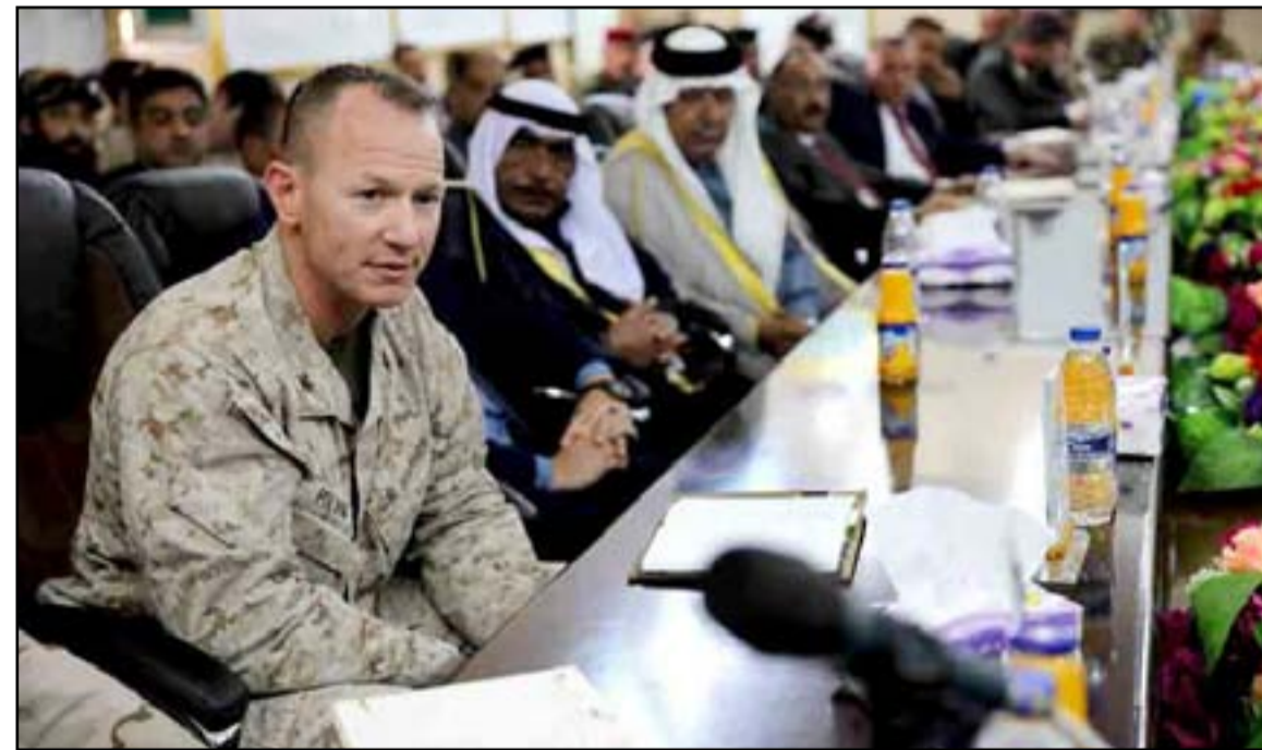
المسؤولون العراقيون والأميركان خلال اللقاء

وأضاف القائد الأميركي قائلاً أنه "بعد تحرير الأراضي العراقية لم يعد أي مكان لداعش يتحكم فيه الآن ولم يعد قادراً على الابتزاز وأخذ الضرائب ولم يعد