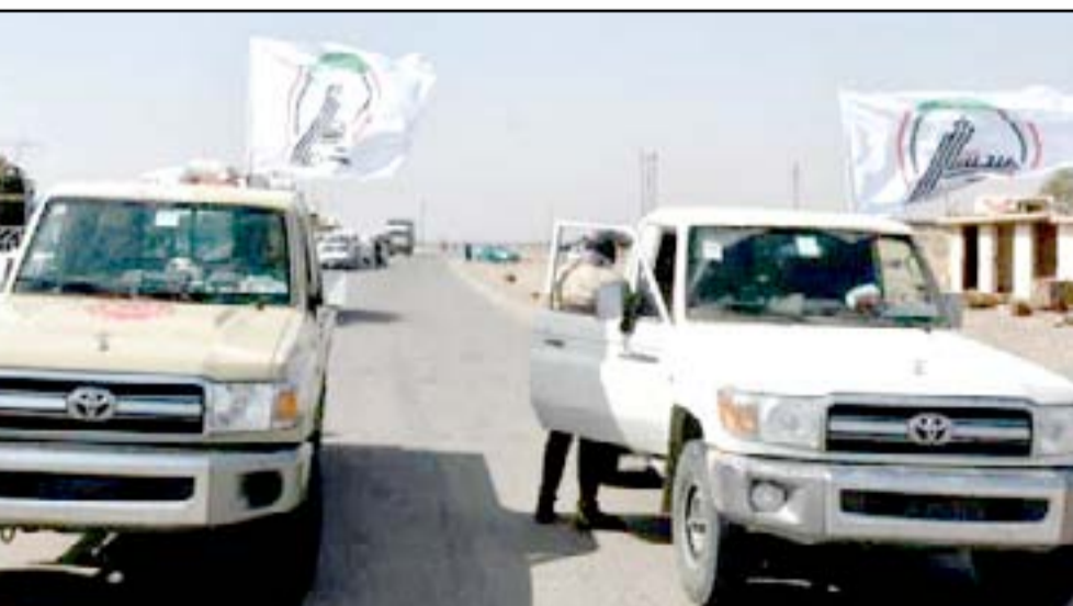
عوائل نازحة تعود الى بيبي أمس

يذكر ان الحشد الشعبي والقوات الامنية حررا قضاء الحويجة في اواخر العام الماضي (٢٠١٧) من سيطرة تنظيم داعش. وكان الحشد الشعبي، قد اعلن، الإثنين، ٢٧ "خلال الفترة من (٢٤/٢ ولغاية ٢٠١٨)، ١٨ عملية نوعية في مناطق كركوك قتل خلالها ٨٢ عنصراً من داعش وجرح ٢ آخرين، بضمنهم قادة بارزون، فضلاً عن ضبط أسلحة متنوعة وتفكيك عجلة مفخخة وأحزمة ناسفة وتدمير مضافات وأنفاق". مبيناً أن "العمليات التي تمت بناء على معلومات استخبارات الحشد شهدت مشاركة الحشد والشرطة الاتحادية، وخلية الصقور وطيران الجيش، وتوزعت العمليات في ٢٠ قرية هي: العاقولية، والعزيزية، وسرود، وتل