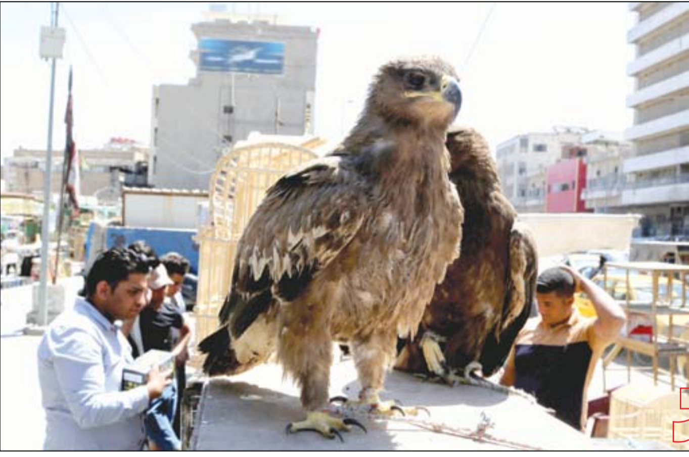
طيور معروضة للبيع في سوق الغزل وسط بغداد... تصوير: محمود رؤوف

أثار تكليف مفوضية الانتخابات ٣٨ مديراً عاماً ومعاوناً لإدارة المكاتب والمراكز الانتخابية في الخارج الموزعة على تسعة عشرة دولة عربية وأجنبية استثناء الأقليات، واتهم نائب مسيحي المفوضية بتقسيم المقاعد على أساس المحاصصة بين السنة والشعبة والكرد من دون النظر إلى المسيحيين. تأتي هذه التطورات في الوقت الذي تكثف فيه وحدة إدارة انتخابات الخارج التابعة