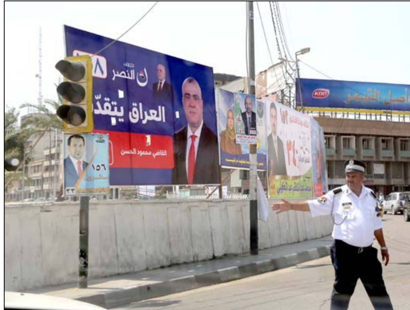
لافتات انتخابية في بغداد...

معرفة مصادر تمويل الأحزاب وضبط إنفاقها على حملاتها الانتخابية أمر تصعب السيطرة عليه، كون قانون الأحزاب من القوانين الجديدة التي تتطلب وقتاً طويلاً لتنفيذ جميع فقراته"، مؤكداً أن "نظمة الحملة الدعائية في قانون الأحزاب تعتمد على معادلة حسابية معينة لتمويل الأحزاب من قبل الحكومة".