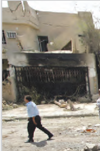
هدم بقايا مصنع البازوك