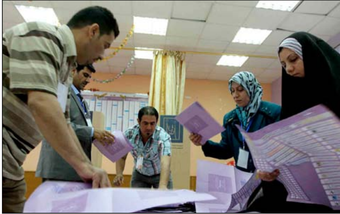
موظفون يجرون عملية العد والفرز في انتخابات ٢٠١٤.

تواجه مفوضية الانتخابات ضغوطاً من كتل وكيانات انتخابية لاعتماد آلية العد والفرز اليدوي بدلاً من الإلكتروني في فرز النتائج، لكنها ما تزال مصممة على اعتماد النظام الإلكتروني في فرز الأصوات. وتؤكد أن إعلان النتائج سيتأخر لعدة ساعات بعد إغلاق المراكز الانتخابية من أجل التأكد من سلامة النتائج التي نقلت عبر القمر الصناعي.