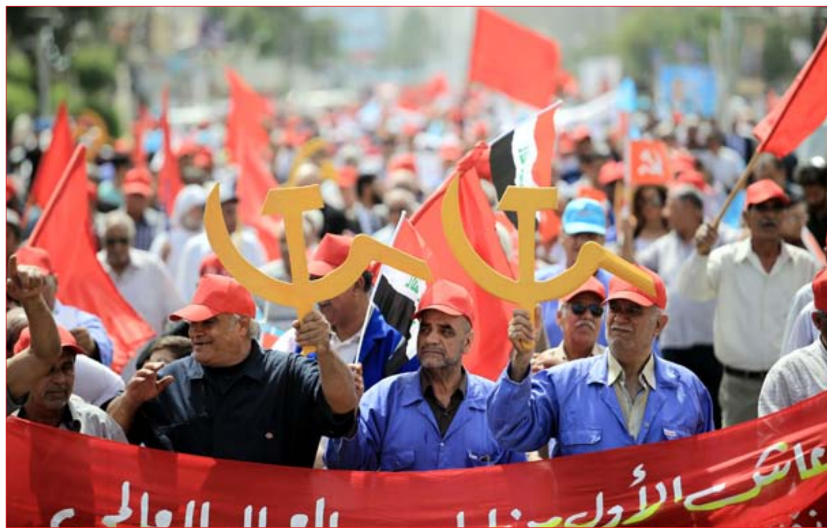
عمال في مسيرة تزامناً مع عيدهم وسط بغداد أمس ..... عدسة: محمود رؤوف

التحالف الدولي يعلن إغلاق "المركز البري" لقواته في العراق