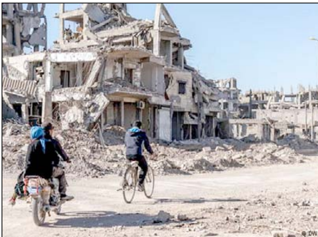
حي مدمر في الموصل

جماعات مختلفة في بنسوى وهناك توترات في ما بينها، وأن الأمر الأخر الذي ما يزال يعيق عودة النازحين هي الانقراض والعبوات الناسفة التي لم ترفع بعد وتواجد الجثث تحتها". ويشير المسؤول الأممي إلى أن الوضع في الجانب الشرقي من الموصل مختلف تماماً حيث عملية إعادة الإعمار تجري بأقصى نشاطها، مؤكداً "هناك المواطنون الإغنياء لهم القدرة الحصول على قروض من أصدقاء ومؤسسات، كذلك قام القطاع الخاص بتوفير مولدات الكهرباء والماء الصالح للشرب التي عجزت الحكومة على توفيرها، حيث يقومون بجلب الماء في شاحنات ولكن المشكلة هو هل لديك مال كافٍ لتدفعه مقابل ذلك".