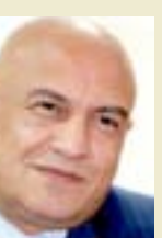
أربع وعشرون ساعة كأنها الدهر ، مرت من تاريخ الحركة الرياضية العراقية ، دخلنا خلالها في نفق تلك الأسئلة أو غيرها.

تبعاً لهذا الحال ، صرنا نحن الإعلاميين وقوداً لانتقادات الناس بعد خمس عشرة سنة من عمر اللجنة الأولمبية العراقية بعد التغيير السياسي ، ذلك لأننا نبشر بالغد ، ونحاول أن نقلل من شأن الأزمات تحت بند الحرص على ألا تنفلت الأوضاع الرياضية في بلادنا ، وإذا بأزمة تنشأ بين ليلة وضحاها ، من قبيل اختطاف النائب الأول لرئيس اللجنة الأولمبية العراقية ، لندخل جميعاً في مهمة البحث عن الإجابة لأسئلة متكررة مستعصية من قبيل : من يقود الرياضة ؟ من يخطط لها ؟ من يشعل نذر الأزمات فيها ؟ من يسوق هذه الأزمات ؟ من يخرج منها رابحاً بينما يتساقط الآخرون من حوله؟ أربع وعشرون ساعة كأنها الدهر ، مرت من تاريخ الحركة الرياضية العراقية ، دخلنا خلالها في نفق تلك الأسئلة أو غيرها ، بعد أن غارنا تماماً مقعد التقييم للنشاط الرياضي الذي دخل السبات بعد إكمال المكتب التنفيذي للجنة الأولمبية مدة ولايته الرسمية .. ولم نجد (رأساً) واحداً في اللجنة الأولمبية خرج إلينا أو إلى الناس ليفسر لنا ماذا جرى وما الذي يجري! نحن نعرف وجوهاً لها تاريخها وأسماؤها وبريقها (تلعب) في واجهة المشهد الرياضي منذ سنوات ، ولا نجاح حقيقي لها في العمل الإداري إلا تجسيد كل شيء انتظارا لجهول سيأتي .. وقد كنا بعد التغيير السياسي نمضي النفس في أن نجده نجومنا وقد امتلكوا الفرصة والقرار في إدارة العمل الرياضي ، فماذا كانت النتيجة بعد سنوات الانتظار ثم سنوات العمل ؟ ليس سوى الفوضى السوداء .. وليس سوى الصبر والحد على الصبر .. وليس سوى الإحجام عن تناول أية أزمة .. وليس سوى الهروب من حل أية مشكلة سواء كان شأنها ضئيلاً أو فادحاً!!