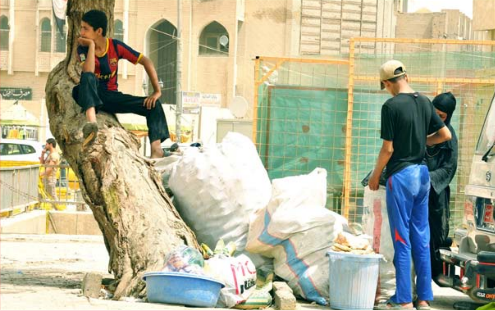
أطفال يجمعون بقايا الطعام وعلب المشروبات الغازية الفارغة في بغداد الجديدة السبت الماضي