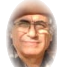
□ رشيد الخيون

بعد سيد قطب (أعدم 1966)، في معاليه، وكان على ما يبدو كتاب أزمة، حقق للنبا اقتران الجماعة بالصحابة الأوائل، فقال بجاهلية المجتمع اليوم، وعلان الحاكمية (راجع معالم في الطريق)، والكلام بالفاظه ومعانيه مأخوذ من أبي الأعلى المودودي (ت 1979)، أحد أبرز منظري الإسلام السياسي. من حق الإسلاميين، مثلما تفعل الجماعات غير الدينية، إضفاء الكمال العلمي والعمل على مؤسسيهم وقادتهم، لكن ما لدى الإسلاميين أخطر من سواهم، لأن العلم عند أصحابهم «إلهم رباني»، فهو إذا تكلم يشبه الأنبياء والأولياء، فأى كلمة قالها، وإن كانت ضد الوطن، مقدسة صحیحة المقصد: مثل «طن في مصر»، ومن قبل نطقها الإسلاميون العراقيون بعبارة مختلفة: «نوبوا في الخميني...»، والأخير زعيم دولة أجنبية، كيف يتم الذوبان في طاعته؟! أرى معنى العبارة إن «طن في مصر»: «طن في العراق». لا يجد «الإخوان»، بعد التسعين، شيئاً مخالفاً في مسيرتهم، مع أن اغتيال البنا نفسه جاء «تبادل في الرؤوس» (يوسف، «الإخوان»، المسلمون وجذور التطرف الديني). لم يكتب تلك الأخطاء إلا القادة «الإخوانيين» الذين خلعوا البيعة، فمن «في نهر الحياة» سيرى مسؤولية البنا شخصياً عن الغيالات، فكانت الإشارة بتمنى «الخاص» من فلان، مثلما حدث للخان زندار (في نهر الحياة)، فكان رأس البنا برأس رئيس الوزراء العراقي (اغتيال 1948)، وبعد حين يقف أحد أمتهم محمد الغزالي (ت 1996)، ويشهد لصالح قاتل فرج فودة (1992)، على أنه نفذ حكم الشريعة، وعندما أتى «الإخوان» للحكم أطلقوا سراحه، فانضم له النصر، أقول: عن أي مجد يتحدث «الإخوان»، في بكرى التسعين، وقد انقضت عقودها في خدعة «الحاكمية»، وخدعة أنهم الجيل الثامن من الصحابة؟! عن «الاتحاد الاماراتية»