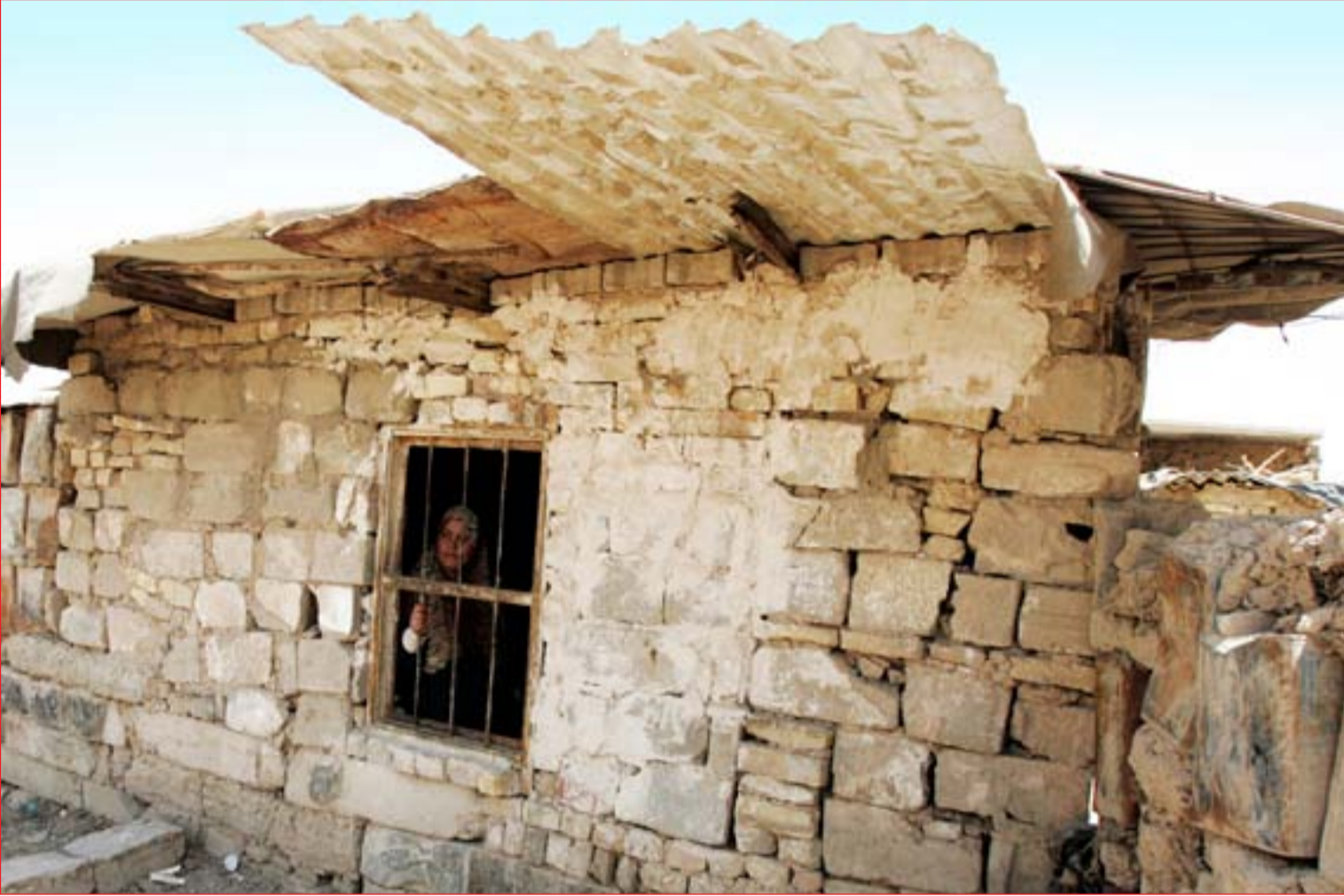
امرأة تنظر بأمل من شبك غرفة عشوائية قبل الانتخابات...

بغداد/ وائل نعمة تمتد أيدي القوى السياسية المتنافسة في الانتخابات إلى "كوتا" الأقليات لزيادة مقاعدها في البرلمان رغم ضمانها ٣٢٠ مقعداً في مجلس النواب تتنافس عليها أحزاب زاد عددها على ١٤٠ حزباً. وتحاول هذه القوى، خاصة الأحزاب المتنفذة في السلطة، عبر مجموعة من التدابير والمغريات ضم