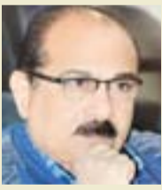
نتمنى الاهتمام بالإعلام المرئي والمقروء والمسومع والالكتروني ليكونوا داعمين وفاعلين في مجال تطوير كرة القدم.

تلك أبرز نقاط الثقافة الاحترافية التي تسعى الدول التي تريد أن تصل للعالمية وتسجل حضوراً قوياً في المشاركات والمناقشات الدولية، ويبقى السؤال الذي يطرح نفسه: أين نحن من الاحتراف ومتى سنرى أنديتنا نموذجية وتتمثل بها جميع متطلبات الاحتراف، ومتى سنرى الشعرة في نهاية النفق؟!