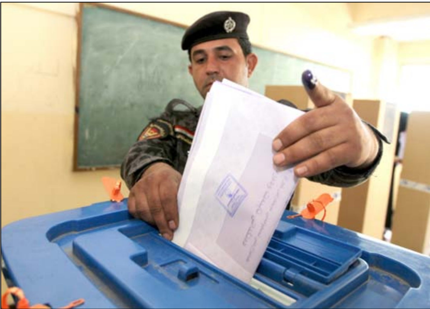
□ بغداد / محمد صباح تفتتح المراكز والمحطات الانتخابية أبوابها اليوم الخميس أمام عراقيي الخارج والناخبين المشمولين بالتصويت الخاص. في غضون ذلك تبدي منظمات مراقبة للشأن الانتخابي تحوفاً من مشكلة رافقت عملية المحاكاة التي نفذتها المفوضية لفحص الأجهزة الإلكترونية تمثلت في صعوبة ربطها بالقمر الصناعي لتأمين عملية نقل النتائج إلى بغداد. ويقول الخبر في الشأن الانتخابي عامل اللامي في تصريح لـ(المدى) إنّ "خضول الأجهزة الإلكترونية واعتماد صندوق الاقتراع الذكي والبطاقة الإلكترونية سيقلل من حالات التدخل البشري وتزوير النتائج". ويؤكد اللامي أنّ "زيادة عمليات الرقابة المحلية والدولية ووكلاء الكيانات الانتخابية على المراكز والمحطات الانتخابية ستقلل من حدوث أية خروقات أو حالات تزوير"، لافتاً إلى أنّ "الصمت الانتخابي سيكُون قبل ٢٤ ساعة من التصويت العام (يوم السبت)". ويجدد مجلس الوزراء موعد الانتخابات البرلمانية في ١٢ أيار المقبل بعدما أكد التزامه بتوفير الأجواء الآمنة واللائمة لإجراء الانتخابات، وإعادة الناخبين إلى مناطقهم. وكان مسؤول أمني في قيادة عمليات بغداد قد أكد لـ(المدى) اكتمال إجراءات تأمين ١٨٠٠ مركز انتخابي في عموم مناطق العاصمة رغم وجود تهديدات من الجوامع الإرهابية باستهداف هذه المراكز. ومن بين هذه الإجراءات إغلاق مداخل العاصمة بدءاً من صباح يوم أمس الأربعاء أمام مركبات الحمل والدراجات النارية، وقد تغلق مداخل العاصمة بصورة كاملة يوم السبت المقبل، فيما لم تقرر الخطة الأمنية بعد فرض حظر للتجوال من عنده، ونصّت على أنّ هذا الإجراء متروك

يذكر أنّ رئيس الوزراء حيدر العبادي قد رشّح في مطلع العام 2٠١٥ الياسري لرئاسة هيئة النزاهة، حيث صدر الأمر الديواني بتكليفه لشغل هذا المنصب بتاريخ 6 نيسان 2٠١٥.