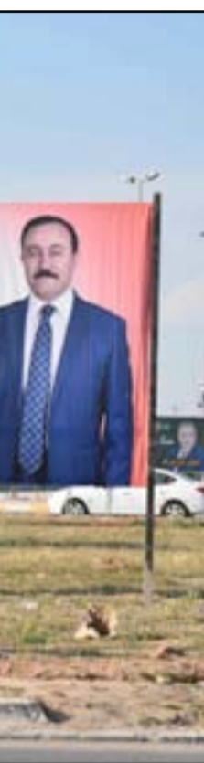
لافتات انتخابية في كركوك.

الانتخابات للنظر بالشكاوى ورفض مطلب المكونات العربية والتركماني النتائج الأولية للانتخابات، مبيناً أن اللجنة التقت في مقر جهاز مكافحة الإرهاب بمبمظلي الكيانات