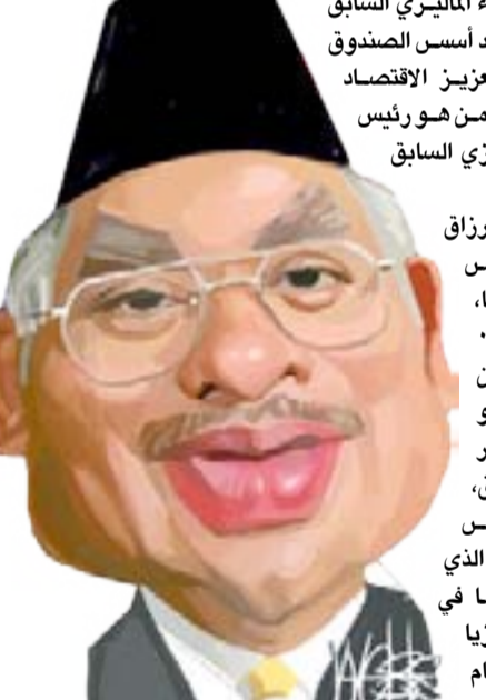
شغل نجيب رزاق منصب رئيس وزراء ماليزيا منذ انتخابات ٢٠٠٩، وهو النجل الأكبر لثون عبد الرزاق، ثاني رئيس وزراء ماليزيا، الذي أدى دورا مهما في استقلال ماليزيا عن بريطانيا عام ١٩٥٧. وقد ولد نجيب عام ١٩٥٢، واسمه الكامل محمد نجيب عبد الرزاق، ترأس ائتلاف الجبهة الوطنية، التي تنتمي إلى يمين الوسط، وهو الائتلاف الحاكم في ماليزيا منذ انتخابات مايو/أيار ٢٠١٣. ودرس رزاق في بريطانيا وحصل على درجة الدكتوراه في الاقتصاد الصناعي من جامعة نوتنغهام عام ١٩٧٤. منع رئيس وزراء ماليزيا السابق نجيب رزاق من السفر ثم عاد إلى ماليزيا في السنة نفسها وبدأ حياته العملية في شركة بتروناس النفطية. ودخل عالم السياسة من باب البرلمان، حين أصبح أصغر نائب في مجلس النواب الماليزي، وهو في الثالثة والعشرين، خلفا لوالده الذي توفي بشكل مفاجئ. وتقلد بعد ذلك مناصب وزارية عدة في الحكومة، منها التربية، والإصلاات المالية، والدفاع. وفي ٢٠٠٨ خسر ائتلاف باريزان (ائتلاف الجبهة الوطنية) ثلثي مقاعد في البرلمان، ولم يعد يتمتع بالأغلبية، لأول مرة منذ استقلال ماليزيا. وتقلد رزاق في عام ٢٠٠٩ منصب رئيس الوزراء، ومنذ ذلك الحين وهو يقود حزب "اتحاد المنظمة الماليزية الوطنية".

وكان نجيب البالغ من العمر ٦٤ عاما قد أعلن أنه وزوجته روسمه منصور سيغاداران في إجازة السبت ويعتقد أنهما كانا سيتوجهان إلى اندونيسيا. بعد أدائه الميمين الدستورية قال مهاجرة محمد إنه سيغادر على إعادة ملايين الدولارات التي فقدت في الفضيحة كان الإسماء الأميركي قد قدم طلبا في يوليو/تموز عام ٢٠١٦ إلى القضاء لمصادرة أصول مالية تبلغ مليار دولار يدعوى أنها اختلست من صندوق "وان إم دي بي". وكان رئيس الوزراء الماليزي السابق نجيب رزاق قد أسس الصندوق عام ٢٠٠٩ لتعزيز الاقتصاد الماليزي. ولكن من هو رئيس الوزراء الماليزي السابق نجيب رزاق؟