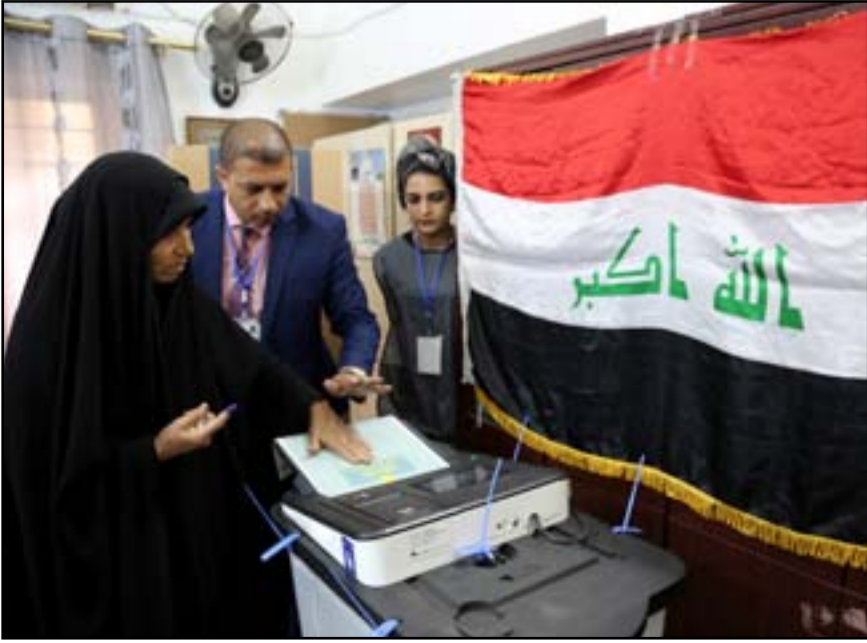
موظف يدخل ورقة الاقتراع الى الصندوق الانتخابي.....

الأجهزة الإلكترونية في سياق الانتخابات بعدما تعاقدت مع إحدى الشركات الكورية الجنوبية لشراء ٥٩ ألف جهاز مسرّع للنتائج بلغت كلفتها ما يقارب ٩٧ مليون دولار.