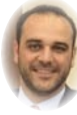
□ د. أشير ناظم الجاسور

الواحد تلو الآخر سواء بالتدخل العسكري المباشر أو بالإنابة أو من خلال القنوات الدبلوماسية، فالعراق انتهت وبقته بعد الاطاحة بنظامه السياسي، علماً أن الولايات المتحدة لم تسقط النظام بقدر ما سقطت الدولة ومحو معالمها بالكامل لتخلق دولة ذات مقاييس غير طبيعية تتأثر بالاحتداد لا بل تدوب فيها، أما ليبيا فهي كما نشاهد ونسمع لا أمل في استقرارها وتقسمت بين مجلس عسكري لا يذكر وجماعات مسلحة متطرفة وعشائر تحكم وفق أعرافها، سوريا انتهت الحرب حتى وإن لم يسقط النظام، لكنها فقدت قدرتها على السيطرة والاستمرار لوحدها، فهي لم تعد قادرة على حماية أمنها بمفردها وستستمر بطلب المساعدة على الدوام، وسوريا اليوم بموقف لا تحسد عليه، فهي ستواجه صعوبات جمة في الأيام المقبلة، أما كوريا الشمالية في طريقها لأن تخضع للضغوط الدولية، فهي لا تمتلك النفس الطويل للمناورة والمسالمة خصوصاً ووضعها الاقتصادي لا يسع لها بالمنافسة، أما إيران فعند قراءة الأحداث بشكل عام، نجد أنها سوف تمر بمرحلة حرجة من عمر الدولة خصوصاً وهي اليوم تواجه ضغوطات كبيرة سياسية واقتصادية، في الحقيقة إن ما تواجه إيران هو ذاته ما واجهه العراق، وذات الاتهامات سواء في ما يخص البرنامج النووي ودعم الجماعات المسلحة بالتدريب والمال والسلاح ومصدر قلق لدول المنطقة ومساهمة في زعزعة الاستقرار، وخشية الولايات المتحدة من أن تقع هذه الأسلحة بيد الجماعات المسلحة التي تسهم في تهديد العالم وإرهاب الأمنين.