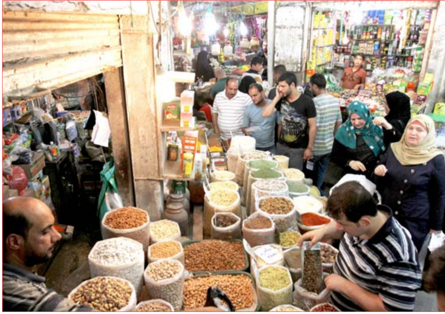
إقبال كبير على الأسواق مع قرب شهر رمضان ..... عدسة: محمود رؤوف