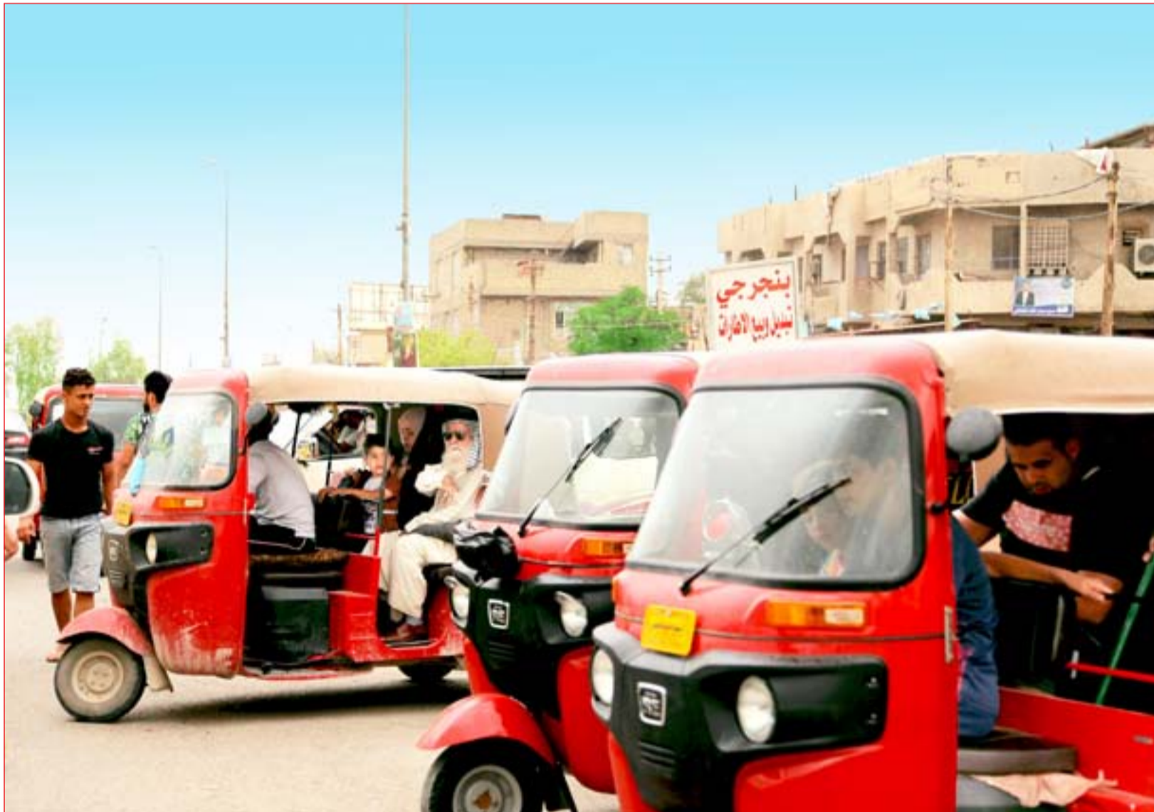
التك تك يغزو مناطق شرق القناة في مشهد يحيلك إلى العاصمة الهندية نيودلهي ..... عدسة: محمود رؤوف