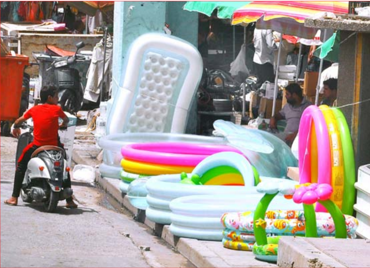
محال لبيع مسابح الأطفال في بغداد ..... عسة: محمود رؤوف