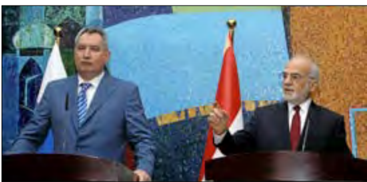
الجعفري مع نائب رئيس الوزراء الروسي.. أرشيف

وفي سياق آخر، أعلن رئيس لجنة الأمن والدفاع البرلمانية حاكم الزامل، وهو من التيار الصدري كان قد أثنى على دور روسيا في دعمها للحكومة العراقية في حربها ضد داعش وذلك خلال لقائه بالسفير الروسي في بغداد ماكسيم ماكينوف، عام ٢٠١٧. وتحديث الزامل أيضاً عن الحاجة لتطوير علاقات ودية بين البلدين وبناء جسور تعاون في قطاعي الاقتصاد والخدمات. من جانب آخر هناك شركات نفط روسية علاقة مثل كازبروم نفط، ولوك أويل، ما تزال تعمل في كيريات حقول النفط