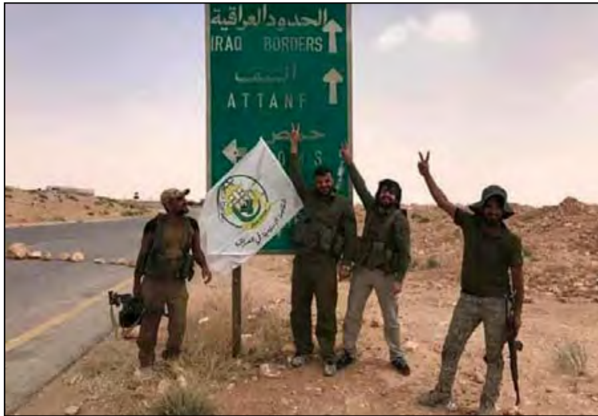
قوة من الحشد قرب الحدود السورية.. أرشيف