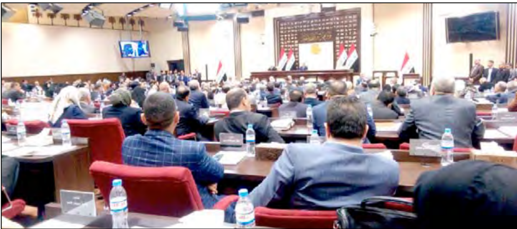
جلسة سابقة لمجلس النواب