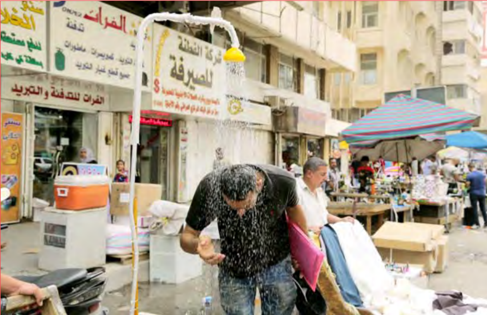
موجة حر تجتاح العاصمة وتعيد "الدوش" الى الشوارع.....