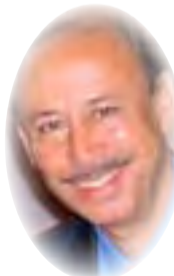
د. قاسم حسين صالح

هتالك موقفان متضادان من الصوم، الأول يتبناه عدد من الكُتّاب والأطباء النفسانيين العرب يرى أن الصوم يؤدي الى اضطراب عمل الدماغ بانخفاض مستوى الجلوكوز في المخ، واختلال في الهرمونات وعمل الساعة البيولوجية للإنسان. فالمعتاد أن جسم الإنسان ينشط في النهار ويستهلك طاقة، وإن النوم في الليل يعمل على ترميم ما اهترأ في الجسم، وإن الصوم، وفقاً لهذا الرأي، مضر بجسم الإنسان، لأنه يضطره الى أن يسهر في الليل وينام كثيراً في النهار، ويسبب السمّة، وله انعكاسات نفسية سلبية يكفّك منها التوتر العصبي وتعكر المزاج والترهفة والصداق والدوخة الناجمة عن انخفاض نسبة السكر في الدم.