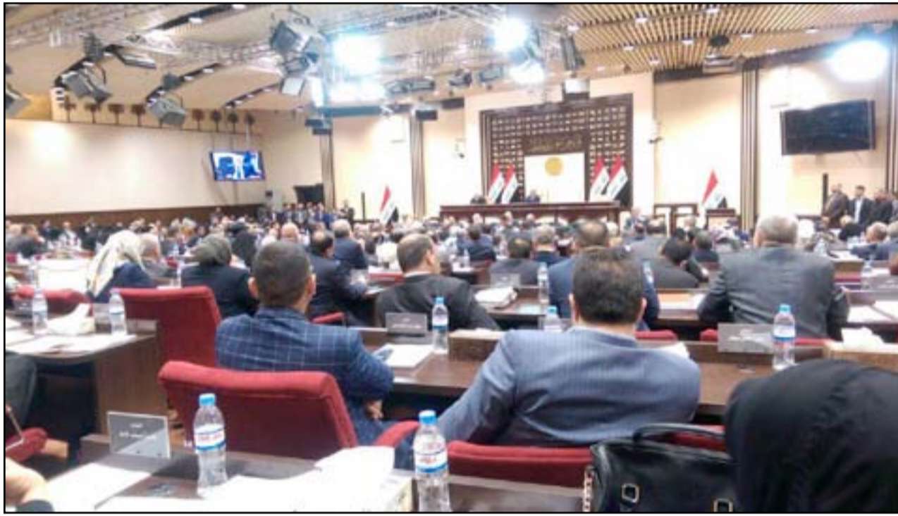
جلسة مجلس النواب.. أرشيف