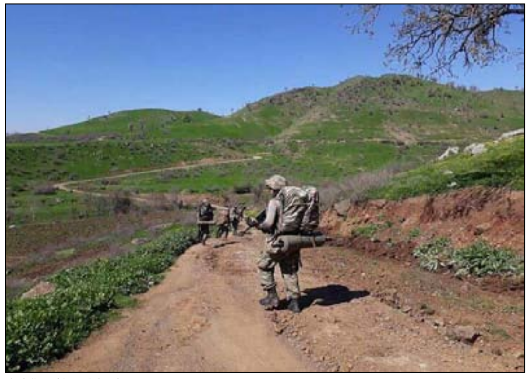
قوات تركية في مناطق شمال أربيل

وقال بكر في بيان تابعته (المدى) إن القوات التركية وضمن مسلسل الخروق لحسن الجوار والعُدوان الصادر على العراق والمنطقة فقد مضت تلك القوات بجريمة جديدة للدخول إلى ناحية سيدكان بمحافظة أربيل في