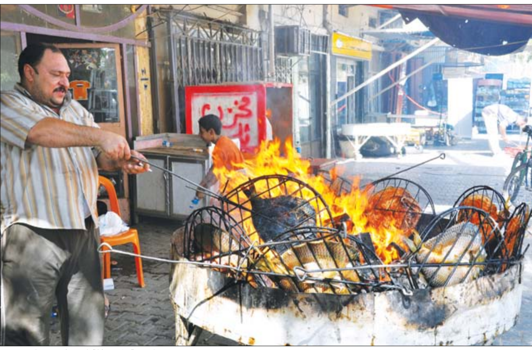
رجل يشوي السمك في منطقة البتاوين ببغداد ..... عدسة: محمود رؤوف

بغداد / المدى التقى رئيس مجلس الوزراء حيدر العبادي، مساء يوم أمس السبت، زعيم التيار الصدري مقتدى الصدر بمقر إقامته في النجف، لبحث آخر التطورات السياسية. وأكد العبادي قبل لقائه الصدر قائلاً إن العراق لا يمكن أن يعود للوراء، مبيّناً أن التحدي الذي نواجهه اليوم ليس أكبر من تحدي عصابات داعش الإرهابية. وقال العبادي، أثناء حضوره الحفل التابيني لأربعينية قائد فرقة الإمام علي القتالية الشيخ كريم الخاقاني في محافظة النجف، إن الأبطال الذين هبوا تلبية للفتوى السيستانيّة العلوية وقاتلوا جنباً