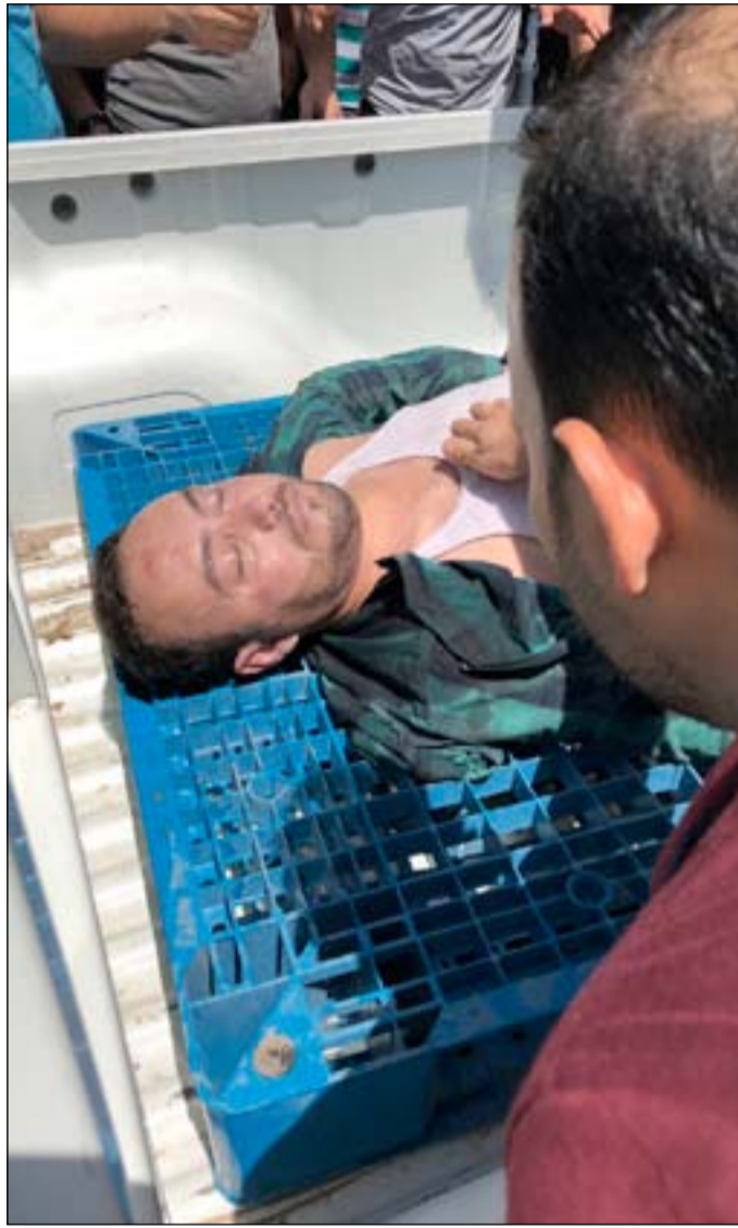
مخازن المفوضية قبل سقوط الأجهزة وموظف توفي بسبب الحادث

توقعات متضاربة بشأن الصناديق والمراكز المشمولة بالعملية