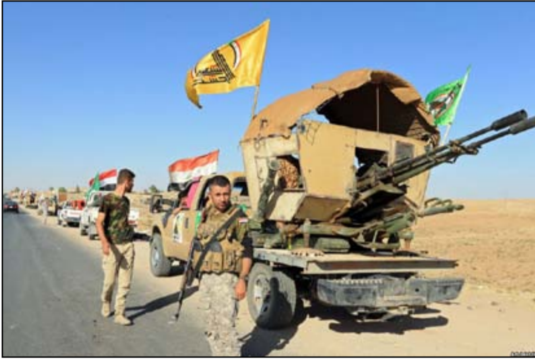
قوة من الحشد على طريق العظيم.. ارشيف

وتشكيل قوة مشتركة على وجه السرعة مكونة من القوات الاتحادية والبيشمركة لوقف نزيف الدم ومنع الانزلاق إلى ما لا تحمد عقباه..