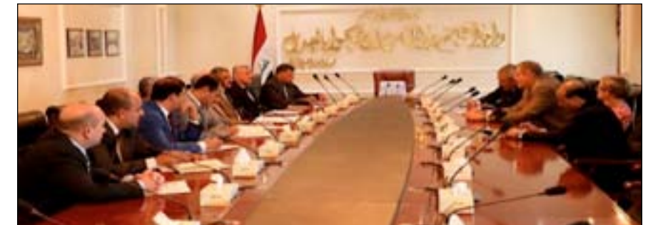
القضاة المنتدبون وكويتش في لقاء سابق

انتخابات مجلس النواب رقم ٤٥ لسنة ٢٠١٣ المعدل وعبر دائرة تلفزيونية مغلقة، كما تم اتخاذ القرار المناسب بشأن تطبيق أحكام المادة ٥ من القانون أف رئيس وأعضاء مجلس المفوضين ومدراء المكاتب الانتخابية السابقين في المحافظات. ٣- الإيعاز لجميع مدراء المكاتب الانتخابية في المحافظات (من الكشوف على مواقع خزن صناديق الاقتراع وأجهزة التحقق الإلكتروني (باركود) وغيرها من المواد المساعدة للعملية الانتخابية وبيان أوضاعها بشكل دقيق وإرسال محاضر الكشوفات لمقر المفوضية في المكتب الوطني، وتهيئة الأماكن المخصصة لإجراء