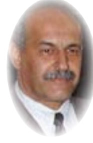
القاضي سالم روضان الموسوي*

هذا السؤال ظهر إلى العلن بعد أن سعى مجلس النواب العراقي إلى عقد جلسة استثنائية لمناقشة إصدار قانون يتم بموجبه تمديد عمر وولاية مجلس النواب إلى أجل غير محدد، وفعلاً انعقد المجلس بتاريخ 2018/6/22 ويصادف يوم الجمعة التي هي عطلة رسمية، وتمت القراءة الأولى (المقترح قانون التعديل الرابع لقانون انتخابات مجلس النواب رقم 45 لسنة 2013) ويتكون من مادة واحدة تقضي بتمديد عمر مجلس النواب لغاية مصادقة المحكمة الاتحادية العليا على نتائج الانتخابات وجاء في أسبابه الموجبة (من أجل تنفيذ ما جاء في قرار المحكمة الاتحادية العليا رقم 104/99/106/اتحادية/2018 في 21/6/2018 لأنه لزم مجلس النواب باتخاذ إجراءات تستوجب استمرار عمله) وهذا الأمر أثار الاهتمام الواسع سواء رسمياً أو شعبياً لسبب رئيس هو أن هذا الإصرار على عقد الجلسات الاستثنائية واتخاذ القرارات السريعة في أمور عادة ما تتعلق بمصالح النواب بينما تراه يتقاعس عن عقد جلسة للتصدي في أمور خطيرة ومهمة مَرّت على الشعب العراقي. وأرى إن الاستغراب لدى الشعب له مبرراته، لأن الأزمة الخطيرة التي ما زال يعاني منها العراق (أزمة المياه)، مثلاً، التي أدت إلى نزوح العوائل ومنع الزراعة في بعض القطاعات لم تكن حاضرة في اهتمام أعضاء المجلس عندما لم يحضروا إلى الجلسة الاستثنائية التي دعا إليها رئيس المجلس، بينما تراحموا في الحضور في اليوم التالي إلى الجلسة التي تتعلق بمزاياهم في الانتخابات الأخيرة. ولغرض الوقوف على الوجه