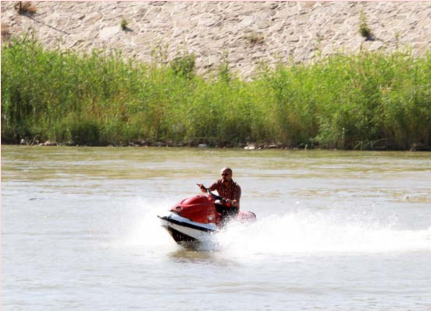
رجل يتزلج على مياه دجلة بعد تعليق ملء السد التركي ..... عدسة: محمود رؤوف

أكد أنّ القوّة التي قُصفت تمثّل نقطة ارتكاز للدفاع عن القائم