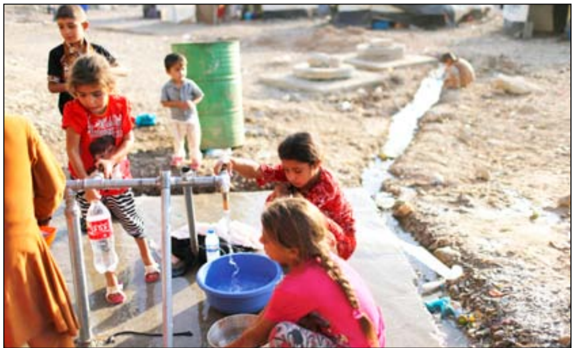
اطفال في مخيم للنازحين شمالي نينوى.. ارشيف

قالت المنظمة الدولية للهجرة في آخر تقرير لها حول رصد حركة النزوح داخل العراق أن عدد النازحين بين كانون الثاني عام ٢٠١٤ إلى ١٥ حزيران عام ٢٠١٨ انخفض إلى ٢ مليون شخص في حين ازداد عدد العائدين لمناطقهم إلى أكثر من ٣,٨ مليون شخص.