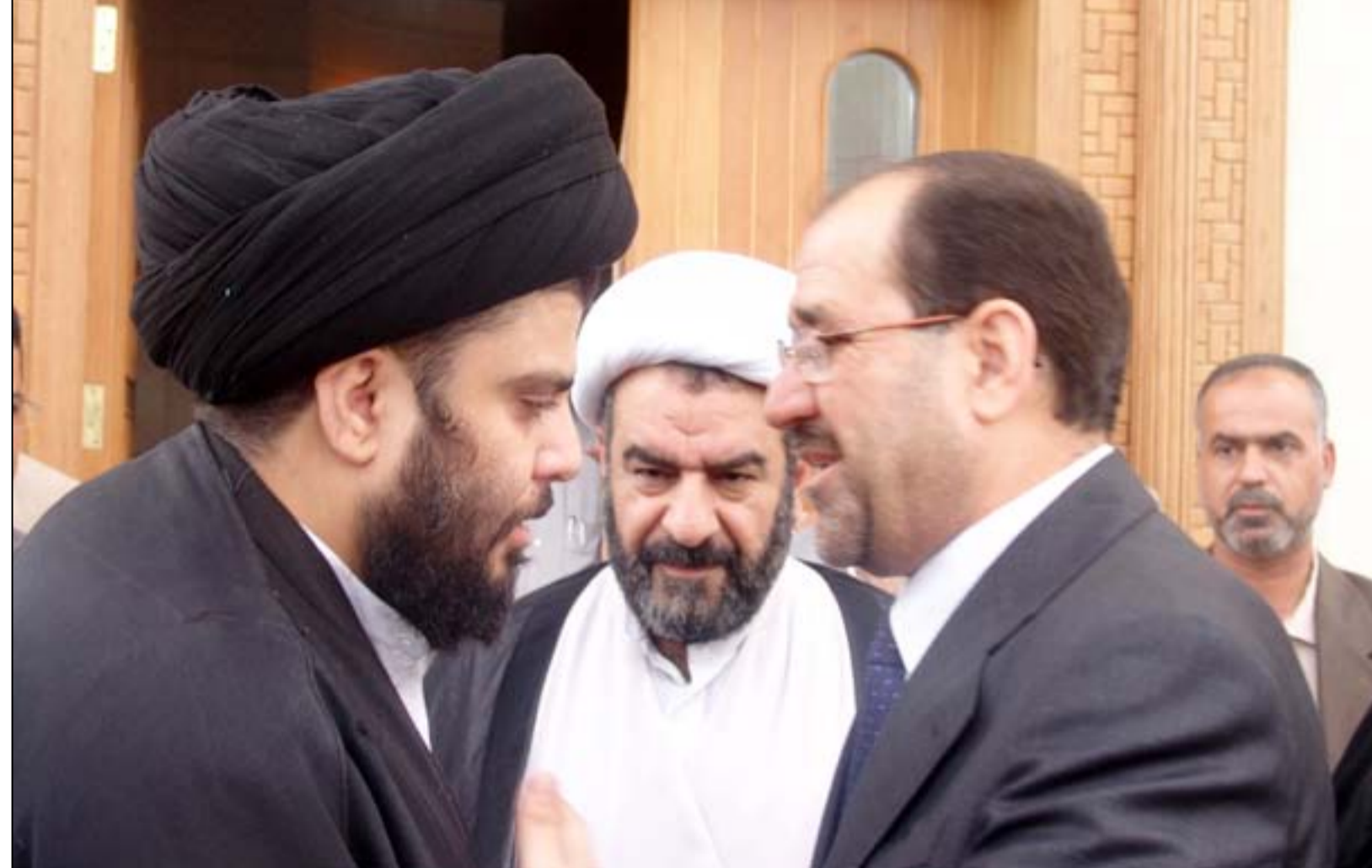
لقاء سابق بين الصدر والمالكي

ويضيف حسين في تصريح لـ(المدى) أن "الزيارة المقبلة للوفد الكردي غير محدد وقتها لغاية اللحظة لكن هدفها هو الدخول في مفاوضات لتشكيل الكتلة الأكبر عدداً"، مؤكداً أن "التحالفات الاتحادية على نتائج الانتخابات".