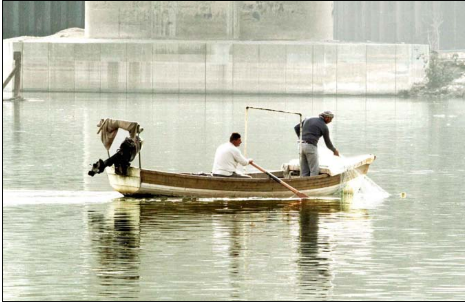
الصيداؤون يعودون إلى دجلة بعد ارتفاع نسبي لمناسيب المياه.....

أبطال بناء الأجسام أمام مرحلة احترافية للمنافسة عالمياً 5