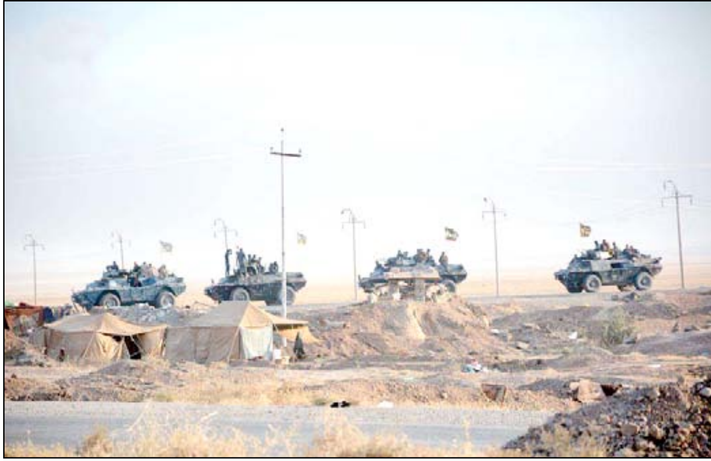
قوة عسكرية شمالي ديالى

بغداد / المدى وأشار رسول إلى أن العملية تهدف إلى تطهير المناطق الكائنة شرق طريق ديالى - كركوك". وهذه أول عملية عسكرية تنسق فيها القيادات العسكرية في بغداد مع البيشمركة منذ إعادة انتشار القوات الاتحادية في المناطق المنحازة عليها في الربع الأخير من عام ٢٠١٧. وتأتي هذه العملية رداً على إعدام تنظيم داعش لرهائن كانوا في قبضته، وعثرت القوات الأمنية على جثثهم الأسبوع الماضي على طريق بغداد - كركوك. ورغم إعلان بغداد انتهاء الحرب ضد التنظيم الإرهابي عقب استعادة آخر مدينة مأهولة كان يحتلها داعش أواخر