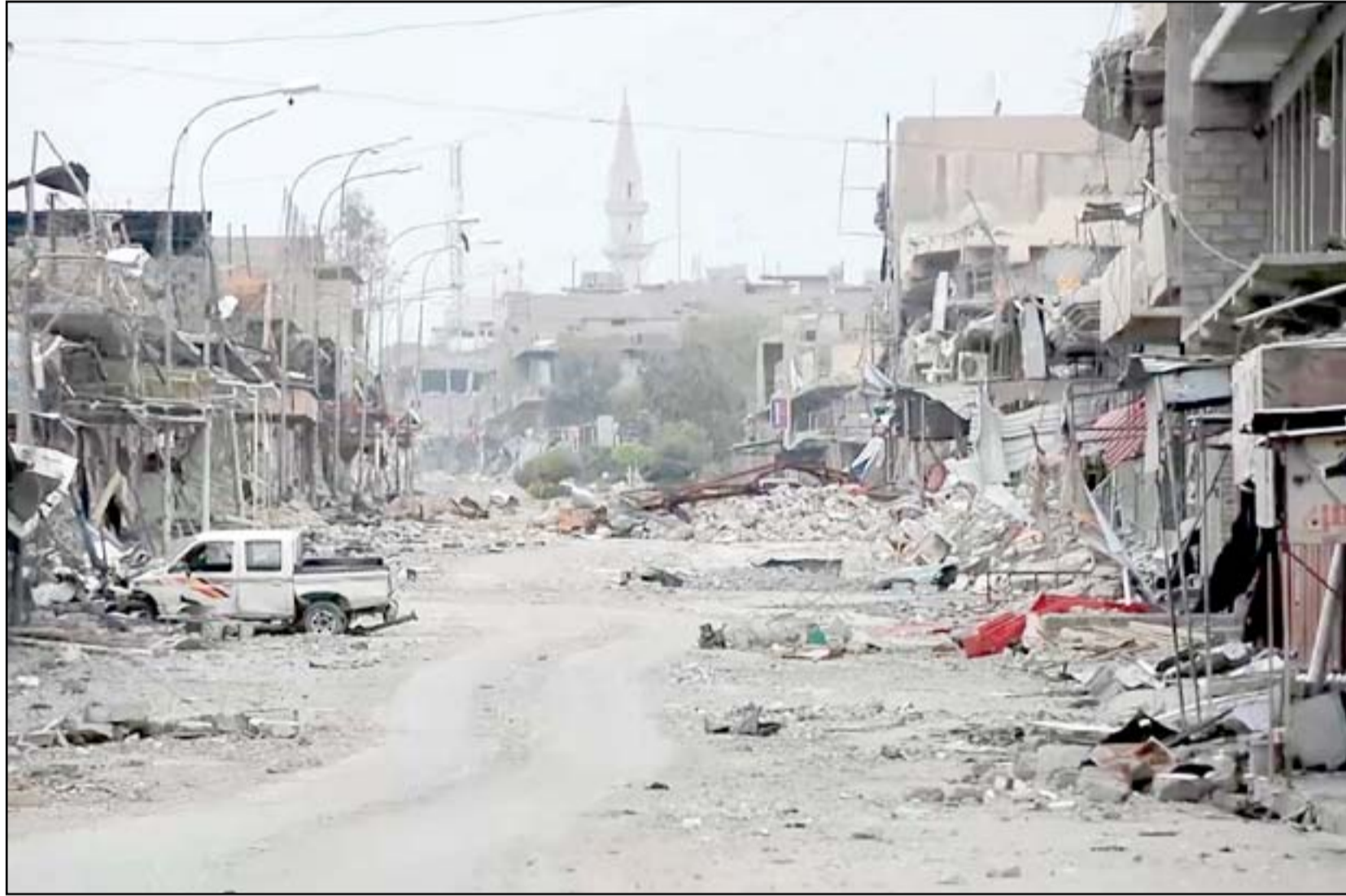
أحد شوارع الموصل بعد التحرير.. (أرشيف)

نحو ١٥ ألف عنصر أمني تم فصلهم من شرطة نيونى ولم يعادوا حتى الآن. وكانت أعداد الشرطة قبل عام ٢٠١٤ حدود ٣٠ ألف عنصر، فيما لا تعوض الصحراء بعد تحرير الموصل، يهددون اليوم بالعودة، ويكشف أيضا عن أن الضغط على التنظيم في جنوب سوريا، دفع بعض المسلحين الى الدخول في مناطق غرب نيونى، وقد شاهد بعض السكان عجلاتهم هناك.