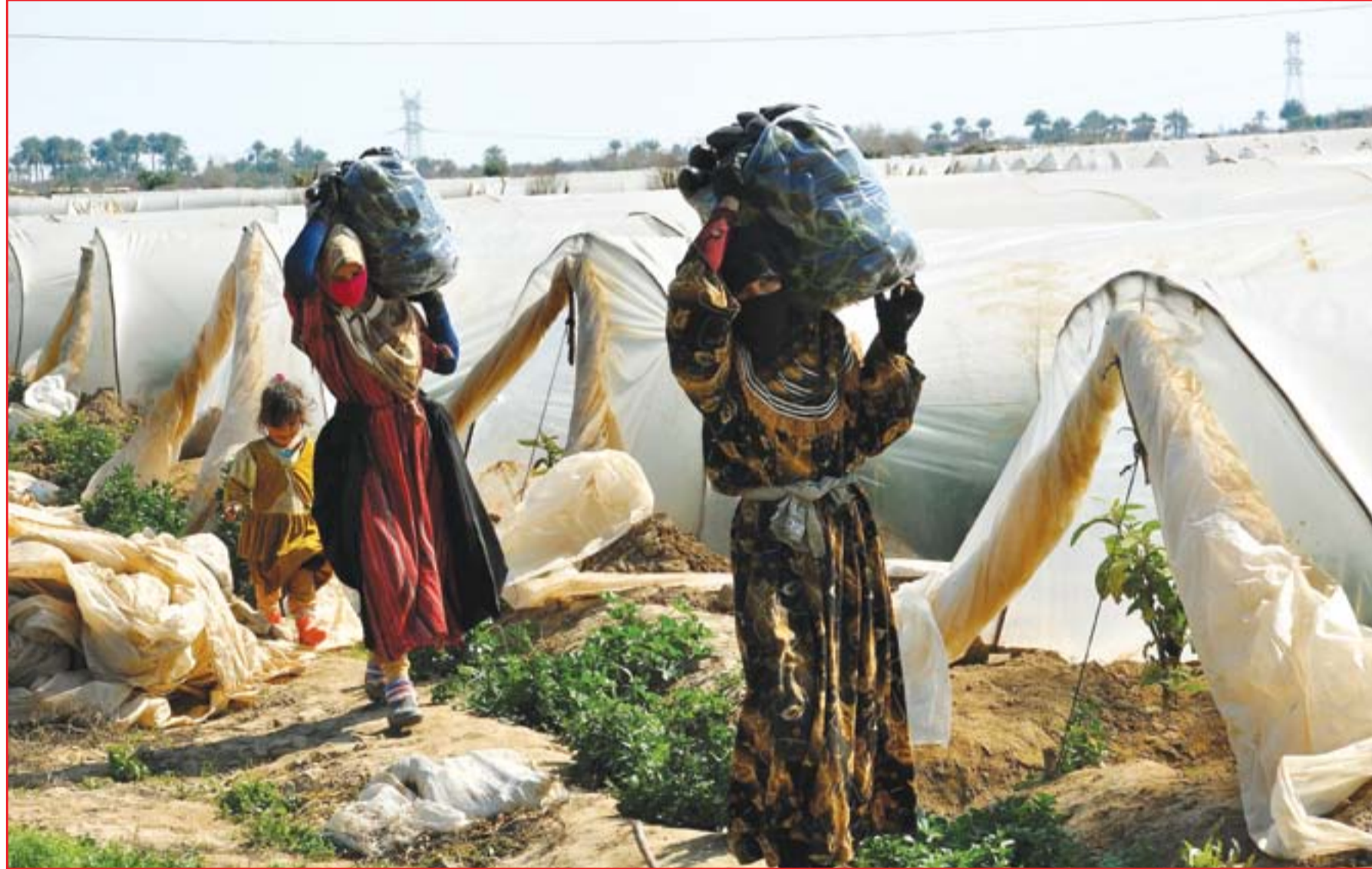
فلاحات في إحدى مزارع سلمان باك.....

بعد قطيعة دامت قرابة أربع سنوات تبادل فيها خصما الأمتس الاتهامات بالسرقة والفساد تارة وبزيادة نسبة الفقر والبطالة في البلاد تارة أخرى، توصل جناحا رئيس الوزراء حيدر العبادي ونائب رئيس الجمهورية نوري المالكي ليلة السبت الماضي إلى اتفاق يقضي بحسم مرشح منصب رئاسة الحكومة المقبلة بألية التسوية (الاتفاق) أو التصويت. هذا الاتفاق الذي حضرت له قيادات حزب الدعوة وشارك فيه قائد منظمة بدر هادي العامري ألزم بتشكيل تحالف ثلاثي يجمع دولة القانون