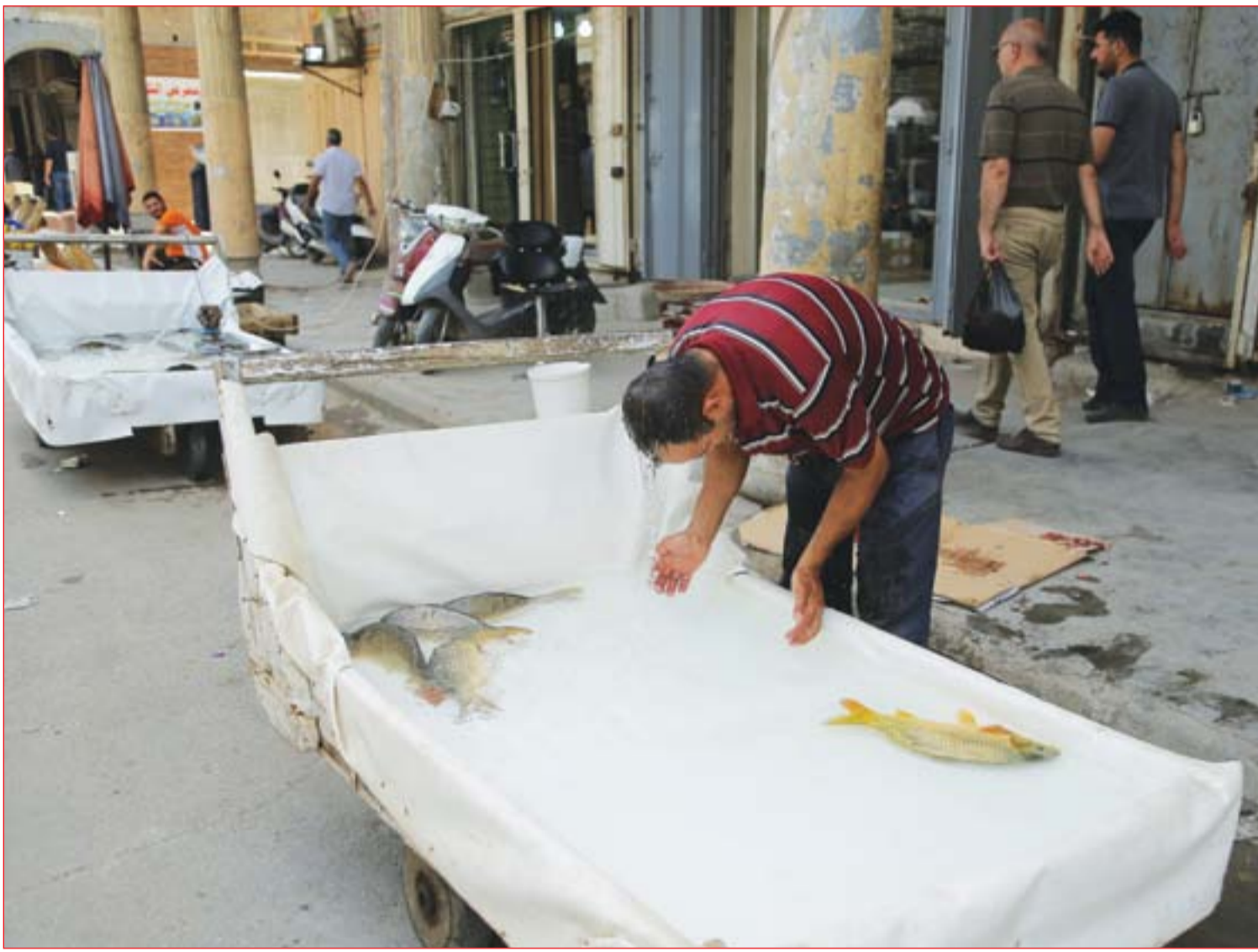
الحر يدفع بانعاً جوالاً لتبريد رأسه بماء السمك..... عدسة: محمود رؤوف

3 معصوم يُصادق على وجبة جديدة من أحكام الإعدام