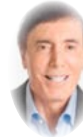
ألون بن مثير

إن إعادة انتخاب الرئيس التركي رجب طيب أردوغان التي اعتبرت زوراً انتخابات حرة ونزيهة وممثلة لإرادة غالبية الشعب التركي لها تداعيات وخيمة على الصعيدين المحلي والأجنبي. ويدعي مؤيدو أردوغان بأن الانتخابات تعزز فقط الطبيعة الديمقراطية للبلاد وأن على منتقدي أردوغان الآن قبول القرار الشعبي. لكن الحقيقة هي أن أردوغان لم يتوقف عن فعل أي شيء لخلق جو اجتماعي وسياسي داخلي تقمع معارضته، الأمر الذي مكّنه من الفوز بأغلبية صريحة من الناخبين.