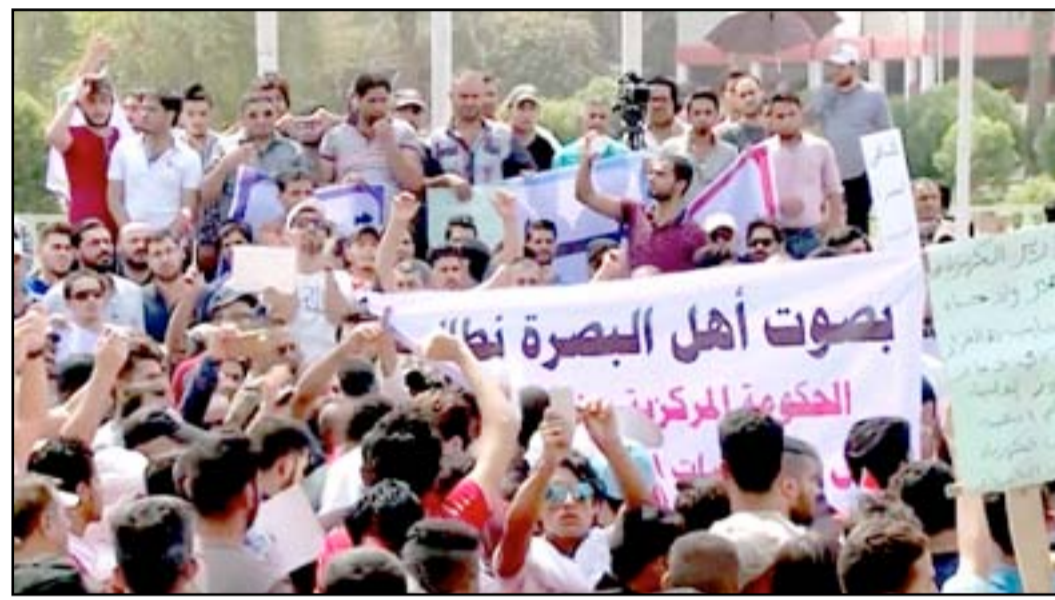
□ البصرة - ميسان - واسط / متابعة المدى

وفي ذي قار قطع المئات الطريق الرئيس وسط مدينة الناصرية، مركز المحافظة، احتجاجاً على تردي الخدمات. وتجمع المئات من الأهالي وسط مدينة الناصرية (مركز محافظة ذي قار) تنديداً باستمرار أزمة الكهرباء. واحتشد المئات من أهالي مدينة الكوت في ساحة تموز احتجاجاً على ضعف التغذية بالطاقة الكهربائية، ورفعوا شعارات تطالب الحكومة بتوفير الخدمات. وامتدت الاحتجاجات إلى محافظة ميسان، حيث تجمع المئات في تظاهرات ليلية، مطالبين بتحسين الخدمات الأساسية. من جهته قال الناطق باسم الاحتجاجات في البصرة الدكتور كاظم السهلاني، إن "التظاهرات في البصرة ليست فجائية