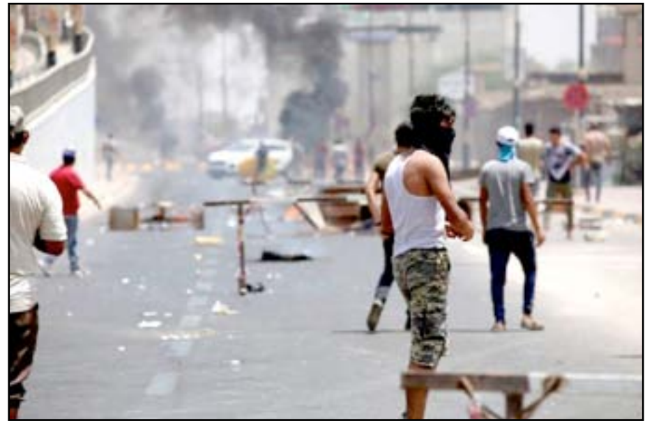
محتجون في البصرة يوم الاثنين

اقتحم المحتجون مقر حكومية في محافظاتهم. وقال المتحدث باسم قيادة العمليات المشتركة العبيدي يحيى رسول خلال مؤتمر صحافي، أمس: "ندعو أبناء الشعب إلى الإبلاغ عن المندسين والعبثيين بالامتلاكات العامة والخاصة، مبيناً أن ذلك هو واجب وطني كون المطار وحقول وأبار النفط والمؤسسات الحكومية هي ملك للشعب وليس لأحد". وأضاف رسول إن "هناك أماكن مخصصة للتظاهر يمكن التظاهر فيها والمطالبة بالحقوق"، مشدداً على ضرورة "التعاون مع القوات المسلحة والمحافظة على سلمية التظاهر وتفويت الفرصة على كل من لا يؤمن بعراق موحد منتصر". كما قال المتحدث باسم وزارة الصحة سيف البدر في مؤتمر