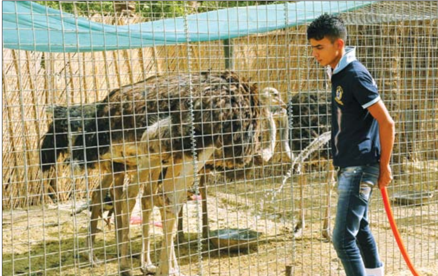
عامل يبرد الحيوانات في أحد مشاتل بغداد

5 اتحاد الكرة يسلم درع الدوري للزوراء في كرنفال احتفالي بالشعب