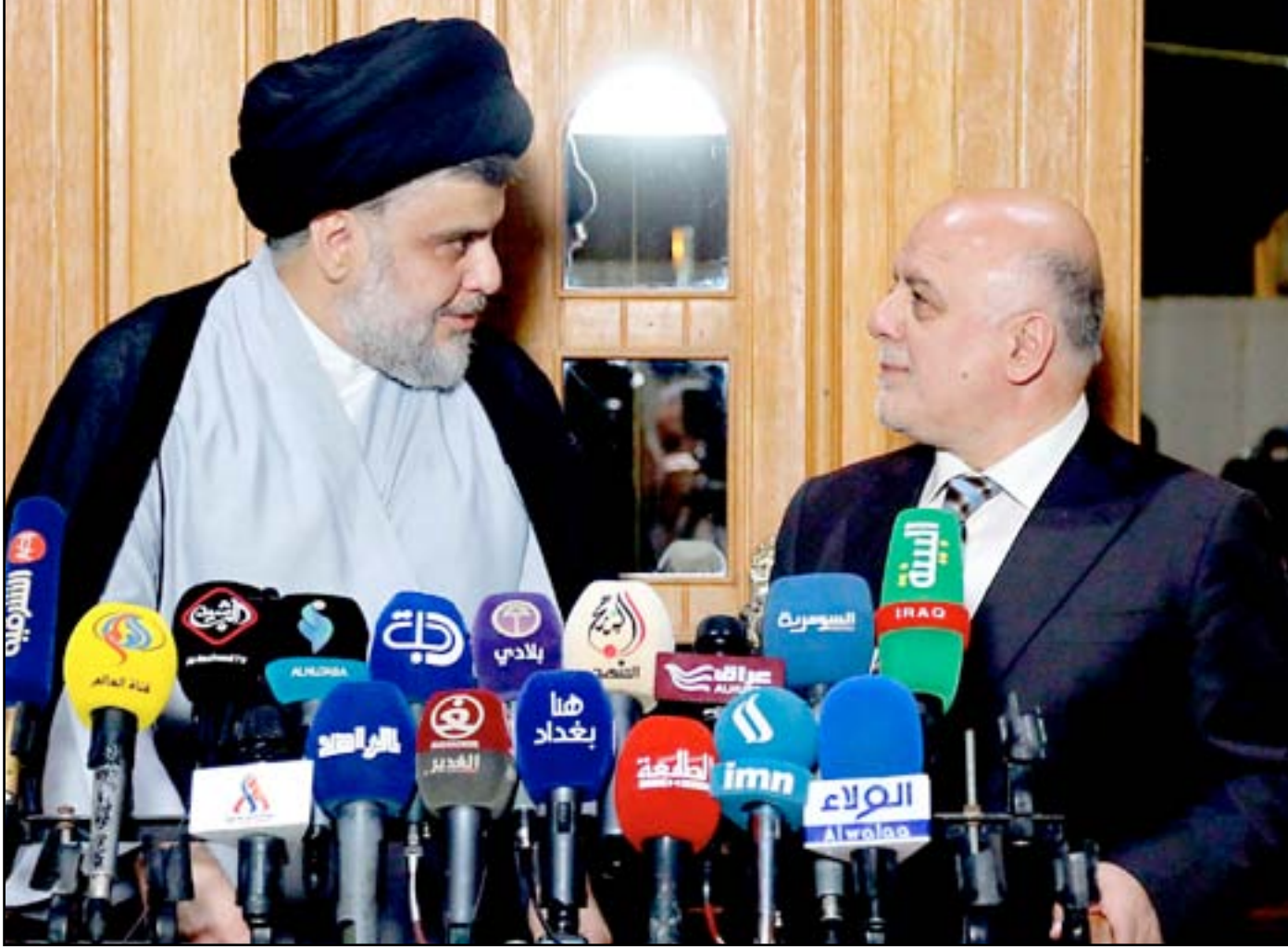
الصدر والعبادي خلال مؤتمر صحفي.. (أرشيف)

بغداد/ جبار زيدان ويبقى رئيس الوزراء حيدر العبادي طوال المدة الماضية المرشح الأوفر حظاً لتوليته ولاية ثانية رغم تقدم قائمته "سائرون" لزعيم التيار الصدري مقتدى الصدر، وقائمة "الفتح" التي يتزعمها هادي العامري، إلا أن الأمور بدأت تفتت من يده بعد موجة الاحتجاجات التي يشهدها البلد منذ ٩ أيام، بالإضافة إلى اختلافه مع الصدر - الذي طلب منه الانشقاق عن حزبه (الدعوة) مقابل دعمه لولاية ثانية، بحسب مسؤولين. وخلال الأيام الماضية أعلن عن