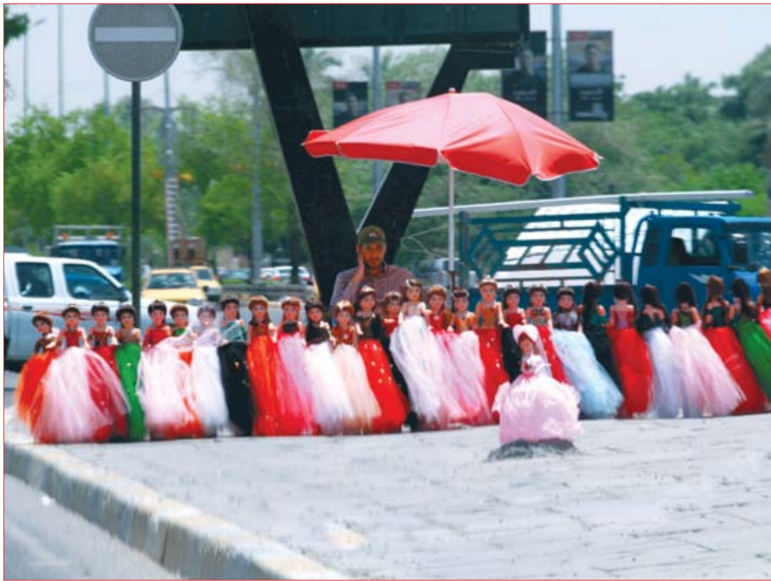
باتع دمي يعرض بضاعته على أحد أرصفة العاصمة ..... عدسة: محمود رؤوف

2 واشنطن بوست: داعش يعاود الظهور في العراق بعد أشهر على إعلان النصر