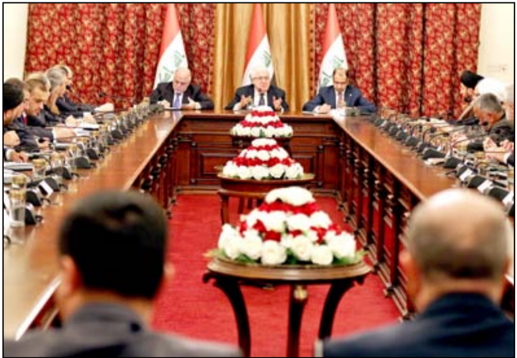
اجتماع سابق لمعصوم مع زعماء الكتل السياسية..