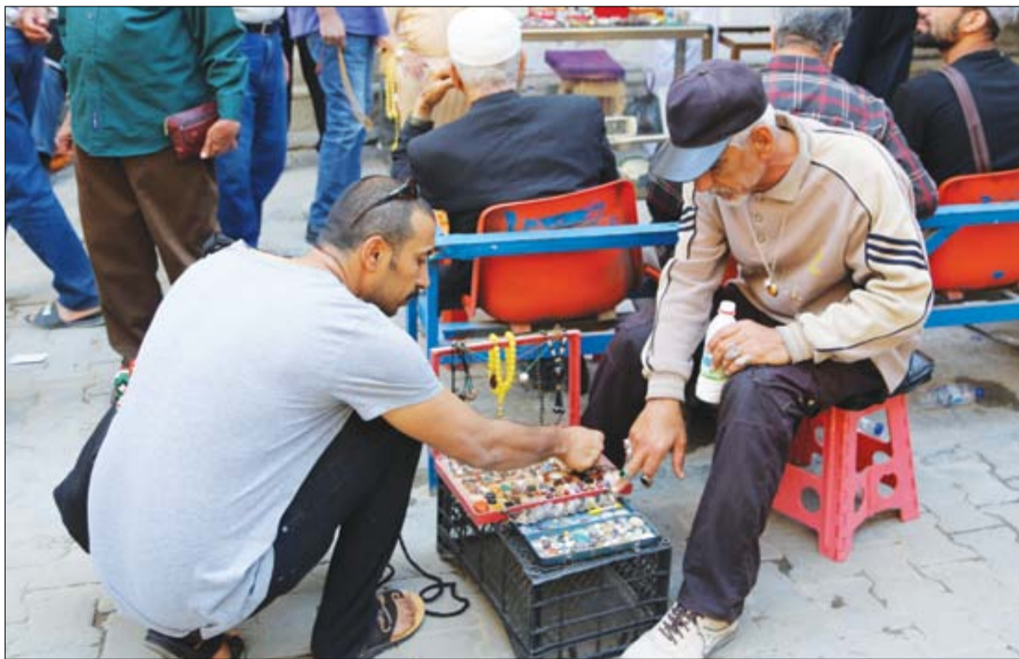
بانع محابس وأحجار كريمة في منطقة الباب الشرقي ..... عدسة: محمود رؤوف