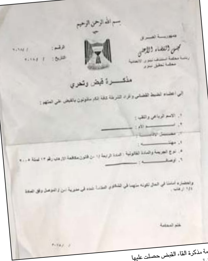
فورمة مذكرة الغاء القبض حصلت عليها المنظمة