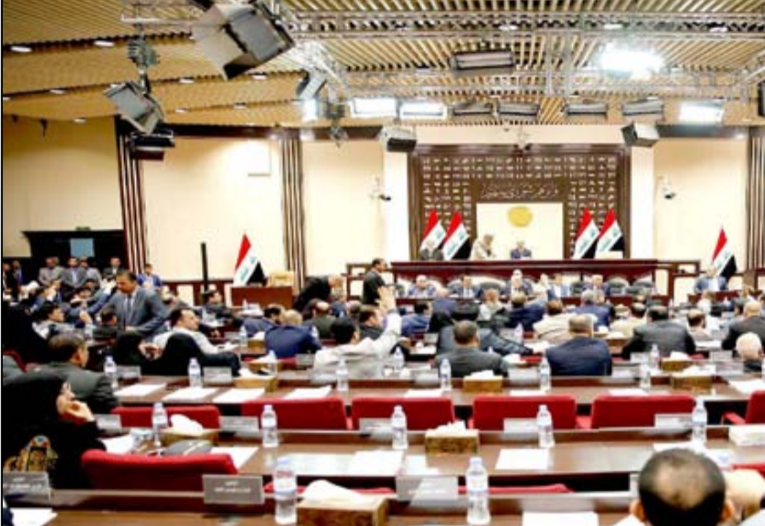
جلسة سابقة لمجلس النواب... (أرشيف)

قدرتها على توفير المخصصات المالية اللازمة. ويضيف الحديثي إن "هذا القانون يناقض مع المبدأ الأساس للدستور الذي تركز مبادئه على المساواة بين كل العراقيين أمام الحقوق والواجبات، فضلاً عن أن هذا التشريع يتعارض مع بنود ونصوص قانون التقاعد الموحد الساري المفعول الذي يحدد شروط وإحالة الموظف إلى التقاعد". وبعد حملة سميت "الإصلاحات" أطلقها رئيس الحكومة عام ٢٠١٥ بات الراتب الاسمي لرئيس مجلس النواب ٨ ملايين دينار شهرياً ونائبية ٦ ملايين دينار في حين