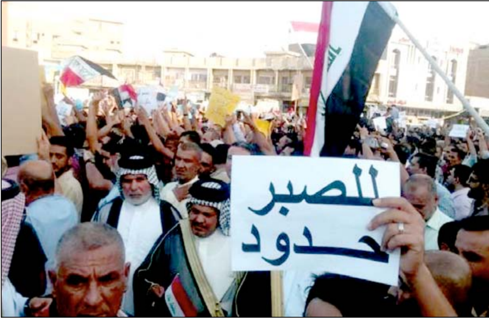
تظاهرة في البصرة قبل أيام

ويتواجد في الوقت الحالي وفد من محافظة البصرة برئاسة المحافظ في العاصمة بغداد لبحث مشاكل المشاريع المتوقفة مع وزارة المالية وبعض الجهات التنفيذية لتفادي أزمة الاحتجاجات.