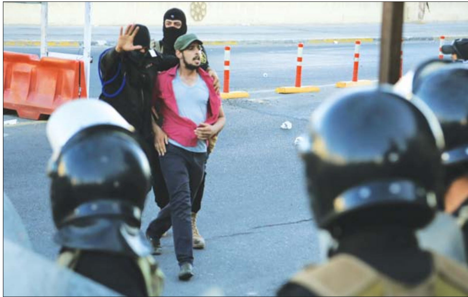
قوة أمنية تعتقل متظاهراً في ساحة التحرير

تؤكد معلومات أن عدد المعتقلين والجرحى أثناء التظاهرات الأخيرة بلغ أكثر من ١٢٠٠ شخص، وتشير إلى أن بعض المعتقلين قد جرى إرغامهم قبل السماح لهم، بالمغادرة على توقيع "اعترافات مفبركة وتعهّدات بعدم المشاركة في الاحتجاجات. كما أكد ناشطون وسياسيون قريبون من الأحداث أن "الأمن" أخفى مصير ما يقارب ٣٠ متظاهراً اعتقلوا خلال الأسابيع الثلاثة الماضية التي شهدت التظاهرات. وبحسب الناشطين فإن الحكومة استخدمت أساليب بوليسية في قمع الاحتجاجات، وكذلك أساليب تعذيب محرمة دولياً. ووفقاً لإحصائيات تابعتها (المدى) فإن عدد القتلى في التظاهرات التي انطلقت مطلع الشهر الجاري في البصرة وانتقلت الي محافظات الوسط والجنوب، بلغ ١٤ شخصاً بينهم منتسب واحد، وهذا ما أكدته مفضية حقوق الإنسان. وأشرت الإحصائيات جرح واعتقال ١٢٢٤ شخصاً، نصفهم جرحي، فيما الآخرون معتقلون بحسب المواد (٤٧٧ و ٢٤٠ و ٢٣٠ و ٢٢٩) من قانون العقوبات العراقي، وقد أطلق سراح ٥٧٠ منهم بكفالة فيما لا يعرف مصير ٣٠ متظاهراً حتى الآن. وأعقب هذه الاعتقالات استخدام العنف المفرط المتبادل بين القوات الأمنية والمتظاهرين من خلال استخدام الرصاص الحي والغازات المسيلة للدموع وخرطوم المياه الساخنة والحجارة في محافظات ذي قار والنجف وبغداد والديوانية، فيما لم تحدث حالات عنف مفرط في محافظات البصرة وميسان وبابل وواسط. وبحسب محامين تحدثوا لوسائل إعلام