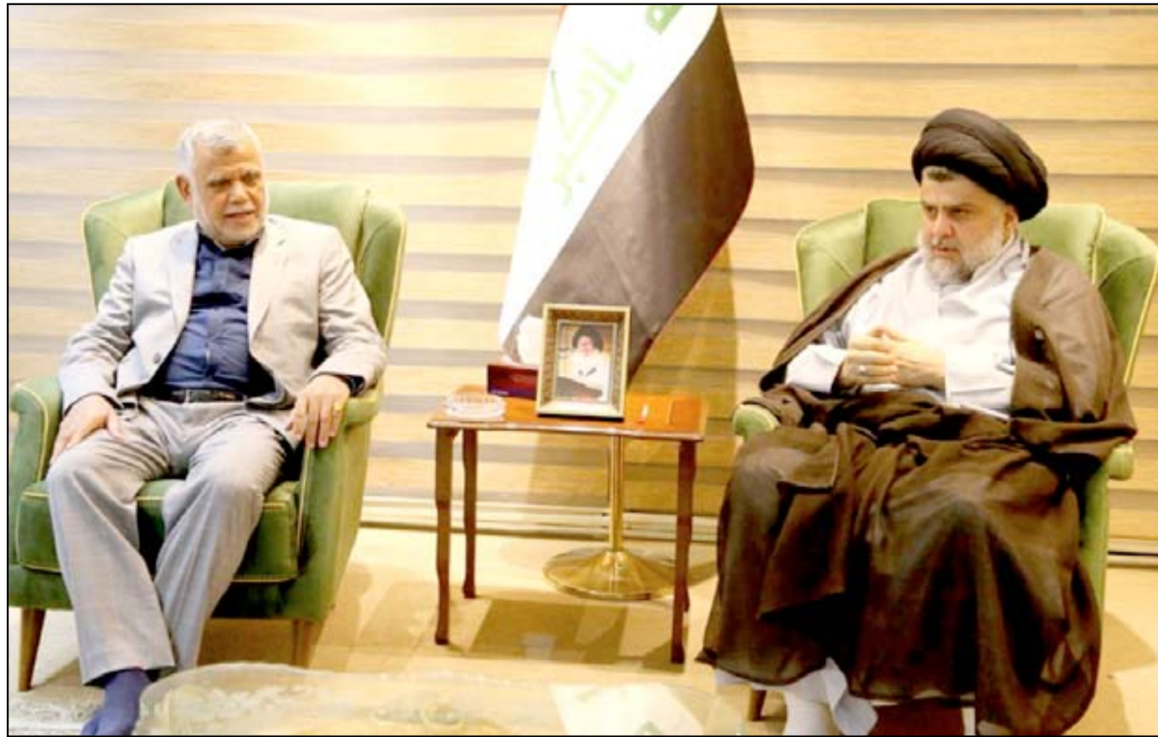
الصدر والعامري خلال لقاء سابق