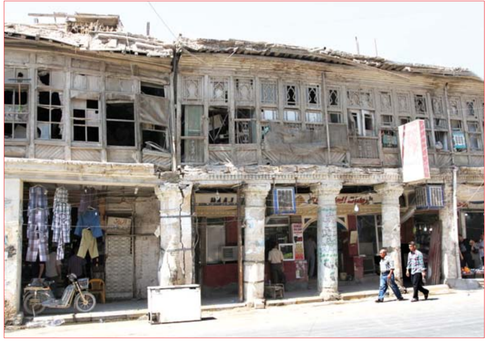
مبانٍ في شارع الرشيد تتحول إلى اطلال بسبب الامتال ..... عدسة: محمود رؤوف

آفة التزوير تترعرع في الأندية والموهوبون أولى بمليار الحكومة