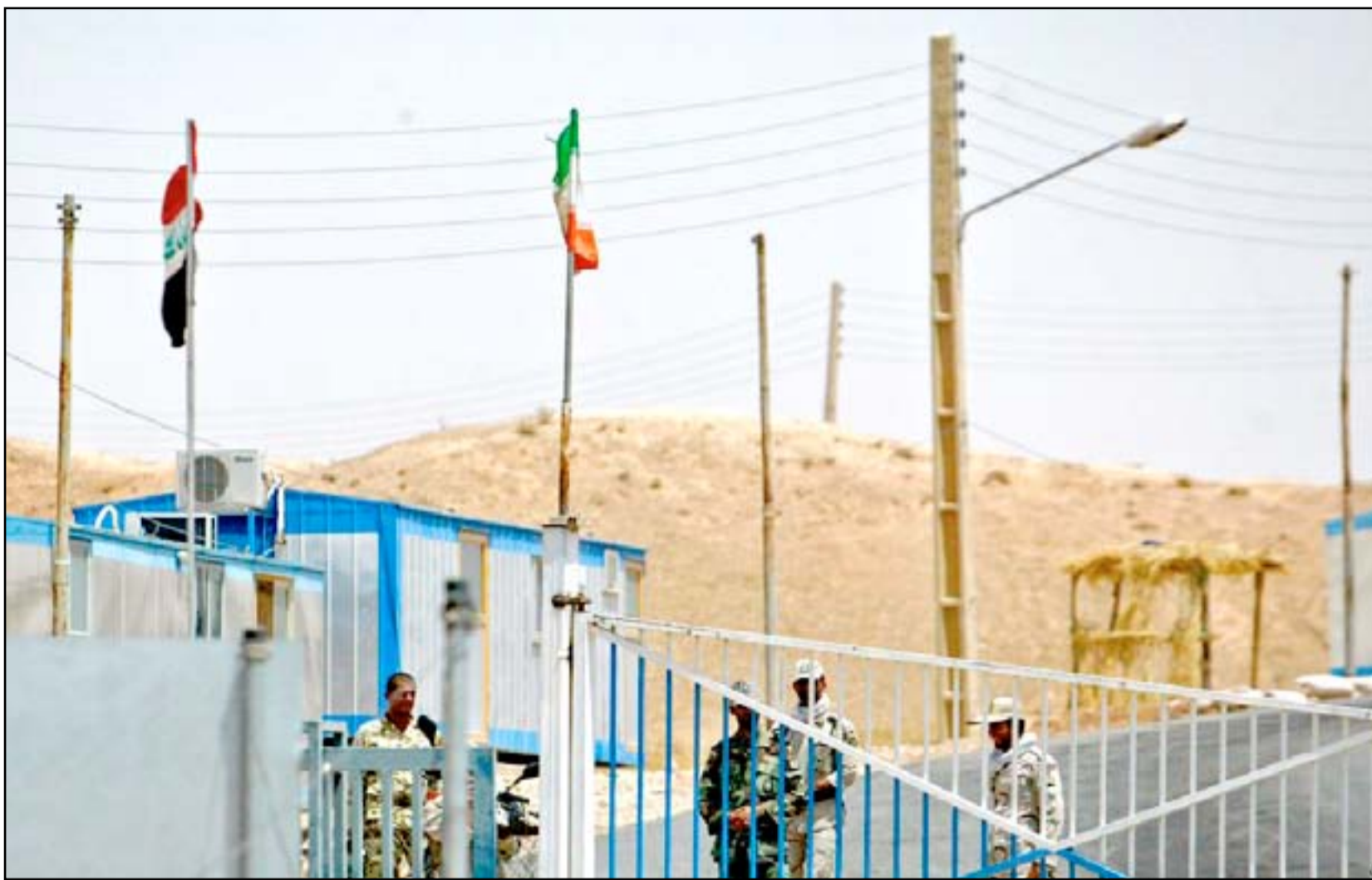
الحدود العراقية الإيرانية..

ويرى البولاني أن "انخفاض حجم التبادل التجاري بين العراق وإيران يعتمد على تعامل مؤسسات الدولة العراقية والتزامها مع العقوبات الاقتصادية المفروضة من قبل واشنطن مما يتطلب على مجلس الوزراء وضع رؤية للتعامل مع الإجراءات الأمريكية".