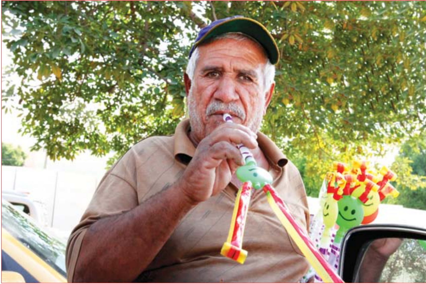
مسن يبيع لعب الأطفال في أحد تقاطعات العاصمة.....

يبقى موقف الحكومة العراقية من العقوبات الأميركية ضد إيران مشوّشاً، الأمر الذي دفع الخارجية الأميركية إلى القول إن "العقوبات ستطول الدولة التي تتعاون مع طهران". وبعد ساعات من هذا التصريح، أعلنت سفارة واشنطن في بغداد أن الأخيرة "لم تخرق الحظر". ويقول مسؤول شيعي بارز في بغداد إن العبدي رغم تعديل تصريحاته الأخيرة حول التعامل مع العقوبات الأميركية، لكنه مازال يتخذ قرارات واشتدّ وأضاف المسؤول وهو وزير سابق في تصريح له (المدى) أمس طالباً عدم نشر اسمه إن "العبادي كان أول رئيس دولة يعلق على الحظر الأميركي وكان كلامه مستعجلاً". وأضاف "حاول العبدي تغيير موقفه بعد ردود الفعل