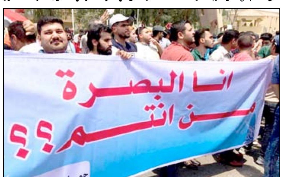
تظاهرة سابقة في البصرة

حقوق ومنتشآت النفط، للضغط على المسؤولين من أجل توظيفهم في شركات النفط، التي تعتمد في الغالب على أيد عاملة أجنبية. وتخللت الاحتجاجات التي دخلت شهرها الثاني، أعمال عنف، خلفت عدداً من القتلى في صفوف