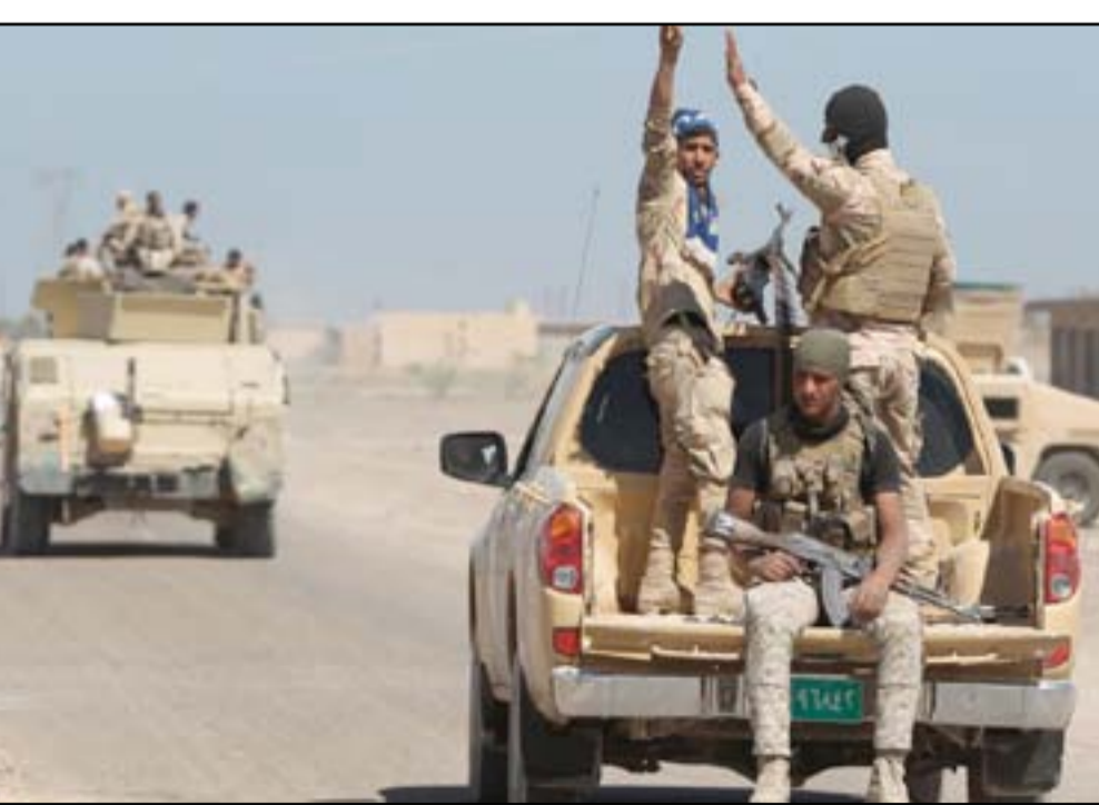
قوة أمنية شرق الأنبار.. اشراف

و جاءت قرارات العبادي الأخيرة وكأنها غلق الطريق في وجه تحالف وشيك بين ائتلاف "الفتح" وبعض القوى السنية، بعد تداول أخبار عن اشتراط "السنة" لانسحاب الحشد من مناطقها مقابل إتمام الاندماج بين الطرفين. ودعا رئيس الوزراء يوم الجمعة الماضي خلال زيارة قام بها إلى هيئة الحشد واجتماعه بمسؤولي الألوية والمديريات إلى عدم تسييس القوات الامنية، مشيراً إلى أن إخراجها من المدن يجب أن لا يخضع لضغط سياسي. وقال العبادي بحسب ما نقله مكتبه الإعلامي: "إننا في كل المؤتمرات الدولية وفي كل مكان نقول إن الحشد مؤسسة تتبع للدولة والقائد العام للقوات المسلحة ووفقنا بوجه كل من أراد تشويه صورته"، وأوضح أنه تفاجأ بصور قرار إخراج القوات من المدن، وقد أوقف جميع تلك القرارات. وفي الوقت ذاته تسربت وثيقة صادرة عن مكتب العبادي يوم 21 آب الجاري تتضمن قرارات في نفس السياق، وتقتضي بك ارتباط قوات في الحشد بالعتبات الدينية والأحزاب. الوثيقة السرية الصادرة عن مكتب رئيس الوزراء القائد العام للقوات المسلحة بتوقيع سكرتيره الخاص الفريق الركن