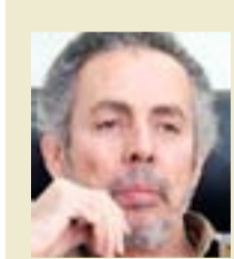
حين أراجع كتاباتي الستينية، إذا ما وقعت عليها صدفة، أستطيع ببسر أن أضع طرف سبابتي على الجمل والفقرات التي تتماهى مع الفراغ واللامعنى.

بعيداً عن مكانته الحقيقية، التي يشغلها في مسيرة الأدب الروسي وتاريخه، وربما يعود السبب في هذا إلى عدم معرفة القارئ العربي بعمق لكل ما حدث في روسيا بعد الحرب العالمية الأولى وثورة أكتوبر 1917، وخصوصاً ما حدث في الأدب الروسي بالذات، إذ أن القارئ العربي يعرف الجانب السياسي العام لتلك الأحداث ومن وجهة نظر معينة فقط، ولا يمكن تحليل معرفة القارئ العربي المحدودة هذه بكلمات قليلة طبعاً، ولكن يمكن القول بلا شك، إن بولفاكوف وقيّمته الفنية وأهميته كانت خارج تلك المعرفة، خصوصاً إن هذه الرواية (الحرس الأبيض) - كما يشير المترجم في مقدمته - لم تنتشر في روسيا أصلاً عندما كتبها بولفاكوف في عشرينيات القرن العشرين، بل ظهرت في مجلة روسية فقط، وتم إغلاقها رأساً عقاباً لها على نشر تلك الرواية، ولهذا السبب، فإن صدور الترجمة العربية لها يملك أهمية كبيرة وخاصة، لأنها جاءت لتعريف القارئ العربي المعاصر بالمنجز الإبداعي لبولفاكوف، وهو عمل هائل للمترجم القدير عبد الله حبه يضاف إلى أعماله الترجمانية