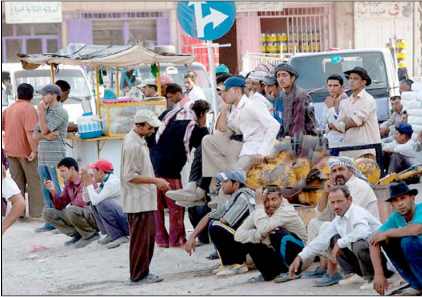
محافظة ذي قار تضم مئات الآلاف من العاطلين عن العمل من بينهم الكثير من الخريجين

فيما حذر متظاهر آخر يدعى الخفاجي من استحواد الأحزاب المنتفذة على الدرجات الوظيفية وتقاسمها فيما بينها وفق المحاصصة الحزبية وأوضح الخفاجي للمدى أن "الأحزاب السياسية الممتلئة في الحكومة المحلية أدبت في السابق على تقاسم الدرجات الوظيفية فيما بينها ونحن نخشى أن تتقاسم هذه الأحزاب الدرجات الوظيفية التي أعلن عنها مؤخراً"، محذراً من حرمان الخريجين غير المنتمين للأحزاب من فرص التعيين. وكانت إدارة محافظة ذي قار كشفت يوم الثلاثاء (٢٤ تموز ٢٠١٨) عن موافقة رئيس مجلس الوزراء حيدر العبادي على تخصيص ٧ آلاف درجة وظيفية ضمن حركة الملاك في الدوائر الحكومية، متوقفاً إطلاقها خلال مدة اسبوع وحال توفر الغطاء المالي من وزارة المالية، وذلك استجابة لمطالب المتظاهرين. وكان مجلس محافظة ذي قار كشف يوم الاثنين (٣ أيلول ٢٠١٨) عن تكليف خلية الأزمة بإعداد تقرير رسمي يبين أسباب تأخير إطلاق التعيينات في الدوائر الحكومية بالمحافظة، وحدد مهلة اسبوع واحد لإعداد التقرير، فيما دعا الدوائر المذكورة إلى احترام التوقيتات التي جرى تحديدها في وقت سابق. ويجد المئات من أهالي محافظة ذي قار، تظاهراتهم أمام مبنى المحافظة ومجلس المحافظة بالمطالبة بالخدمات وفرص التعيين والاحتجاج على انقطاع التيار الكهربائي وخصخصة الكهرباء وفرض وتسعيرة جديدة لا تتناسب مع دخل الشرائح الفقيرة ومحدودي الدخل.