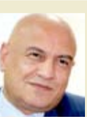
المشهد حافل بتقلبات عجيبة حتى بين أبناء المحور الواحد .. وكثيراً ما أرى حلفاء الأوس الذين اجتمعوا على غاية أو مشروع وقد أصبحوا فرقاً متناحرة ..

( رياضتيش ) أكثر الكلمات تداولاً اليوم في ساحتنا الرياضية ، فنحن أمام أسوأ مشهد يمكن نعيته في دنيا الرياضة .. لا حسيب .. لا رقيب .. لا سلطة تتدخل أو حتى تسأل .. فوضى عارمة لا قيعة فيها للموقع أو المركز .. ذلك لأن قوى التناحر لا تخضع لقانون أو عرف أو تقليدي اجتماعي ، إلا قانون أو عرف أو تقليد العشيرة والجماعة والحزب ، بينما صار التلويح بالرصاصة وهدر الدماء فصلاً وشيكاً ، ولا راد له إلا الإرادة الله.