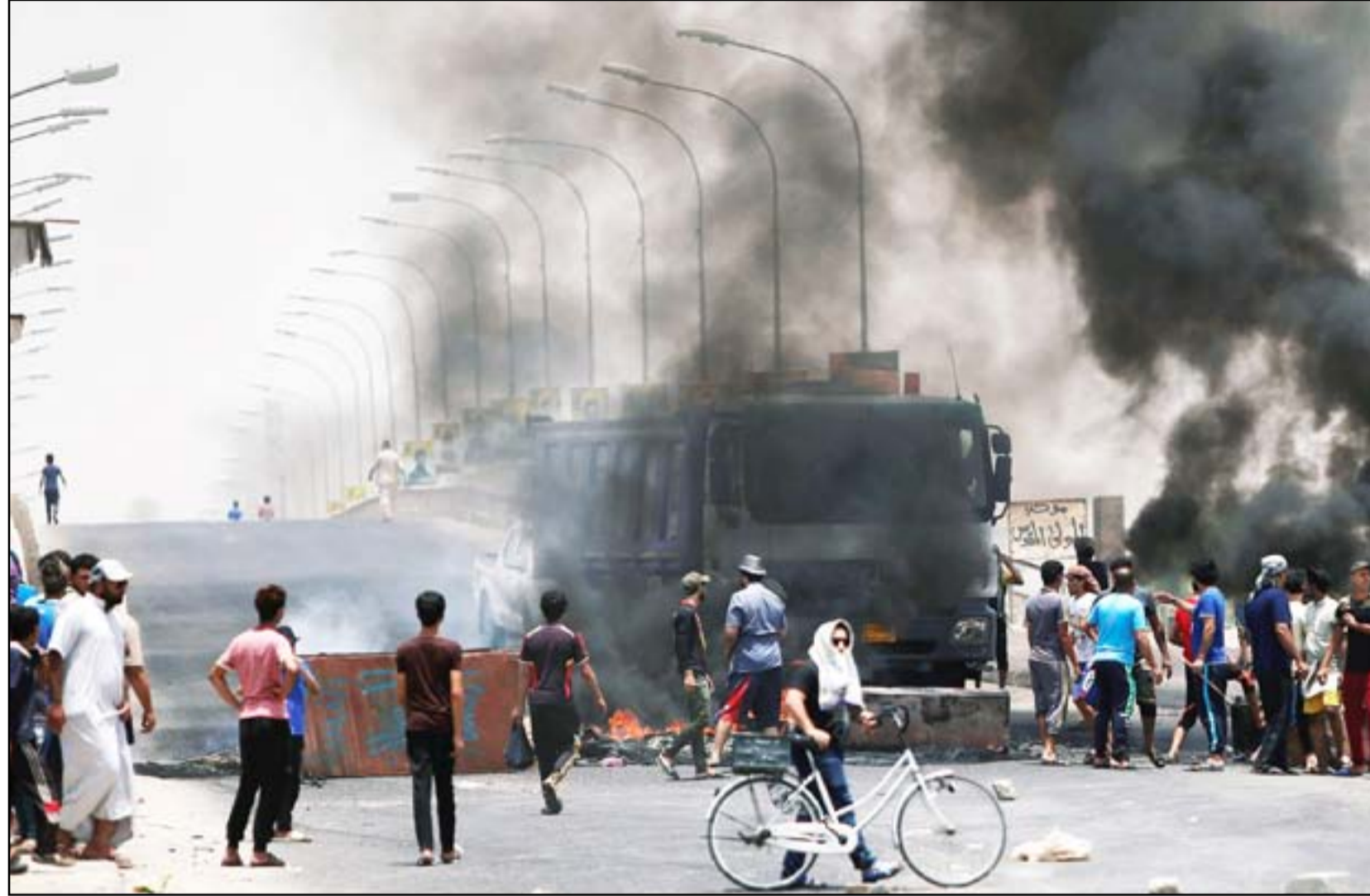
محتجون يقطنون طريقاً في محافظة البصرة.. أرشيف

ازدياد حالات التسمم بدوره قال عبد عون علاوي، النائب الجديد عن البصرة في تصريح