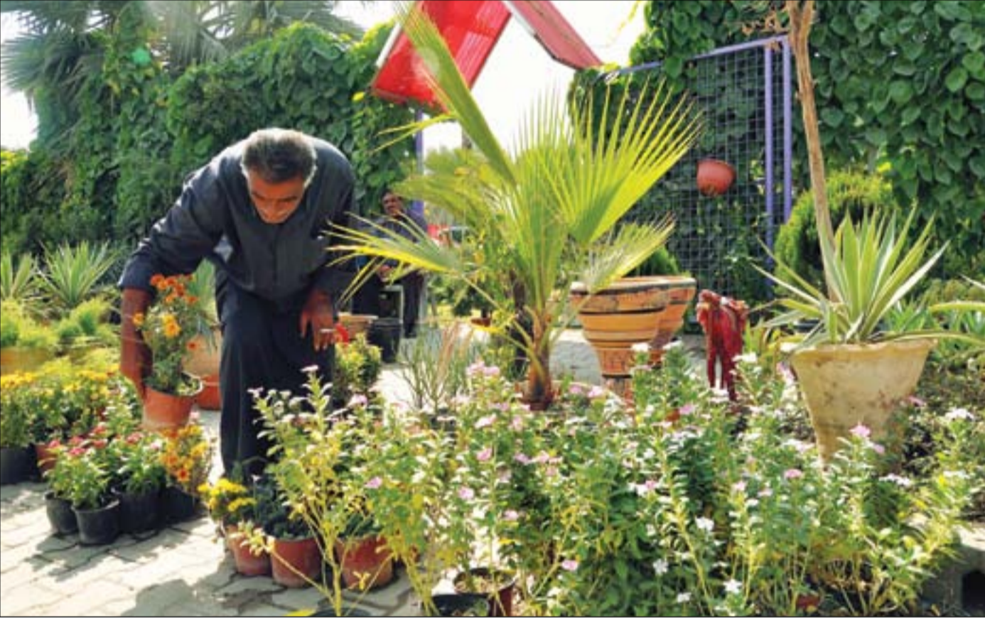
مشتل لبيع الزهور وسط بغداد.....

أفادت مصادر مطلعة بأن زعيم التيار الصدري مقتدى الصدر اختار عادل عبد المهدي مرشحاً لتسوية لرئاسة الحكومة المقبلة من بين قائمة مكونة من أربعة أسماء قبل إنها اقتُرحت على الصدر قبل يومين. كما تقول المصادر، تمت