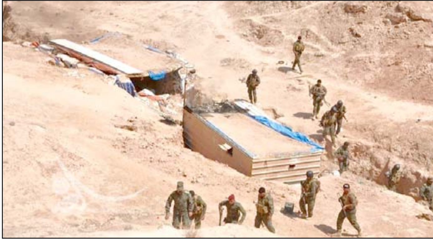
قوة عسكرية تتحرر على مضافة لداعش في جبال حمرين.. (أرشيف)

أسس أيضاً، قتل خمسة عناصر من الشرطة الاتحادية وأصيب آخرون بتفجير عبوة ناسفة استهدفت باصاً يقلّهم من كركوك باتجاه بيجي. وكان التنظيم قد شنّ هجوماً مزدوجاً قبل أسبوع في مطعم شعبي قرب بيجي نفذه انتحاريان اثنان وتسبب بمقتل