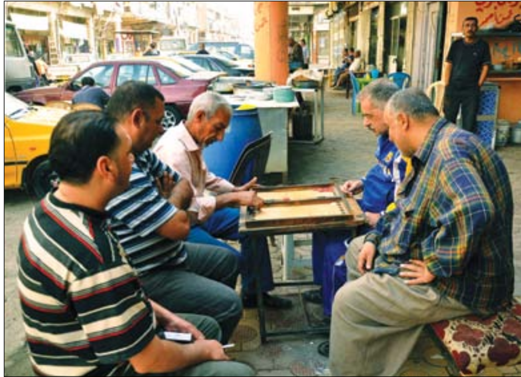
(الطاولي) يجذب كبار السن الى المقاهي البغدادية القديمة.....