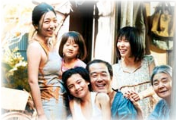
فيلم سارفو المتاجر