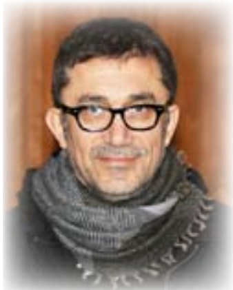
المخرج نوري جيلان