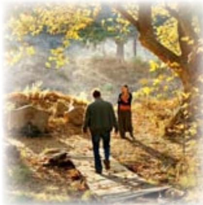
شجرة الكثرى البرية