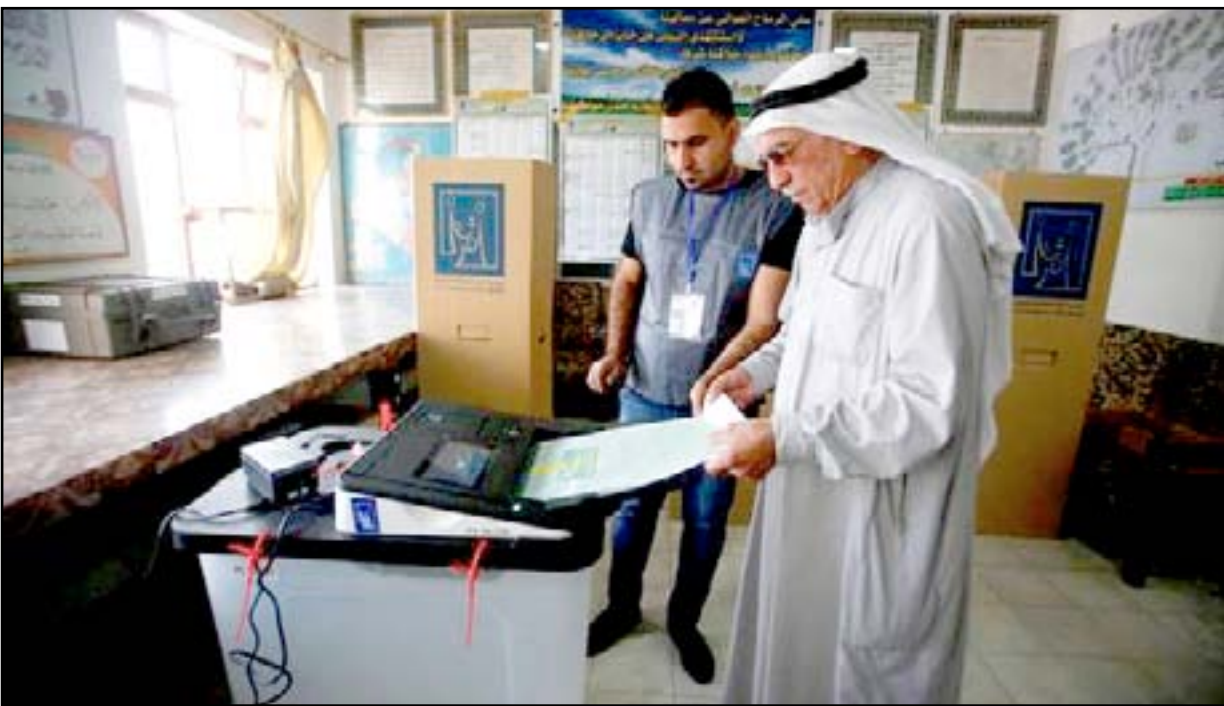
رجل يدلي بصوته في الانتخابات الماضية..