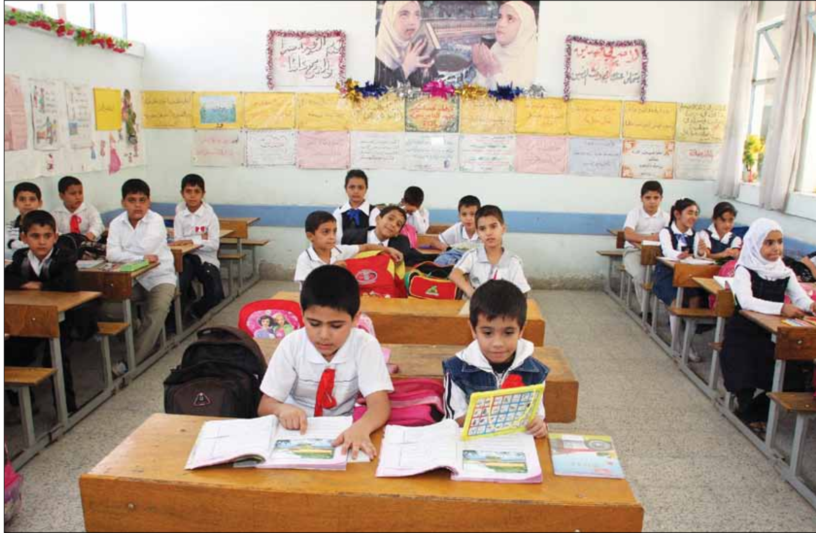
المدارس تفتح أبوابها في العام الدراسي الجديد ..... عدسة: محمود رؤوف

وكانت (المدى) قد كشفت في عددها الصادر الأحد عن تلقي كل من ائتلاف سائرون والفتح قبل عشرة أيام إشارات وُصفت بالإيجابية نقلها أشخاص