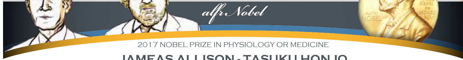
2017 NOBEL PRIZE IN PHYSIOLOGY OR MEDICINE JAMEAS ALLISON - TASUKU HONJO

للخلايا. وتمكن أوسومي من تحديد الجين المسؤول عن تنظيم عملية "الالتهام الذاتي" للخلايا وهو مصطلح طبي حديث يعبر عن التهام الخلايا الدهون والأجزاء التالفة وتحويلها إلى مواد عضوية وإصلاح التلف. ويُعد عمل أوسومي شديد الأهمية للتعرف على المشاكل الجسدية التي تسبب عددا من الأمراض الغامضة مثل السرطان وباركنسون.