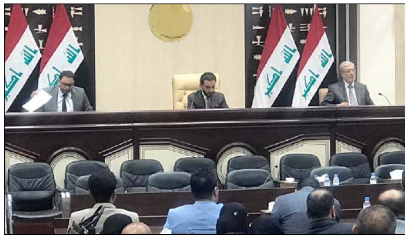
جلسة سابقة لمجلس النواب... (أرشيف)

أعلنت الأمم المتحدة، أمس الإثنين، حصيلة أعداد الضحايا في العراق لشهر أيلول ٢٠١٨، مشيرة إلى مقتل ٧٥ مدنياً عراقياً وإصابة ١٧٩ آخرين جراء أعمال الإرهاب والعنف والنزاع المسلح. وقالت بعثة الأمم المتحدة لمساعدة العراق (يونامي)، في بيان إن "الأرقام التي سجلتها البعثة أفادت بمقتل ما مجموعه ٧٥ مدنياً عراقياً وإصابة ١٧٩ آخرين، جراء أعمال الإرهاب والعنف والنزاع المسلح التي وقعت في العراق خلال شهر أيلول ٢٠١٨". وأضافت إن "هذه الأرقام تشمل سائر المواطنين وغيرهم ممن يعد من المدنيين وقت الوفاة أو الإصابة - كالشرطة في مهام غير قتالية والدفاع المدني وفرق الأمن الشخصي وشرطة حماية المنشآت ومنتسبي قسم الإطفاء". وأوضحت أنه "من بين مجمل الأعداد التي سجلتها بعثة الأمم المتحدة لمساعدة العراق (يونامي) في شهر أيلول، قتل ٧١ مدنياً (غير شامل للشرطة) ولم تقع إصابات". وأشارت بعثة الأمم المتحدة لمساعدة العراق (يونامي) إلى أن "محافظة بغداد كانت الأكثر تضرراً، حيث بلغ مجموع الضحايا المدنيين ١٠١ شخص (٣١ قتيلاً و٧٠ جريحاً)، تلتها محافظة الأنبار (١٥ قتيلاً و٣٧ جريحاً)، ثم محافظة صلاح الدين (٩ قتلى و٣٨ جريحاً). وقد حصلت البعثة على أعداد الضحايا المدنيين في الأنبار من دائرة صحة الأنبار وتم تحديثها حتى ٣٠ أيلول (شامل هذا التاريخ)". وأوضحت البعثة أنها "أعيتت من التحقق، على نحو فعال، من أعداد الضحايا في مناطق معينة، وهناك بعض الحالات التي لم تتمكن فيها من التحقق إلا بشكل جزئي فقط من حوادث معينة"، مبيّنة أنه "تم الحصول على أعداد الضحايا في محافظة الأنبار من دائرة صحة الأنبار، وهي قد لا تعكس بشكل كامل عدد الضحايا بسبب زيادة تقلب الوضع على الأرض في الأنبار وتعطل الخدمات".