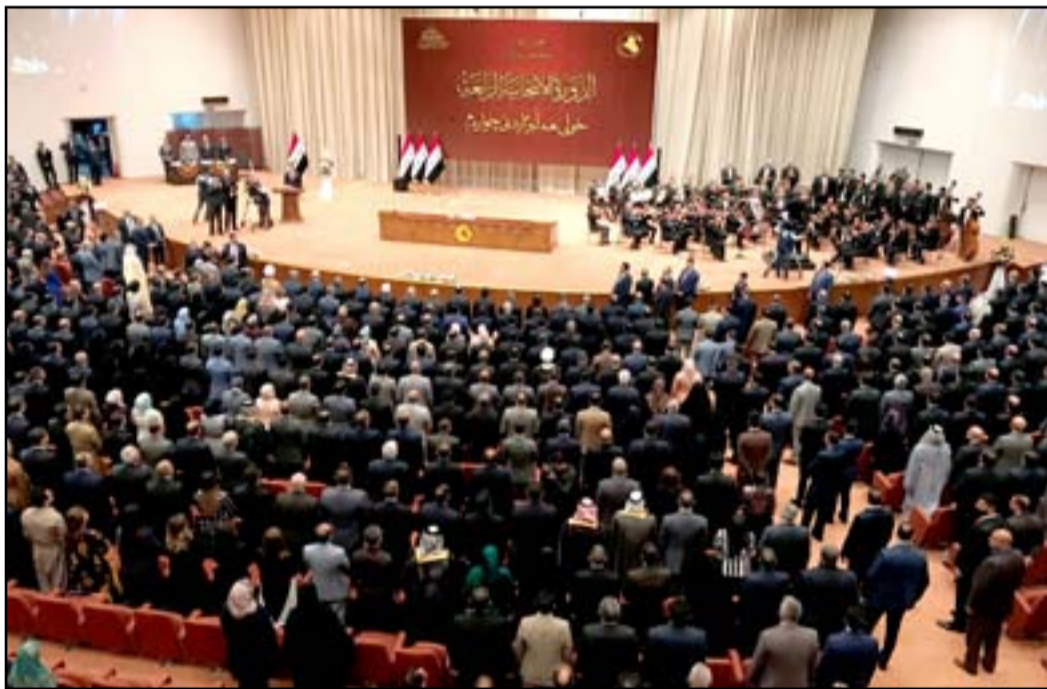
جلسة منح الثقة لحكومة العبادي

وأظهرت نتائج الانتخابات التي جرت في ١٢ أيار الماضي، تراجع ائتلاف العبادي إلى المركز الثالث، وهي المرة الأولى التي يحصل فيها حزب بالسلطة على مركز متدنٍ في الانتخابات. وأرجع ذلك إلى مجموعة عوامل تسببت في قضية الإصلاحات ومحاربة الفساد التي تعامل معها رئيس الوزراء المنتهية ولايته بنفس طريقة الملفات السابقة. وعلى وفق تلك النتائج شعر حزب الدعوة الذي انشطر أنصاره إلى قائمتين، بأن حظوظه في الحفاظ على منصب رئاسة الوزراء باتت صعبة. وظهرت خلافات الحزب إلى العن بين جناحي العبادي والمالكي، حتى جاءت أزمة البصرة لتنتهي بوجود الحزب والعبادي معاً على رأس السلطة التنفيذية.