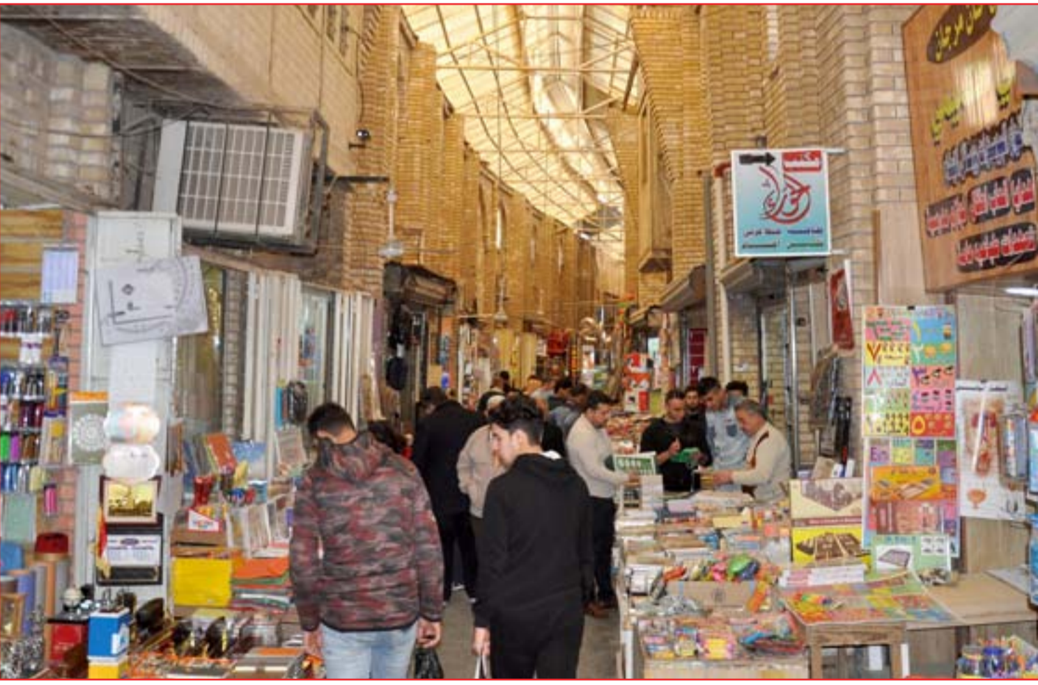
الإقبال على محال القرطاسية يتراجع بعد موسم تجاري نشط ..... عدسة: محمود رؤوف