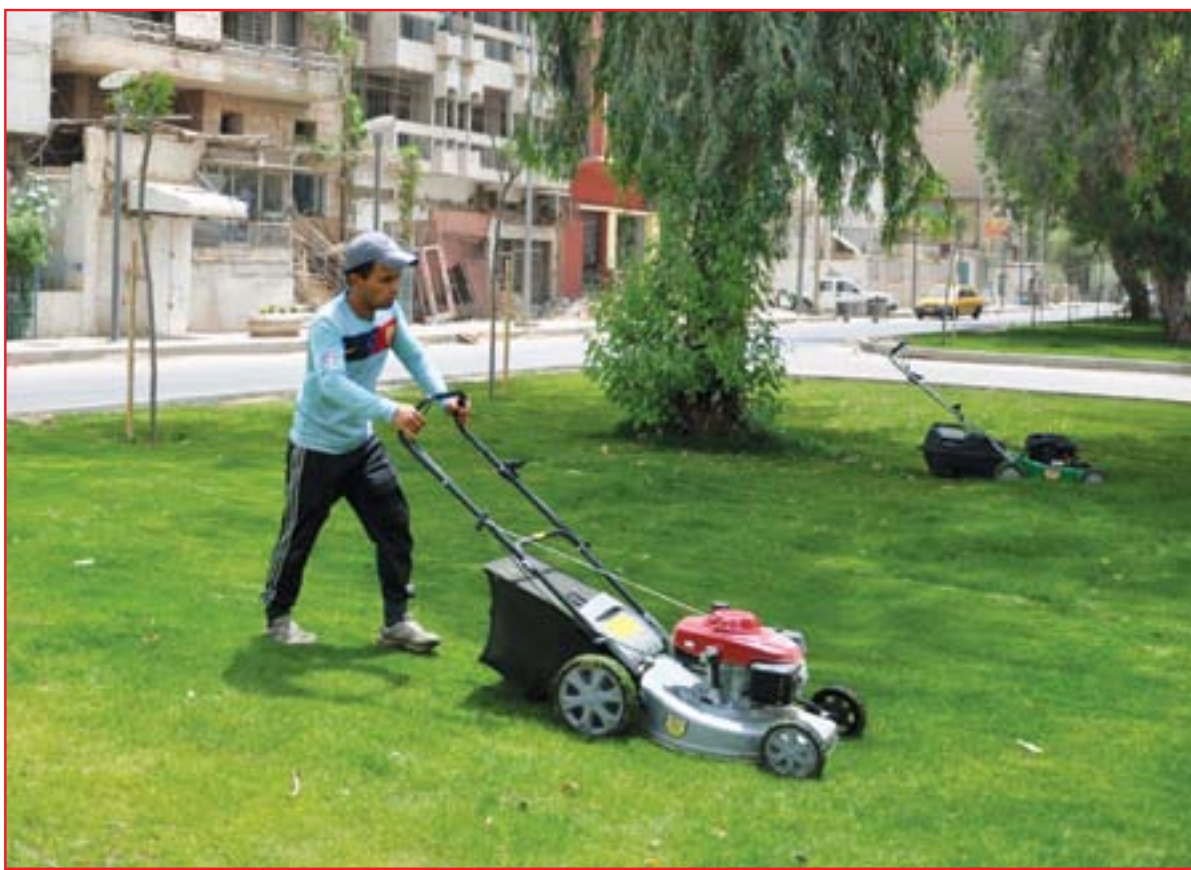
حملة تنظيف في حدائق بغداد بعد موجة أمطار ورياح.....