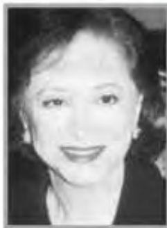
معترفاً به في الإذاعة.