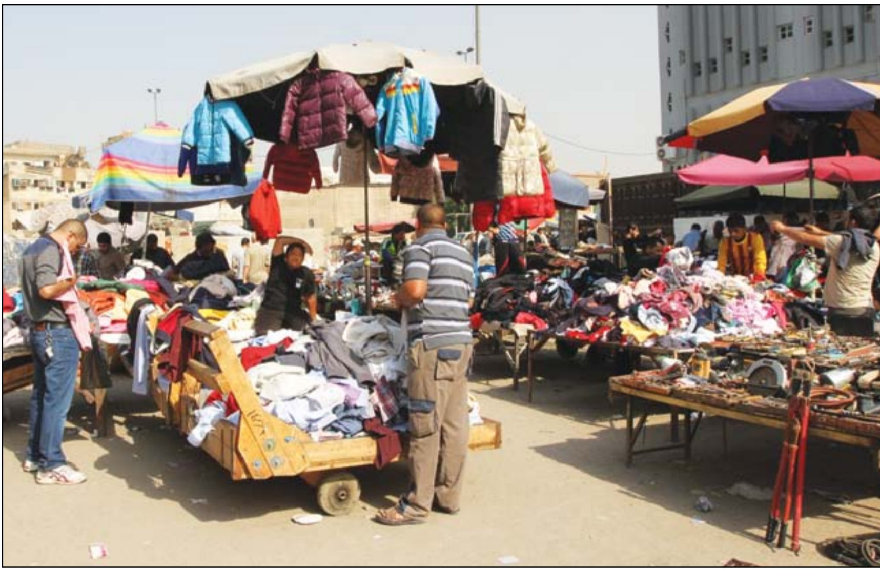
أصحاب (جنابر) البالة يبدؤون عرض الملابس الشتوية ..... عدسة: محمود رؤوف

موقع أميركي: رفض مرشحي الكابينة الحكومية يُنبئ بتحديات عصيبة تواجه عبد المهدي