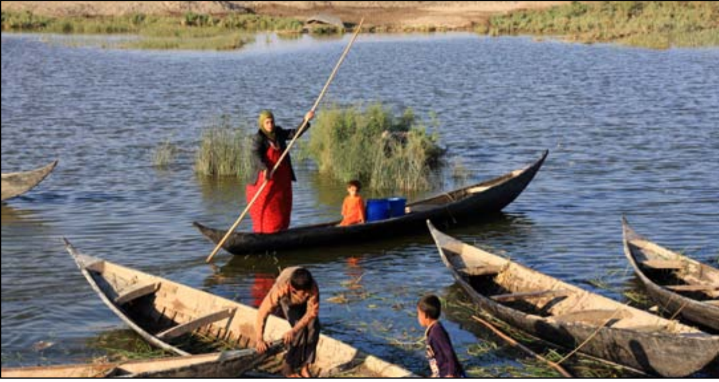
■ ذي قار / حسين العامل

أعلن ناشطون في مجال بيئة الأهوار يوم السبت (27 تشرين الأول 2018) عن تنظيم حملة لإنقاذ الأهوار العراقية من مخاطر الجفاف تحت مسمى ألق الأهوار وذلك على غرار ألق بغداد التي ينظمها الموسيقار نصير شمه، وفيما بينوا أن الحملة تصب في دعم الأهوار العراقية والضغط على المستويات المحلية والإقليمية والدولية لتوفير حصة مائية خاصة بمناطق الأهوار، أكدوا تراجع مساحات الأهوار المغمورة بالمياه من 72 بالمائة إلى أقل من 20 بالمائة حالياً.