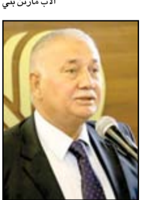
الأب مارتن بني

كان حبي دائماً ما يقارن بينه وبين رمز عراقي آخر وهو الأب الكرملّي فيقول إنهما يتشابهان بشكل عجيب كلاهما طور ثقافته، هذا الإنسان الكبير والإب المعطاء والشخصية الإنسانية المتسعة كانت أقداره غير ما يتخيل لها، وهو شخصية معطاءة كمّاً ونوعاً ودؤوبة بشكل كبير فبعد تأسيس الجمعية العراقية الفلسفية قرروا الاحتفاء في بيت الحكمة وقدم الأب حبي بحثين بهذه الاحتفالية، وكان حين يتحدث كأنه يكتب، فله قدرة لغوية عالية وثقة بالنفس وثقة في عراقيته أيضاً".