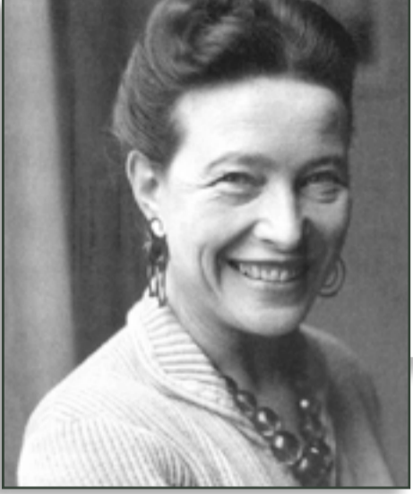
سيمون دي بوفوار

"من يريد إقناع الآخرين يجب أن يكون مستعداً لتحويل كلماته لأفعال"، كانت هذه الكلمات تعيش معها، منذ أن سمعتها أول مرة من رفيق رحلتها في الحياة والفلسفة جان بول سارتر. أمنت سيمون دي بوفوار أن الإنسان حرياً اختيار مشروعه الذي يتطلع الى تحقيقه، والذي من خلاله يحقق وجوده ويثبت حريته. وبما أن حرية الإنسان هي أساس كل القيم، فهي أيضاً مصدر القانون والواجب والحق.