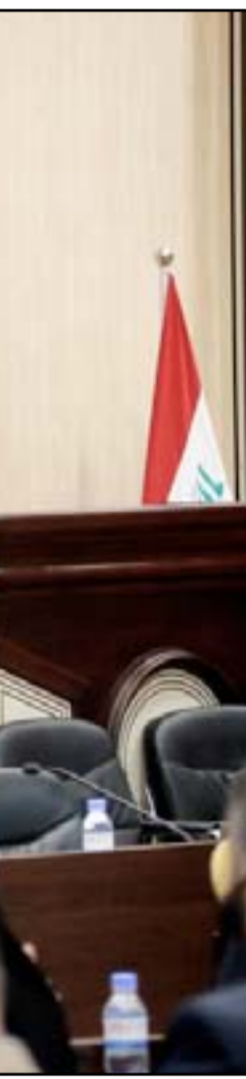
جلسة سابقة لمجلس النواب

أما في ما يتعلق بتعديل فقرات النظام الداخلي يوضح النائب عن محافظة الأنبار أن "هناك نيّة مجلس النواب لإجراء تعديل على قرابة خمسين مادة في النظام الداخلي من أجل تقويم العمل التشريعي وإعطاء الدور الرقابي والتشريعي للنائب داخل