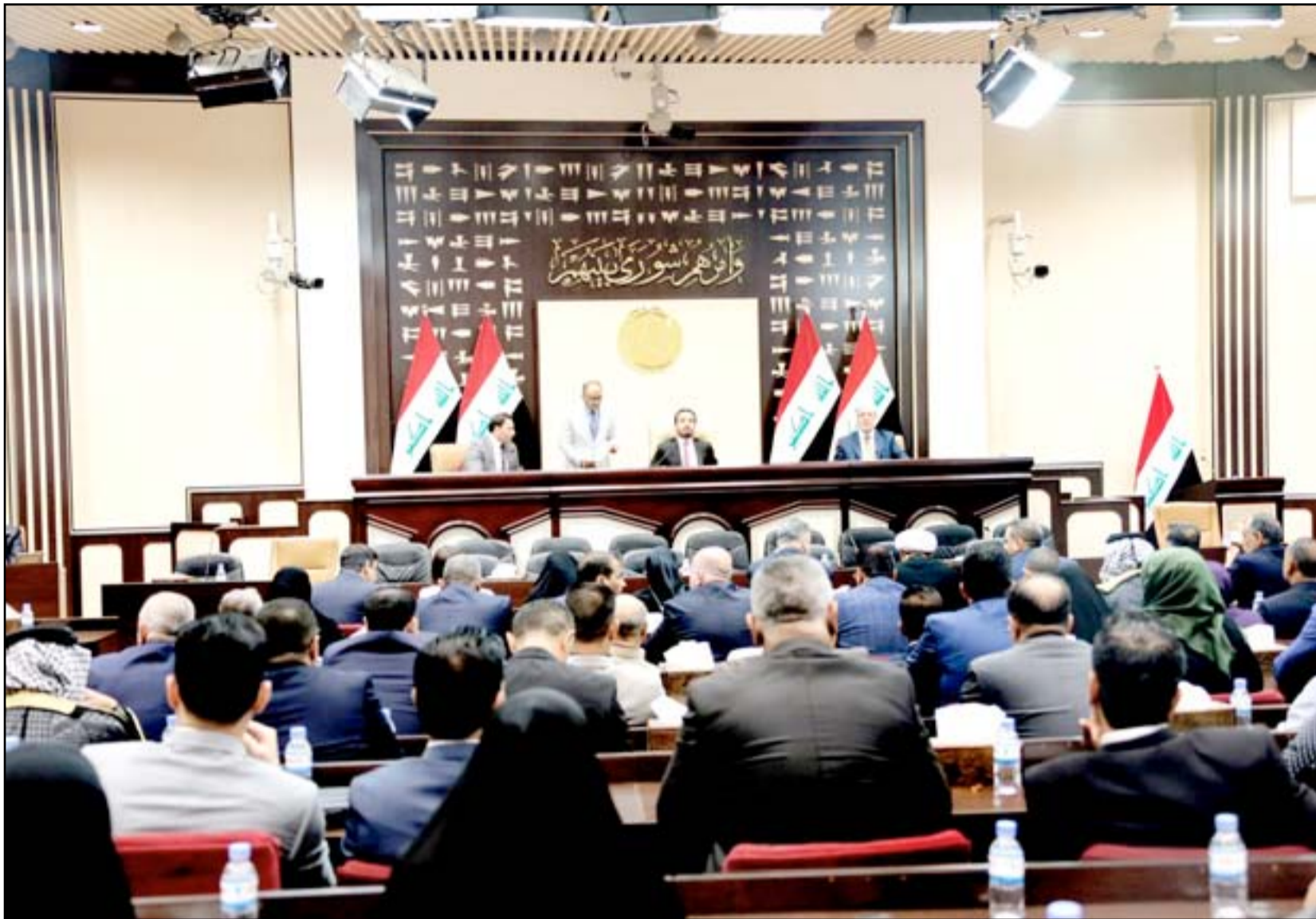
جلسة سابقة لمجلس النواب.. (أرشيف)

فيما حسمت التفاهات الأولية الدائرة بين تحالفي الإصلاح والبناء أسماء مرشحي خمس وزارات شاعرة في حكومة عادل عبد المهدي، تواصل الكتل البرلمانية حراكها للاتفاق على مرشحي حقائب الدفاع والداخلية والعدل. وتأمل الأطراف البرلمانية أن يتمكن رئيس مجلس الوزراء من تسمية كل المرشحين للوزارات الثماني المتبقية خلال فترة المفاوضات الجارية مع الكتل السياسية من أجل التصويت على الأسماء الجديدة في جلسة منتصف الأسبوع المقبل. وكان رئيس مجلس النواب محمد الحلبوسي قد أكد في تصريح صحفي، أن تسمية الوزراء الثمانية المتبقين في حكومة عبد المهدي ستتم قريباً، مبيناً أنه لا توجد مشكلة في ترشيح "حزبيين أكفاء".