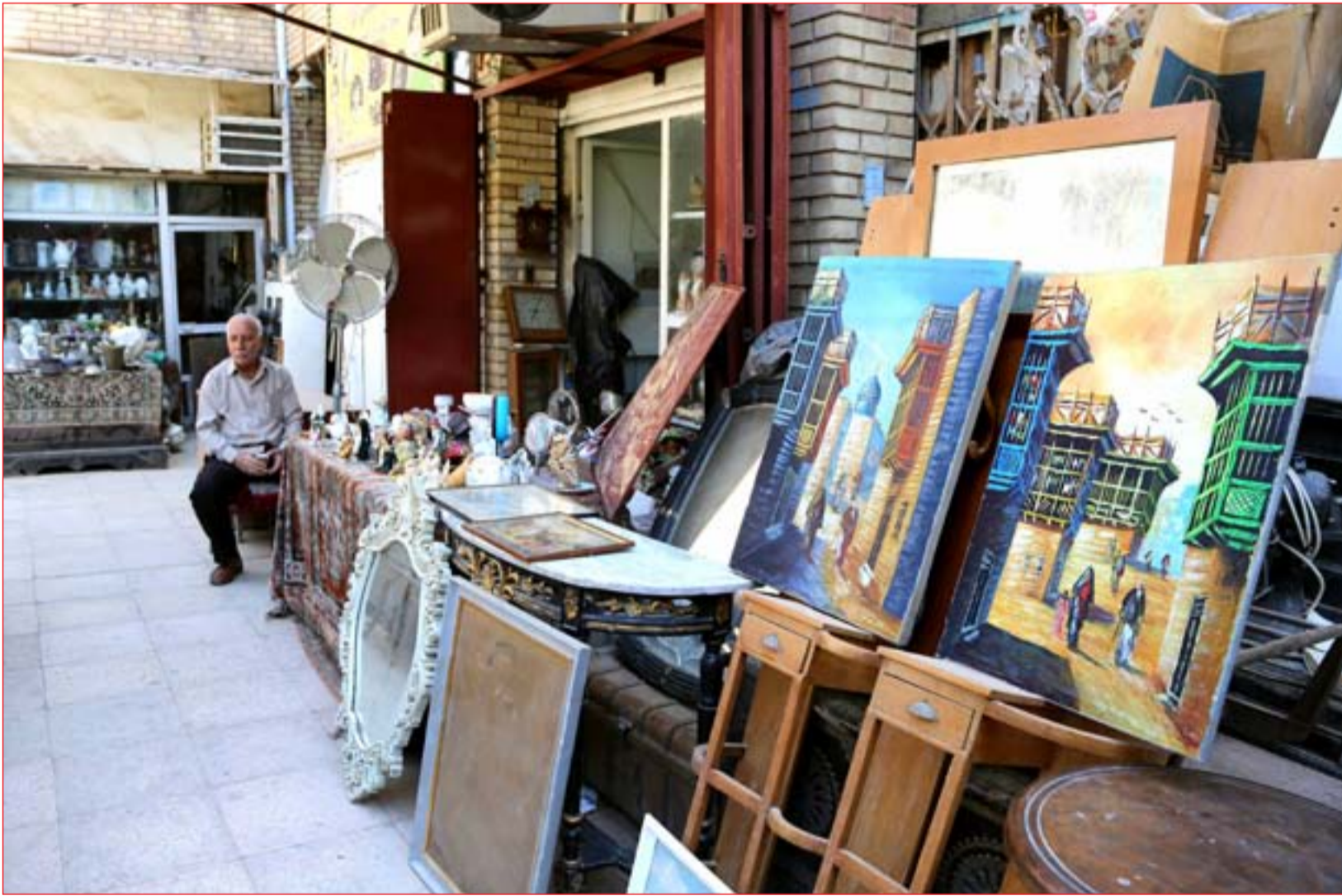
محل لبيع اللوحات الجدارية والانتيكات في بغداد.....