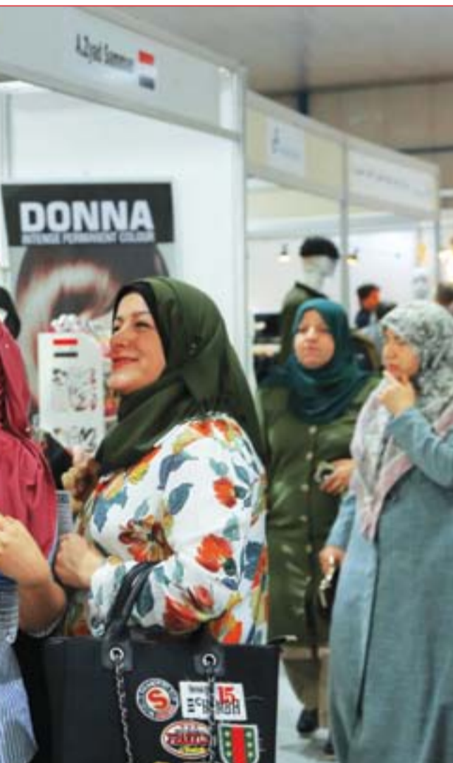
حضور نسائي مميز في معرض بغداد الدولي ..... عسة: محمود رؤوف

الحلبوسي من الأنبار: لا بد من تشريعات تنشيط القطاع الخاص وتنهاي البطالة