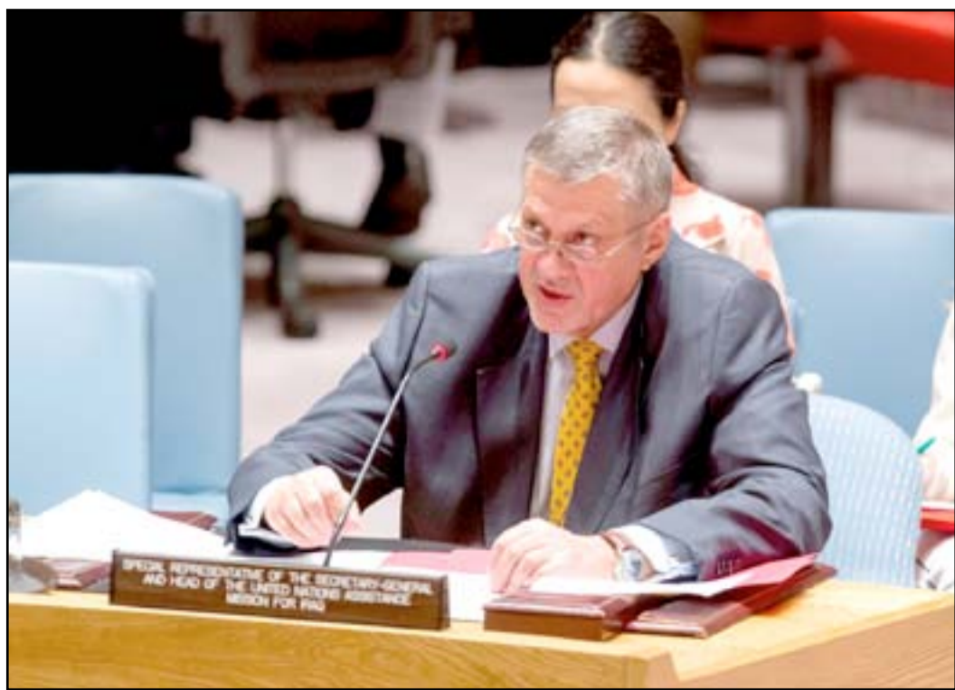
ترجمة/ حامد أحمد

وأضاف المبعوث الخاص كوبيتش، الذي ستنتهي مهامه في العراق بداية العام القادم بعد أربعة اعوام قضاه في البلد، بأن الفترة الاستثنائية الصعبة التي خدم فيها كمبعوث للامم المتحدة في العراق "قد انتهت على