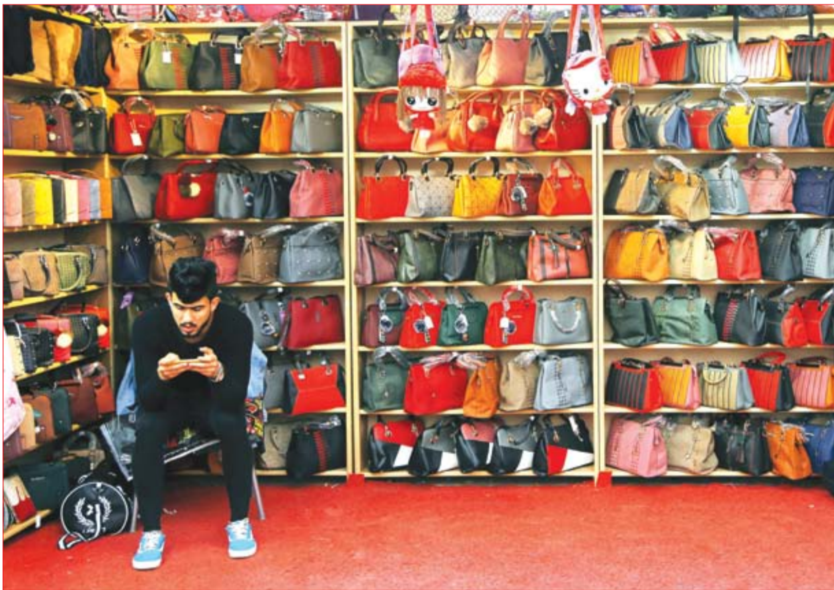
لعبة البويجي تستهوي الشباب ..... عداة: محمود رؤوف