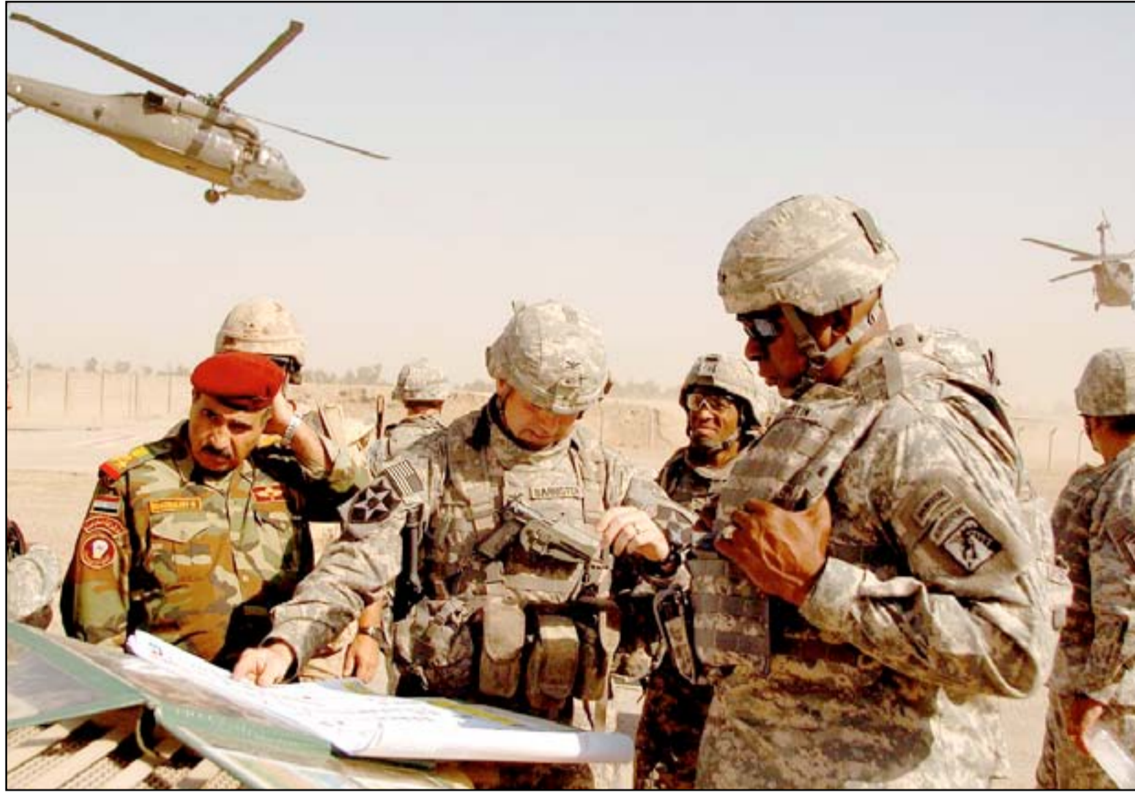
مستشارون أميركان ضمن قوات التحالف الدولي في قاعدة الأسد.. (أرشيف)