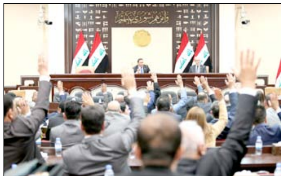
جلسة سابقة لمجلس النواب..

وأعلنت الأمانة العامة لمجلس الوزراء في 28 تشرين الأول 2018، عن موافقة الحكومة على مشروع قانون الموازنة المالية لعام 2019، وإحالة إلى مجلس النواب استناداً إلى أحكام المادتين (61/61) البند أولاً و 80/ البند ثانياً) من الدستور. إلا أن مجلس النواب رفض قبولها من حيث المبدأ بسبب تحفظ الكثير من كتله على العديد من فقرات قانون الموازنة العامة مطالباً إلزام الحكومة بإجراء تعديلات جذرية على مواد الموازنة قبل عرضها للقراءة الأولى. ويستعرض رئيس اللجنة المؤقت أبرز المشكلات التي تواجه تمرير