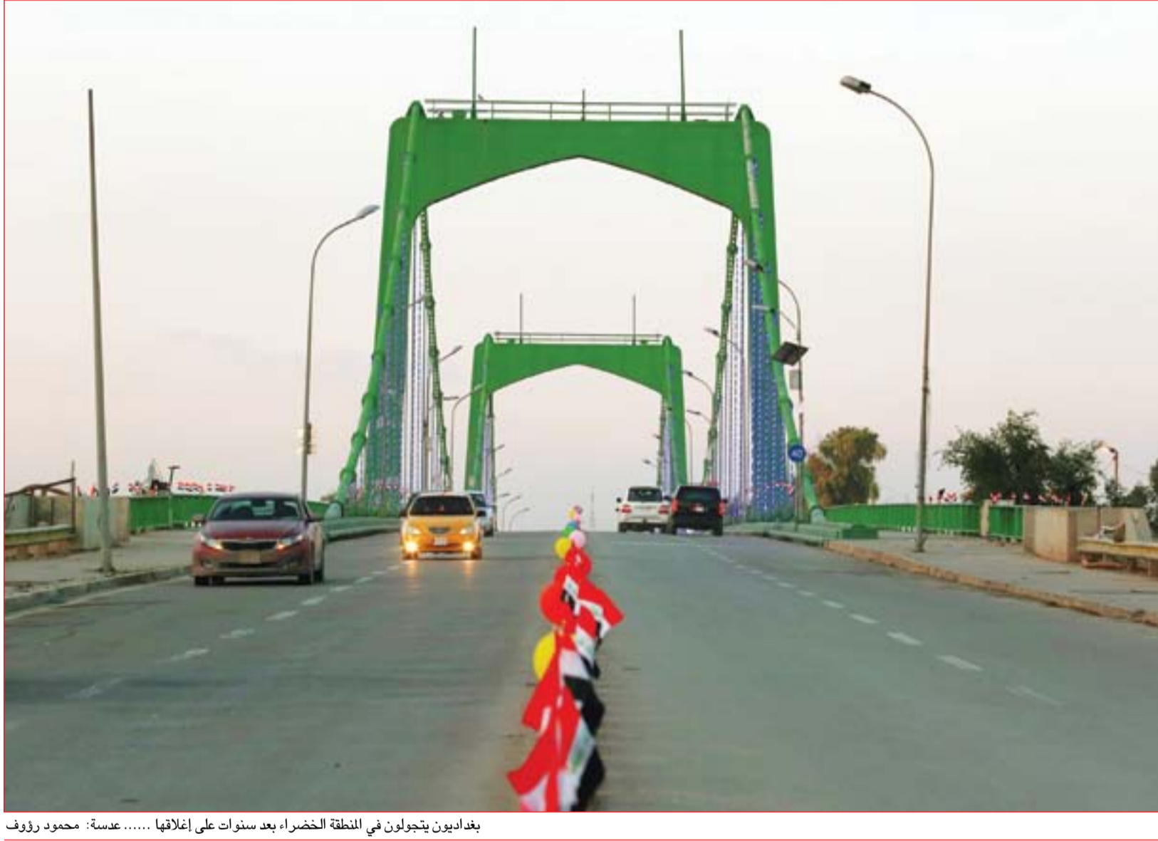
بغداديون يتجولون في المنطة الخضراء بعد سنوات على إغلاقها ..... عدسة: محمود رؤوف

التقى الرئاسات الثلاث في بغداد وبارزاني في إقليم كردستان