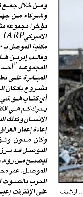
مبنى مدمر داخل جامعة الموصل.. أرشيف

تعرضت للحرق المتعمد، وشكلت خسارة كبيرة لا تعوض للجانب الثقافي