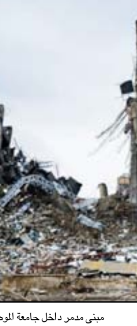
مبنى مدمر داخل جامعة الموصل

في المكتبة مع الخرائط والوثائق والنصوص الأكاديمية والكتب فقد