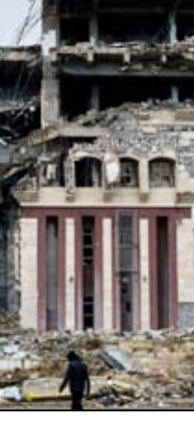
مبنى مدمر داخل جامعة الموصل.. أرشيف

كان تنظيم داعش قد أتلف القسم الأعظم من الجامعة، أما المخطوطات التاريخية